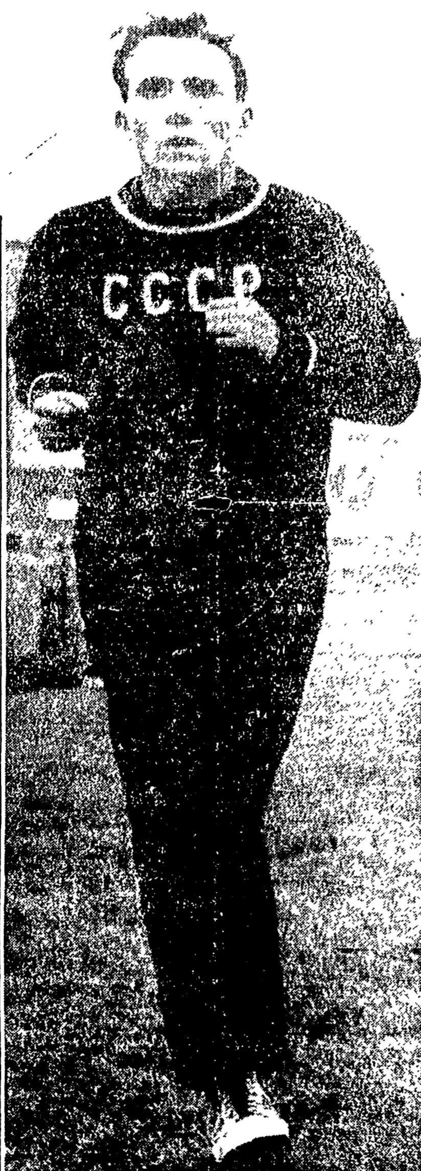
Il primatista mondiale WLADIMIR KUTS