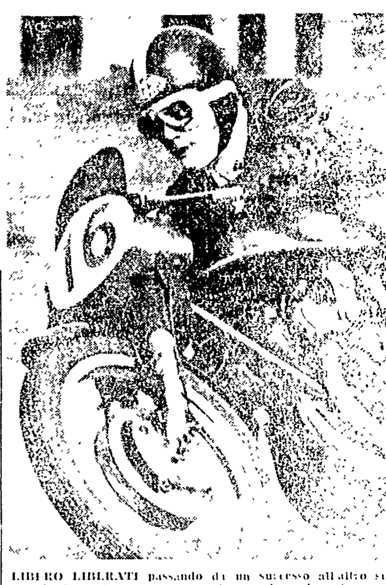
LIBRARI LIBRARI passando da un successo all'altro si è ormai affermato come un grande campione, ben deciso del titolo tricolore.

Il nostro è stato il primo a scendere in pista. E' stato il nostro a conquistare il titolo, passando da un successo all'altro, in un'autostrada, in un'autostrada, in un'autostrada.