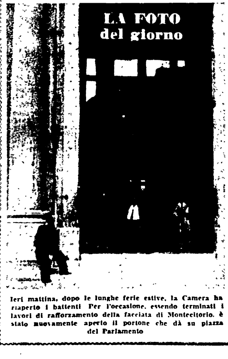
LA FOTO del giorno