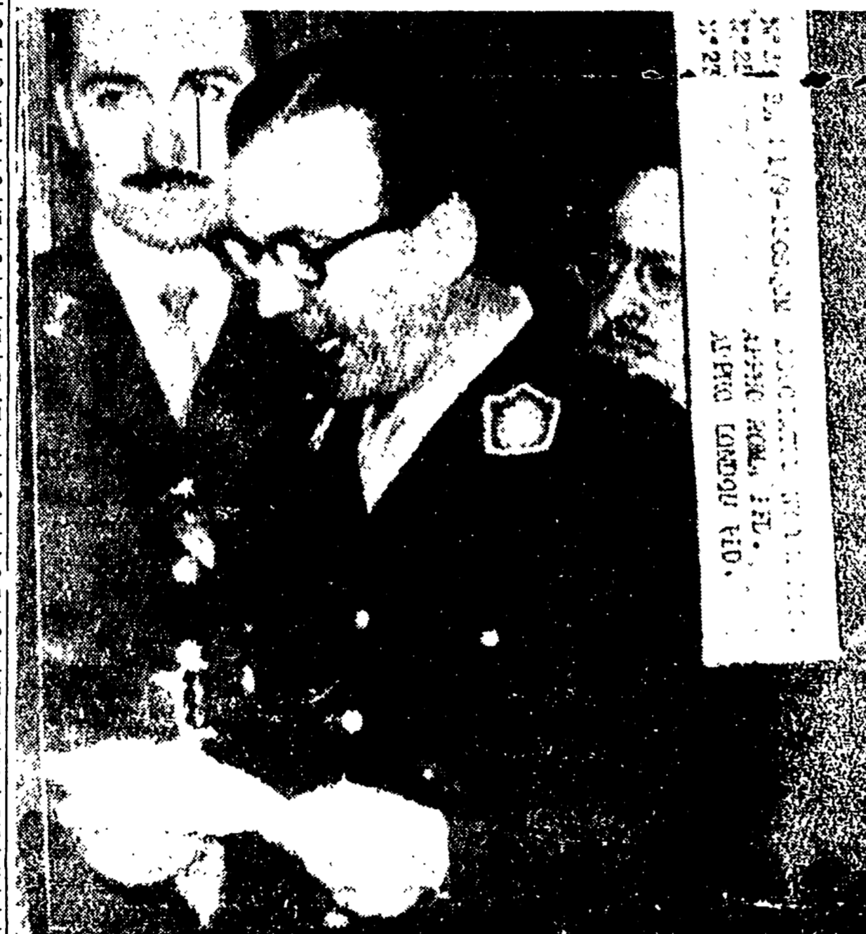
CORDOBA — Il generale Eduardo Lonardi, capo degli insorti e da ieri sera presidente provvisorio dell'Argentina, mentre legge il suo radiomessaggio alla nazione

Il capo del nuovo «governo provvisorio», succeduto alla giunta, atteso per stamane a Buenos Aires - I capi del putsch di giugno carcerati - Centinaia di persone massaccrate nel cannoneggiamento di una sede peronista