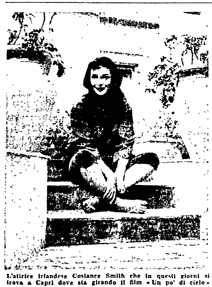
L'attrice irlandese Costance Smith che in questi giorni si trova a Capri dove sta girando il film «Un po' di cielo».

giava certo prenderlo al tragico e far degenerare in dramma, intervenendo con urlaci e scappaccioni, le piccole scene di dispetto di cui si può essere vittime o testimoni, o peggio ancora, ricorrere alle rappresaglie. Un rimedio efficace — per questo come per tanti altri difetti — sarà invece tener occupato il ragazzo dandosi responsabilità di cui possa sentirsi fiero, facendo appello alla sua collaborazione, trattandolo su un piano e con un tono d'uguaglianza che, anziché distruggere il suo rispetto per l'adulto, lo renderà più forte fondandolo sulla fiducia. Ada Marchesini Gobetti