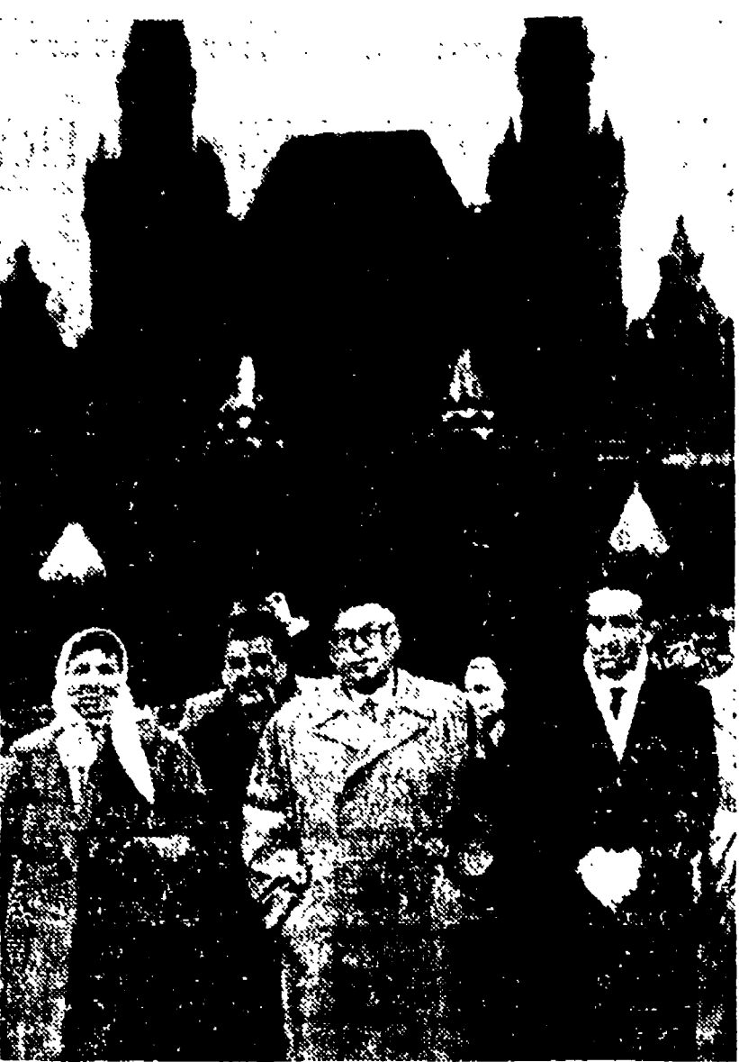
MOSCA. - Il compagno Pietro Nenni fotografato con la moglie e la figlia sullo sfondo del Cremlino prima della partenza per Pechino.

HONG KONG, 28. - Il mercantile norvegese «Hoi Houw» è stato attaccato sulla rotta della Cina da due aerei americani dell'aviazione di Cian Kai-sek, che hanno aperto il fuoco uccidendo due marinai.