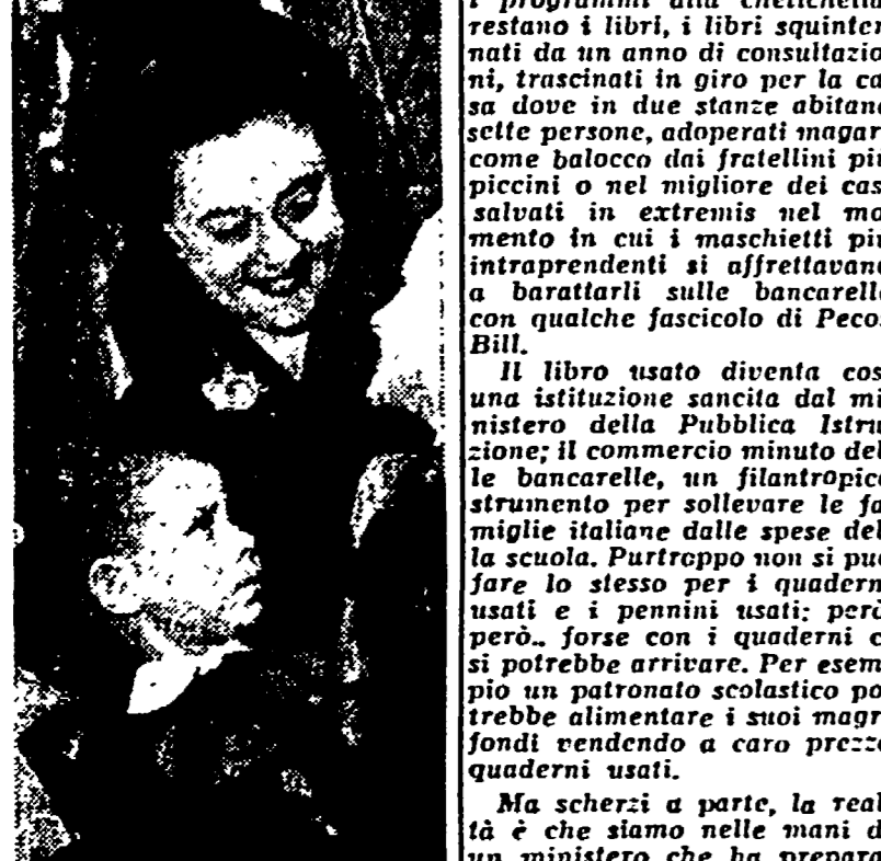
Momenti che ritornano ad ogni inizio di anno scolastico: l'abbraccio della mamma, i fiori alla maestra.

Questo abbiamo letto all'approssimarsi dell'apertura dell'anno scolastico sul Quotidiano e sul Messaggero e altri giornali governativi. Pochi giorni dopo abbiamo appreso che qualcosa si intendeva fare, al ministero dell'Istruzione, di fronte a queste cifre paurose. Davvero si pensava di correre ai ripari, e come? In un modo abbastanza semplice, in uno di quei modi artigianali, all'antica, che caratterizzano così gaudiosamente tanti aspetti della vita italiana.