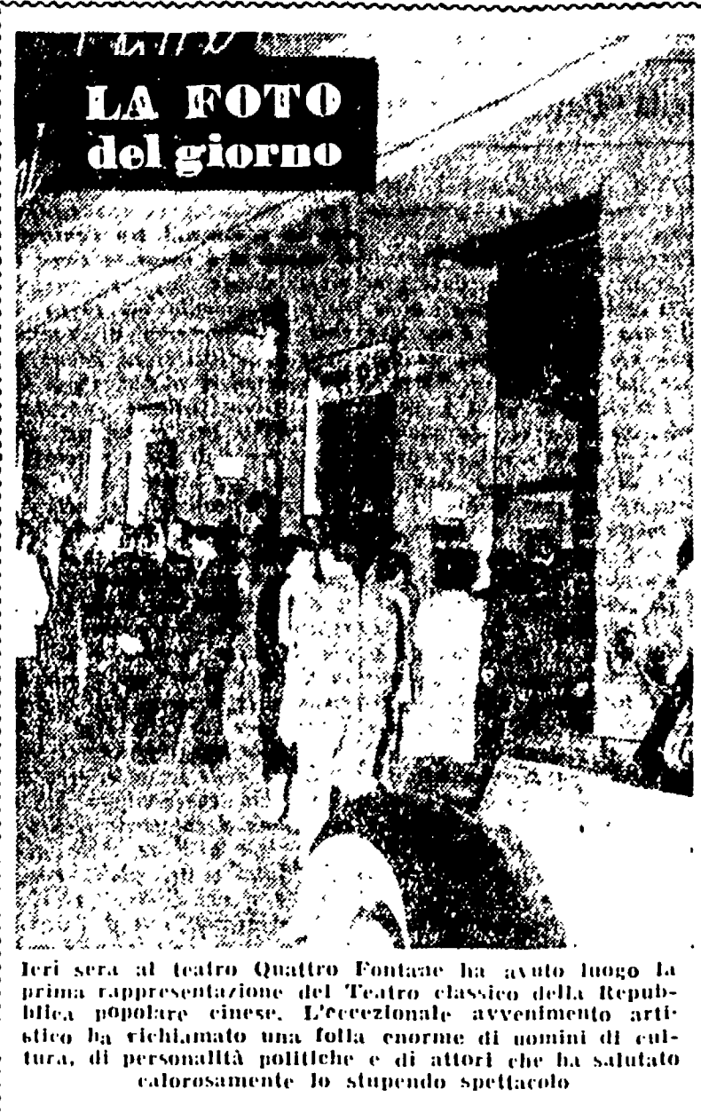
LA FOTO del giorno