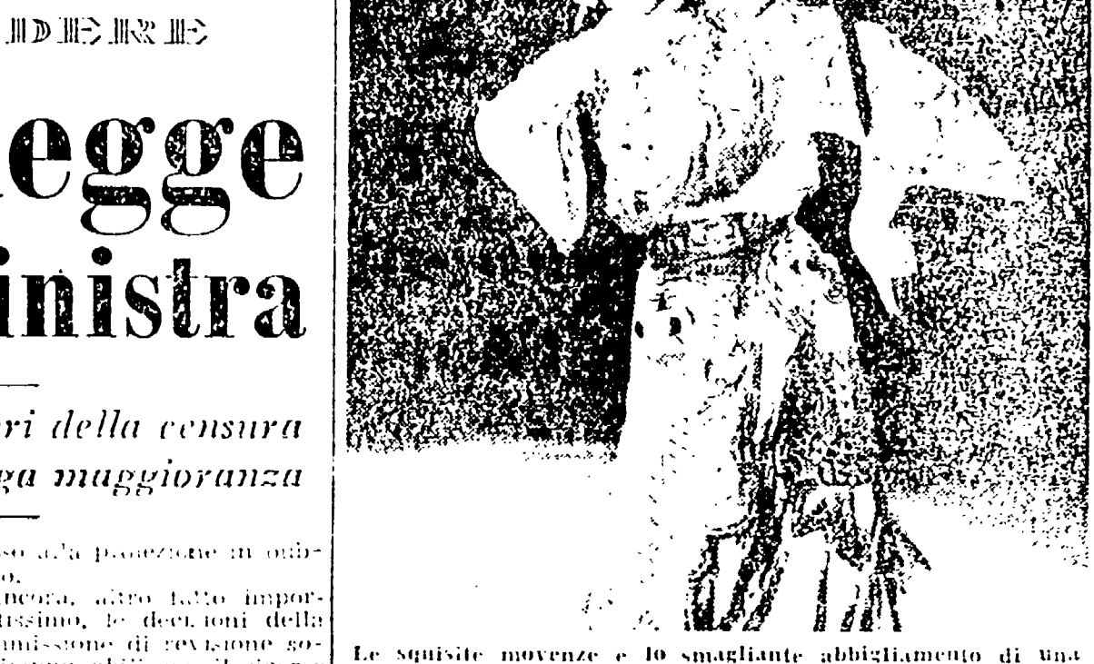
Le splendide danze e lo smagliante abbellimento di una giovane danzatrice del Teatro classico cinese

La danza dei nastri rossi è stata il pubblico più della danza di gioia e di giovinezza. Portata dalla piazza della Tien-an-men, dalle sue di Cina, dalle strade delle città e delle campagne al palcoscenico del Teatro Quattro Fontane, ecc.