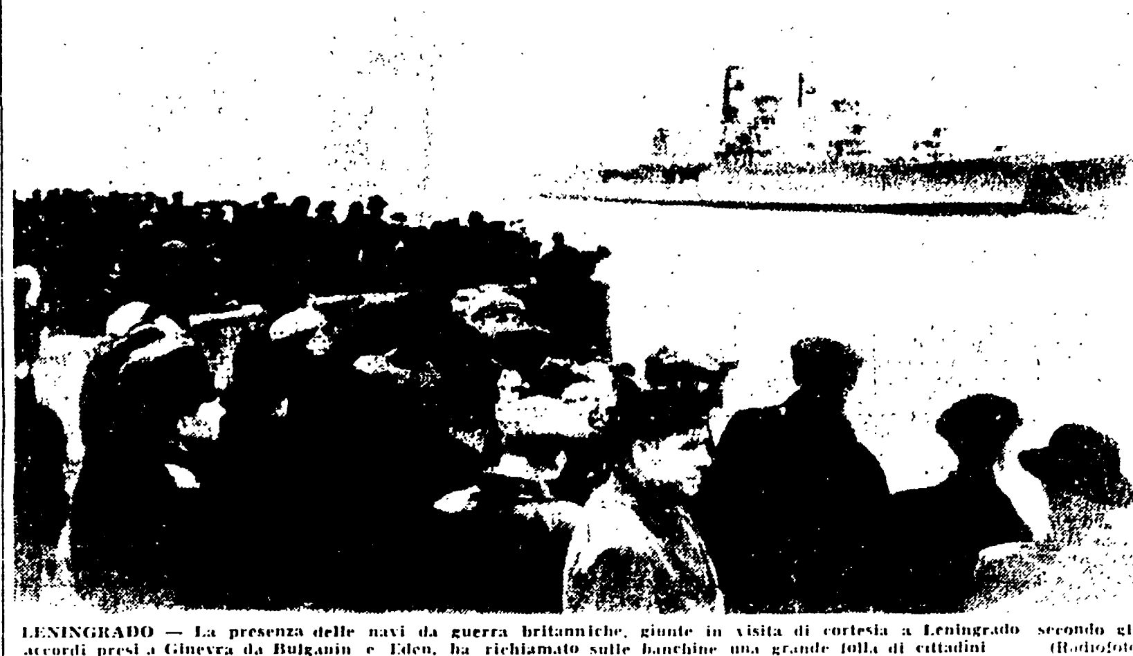
Leningrado — La presenza delle navi da guerra britanniche, giunte in visita di cortesia a Leningrado secondo gli accordi presi a Ginevra da Bulganin e Eden, ha richiamato sulle fianchine una grande folla di cittadini.