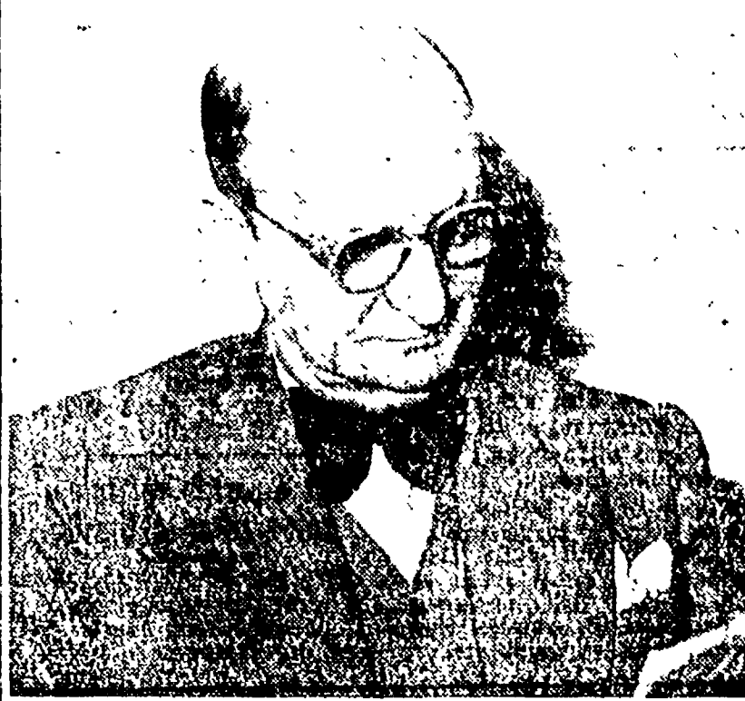
L'ex ministro dell'Industria Villabrunga