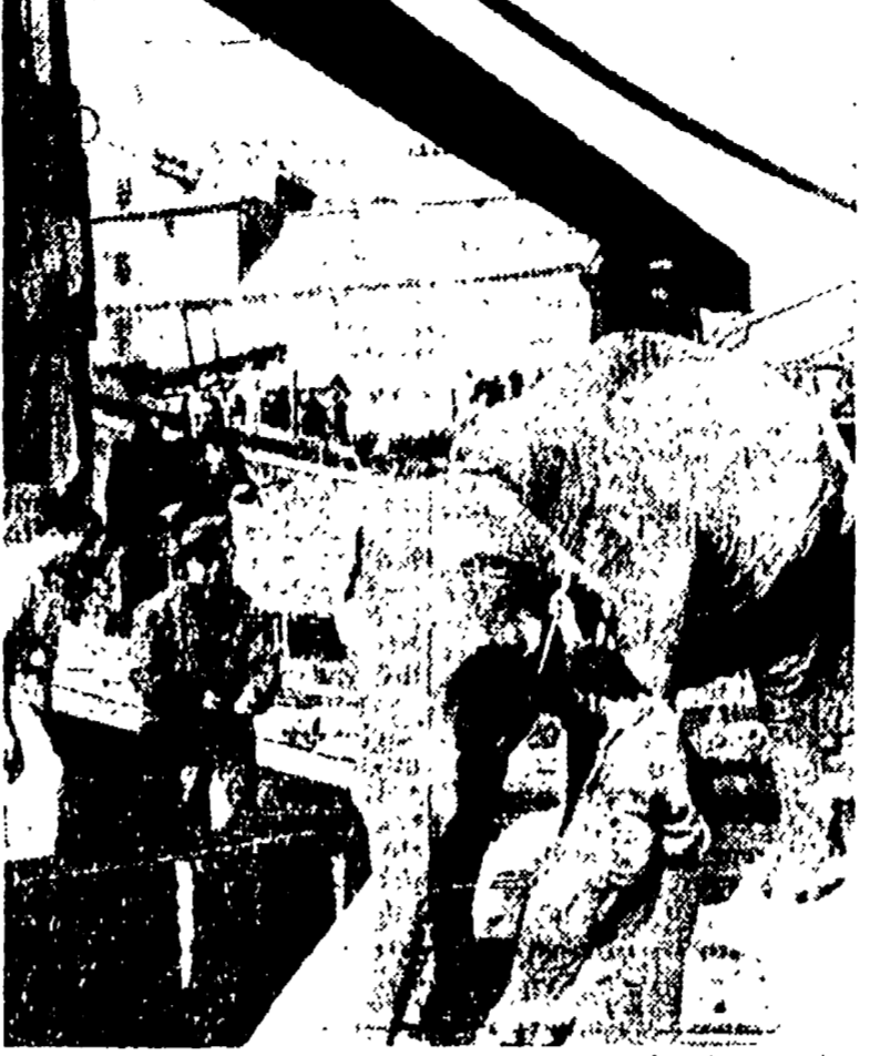
Ieri mattina la troupe del circo "Togni" si è imbarcata per la Sardegna dove l'attende una lunga serie di spettacoli. Negli appostamenti del circo è rimasto un pizzico di nostalgia, come quando al lontano sole persona cara e alla quale ci si sente legati.

PER LE VICENDE DEL FILM « PANE, AMORE E... »