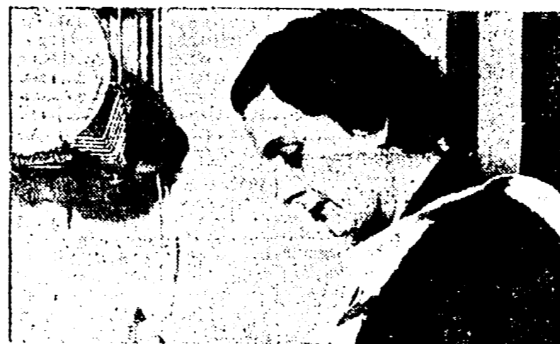
Luisa Balboni, sindaco di Ferrara, è amata ed apprezzata in tutta Italia. È una comunista a cui la fiducia popolare ha dato modo di provare tutte le sue capacità.

Un contributo grande dato dalle comuniste italiane è stato quello per la rinascita del Paese e la formazione di una coscienza civile e democratica. Esse hanno avvicinato tutte le donne con sincerità, con modestia, nelle strade, nei mercati, nei caseggiati per dire loro che non esistono barriere tra le madri di famiglia e che cosa si poteva fare per andare avanti. Aprite gli occhi sulla società che vi circonda, cercate la verità come noi la cerchiamo e soprattutto non rassegnatevi, lottate quando le cose non vanno. Così, i primi elementi per una ribellione giusta e costruttiva sono venuti a milioni di donne di ogni fede dalle donne comuniste, nel momento in cui ad esse si rivolgevano per unirsi tutte insieme e far sentire una voce più grande in difesa dei comuni interessi. Cominciando magari dalle piccole vicende d'un quartiere, dove un'aula scolastica è insufficiente, una fontanella non dà più acqua, un ambulatorio non ha ancora aperto i suoi battenti.