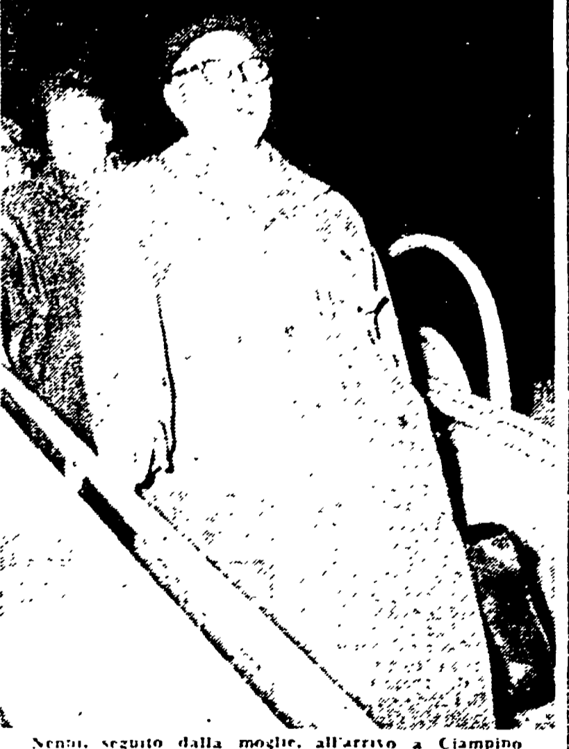
Nenni, seguito dalla moglie, all'arrivo a Ciampino

Il compagno Pietro Nenni, rientrato a Roma poco dopo la mezzanotte, ha illustrato i risultati del suo viaggio in Cina e in URSS. Nenni ha parlato di un viaggio molto fruttuoso, che ha permesso di stabilire contatti con i dirigenti del PCC e del Pcus.