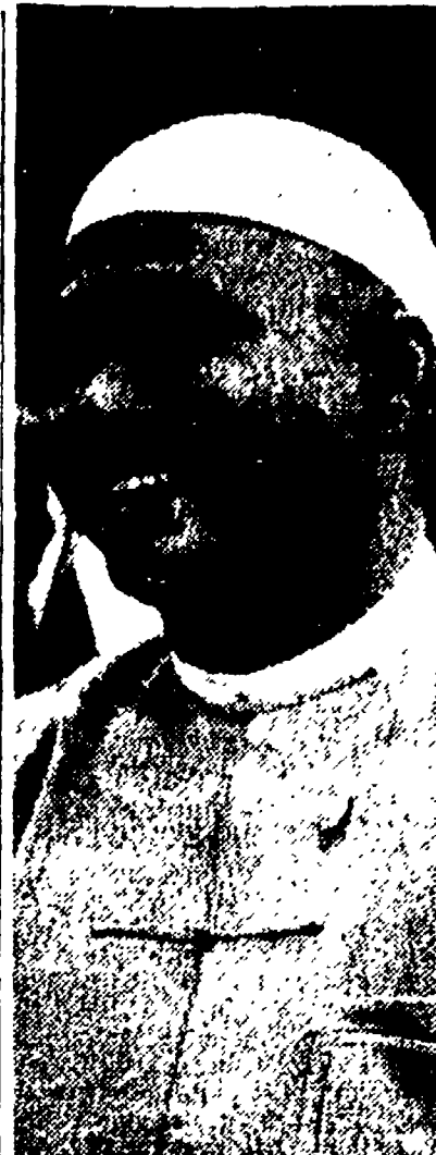
MOSCA - Il primo ministro birmano U Nu è giunto oggi a Mosca...