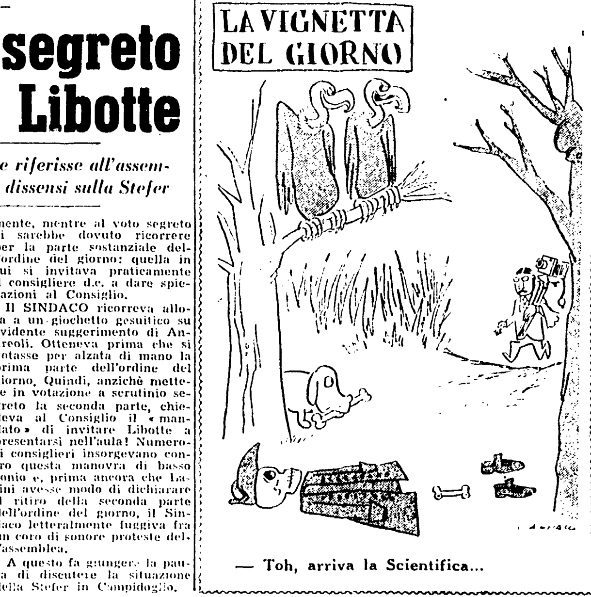
— Toh, arriva la Scientifica...

Ridotto in gravi condizioni dalle cornate di un loro