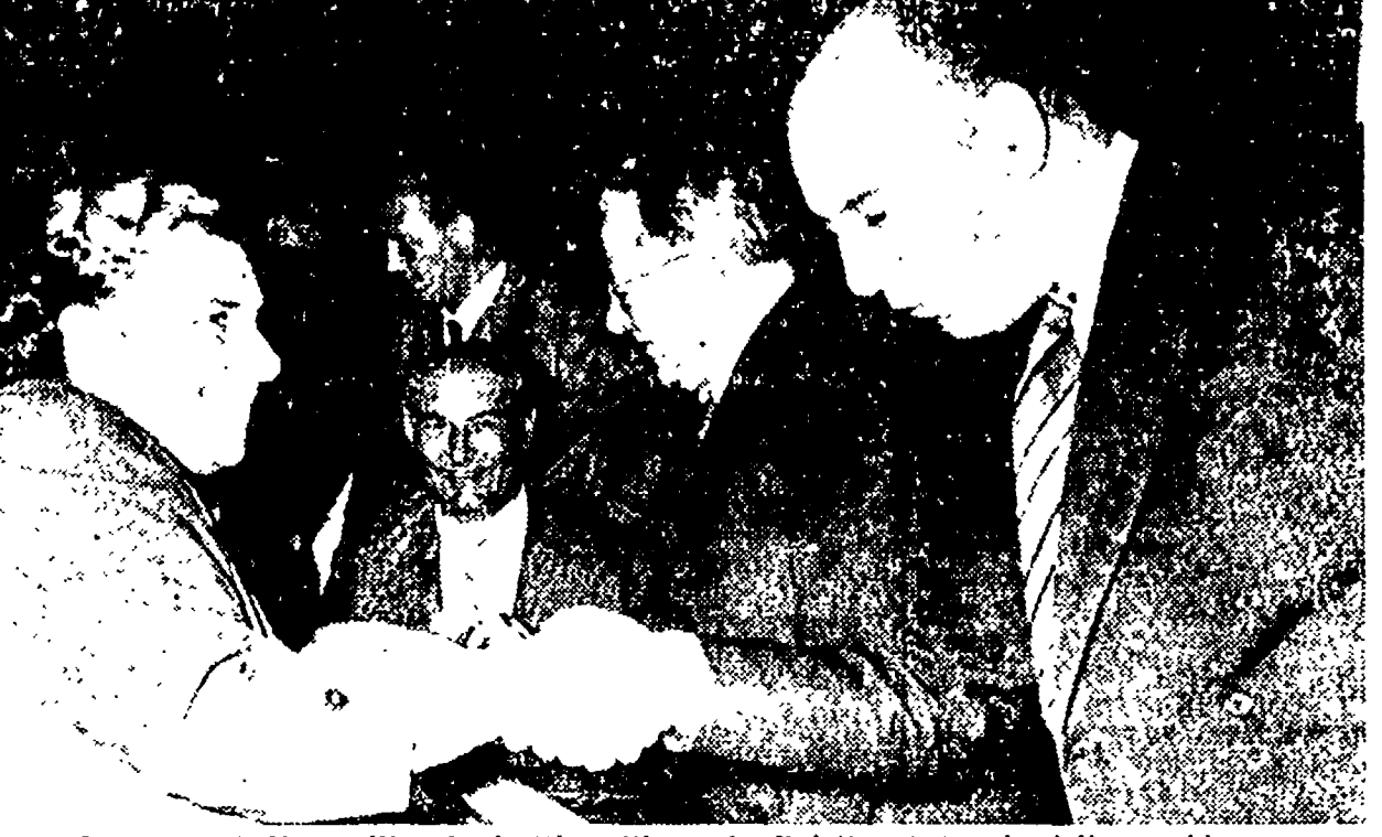
I compagni Negarville, Togniati e Giancarlo Pajetta al tavolo della presidenza

Il Senato ha approvato ieri a maggioranza il bilancio del lavoro pubblico. Dopo un'ora di dibattito, il ministro Romita dal quale è apparso in modo lampante l'assoluta incapacità a realizzare un vero piano di opere pubbliche che risolvano in modo concreto i gravi problemi che travagliano in questo settore la vita nazionale. La povertà del discorso di Romita, inoltre, ha assunto un aspetto particolarmente deplorabile quando, nel corso del dibattito, oltre trenta oratori di tutti i settori di palazzo Madama avevano messo in luce, le infinite deficienze esistenti sia nelle opere pubbliche, che in quelle centrali e settentrionali.