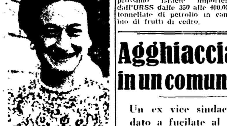
La duchessa di Windsor