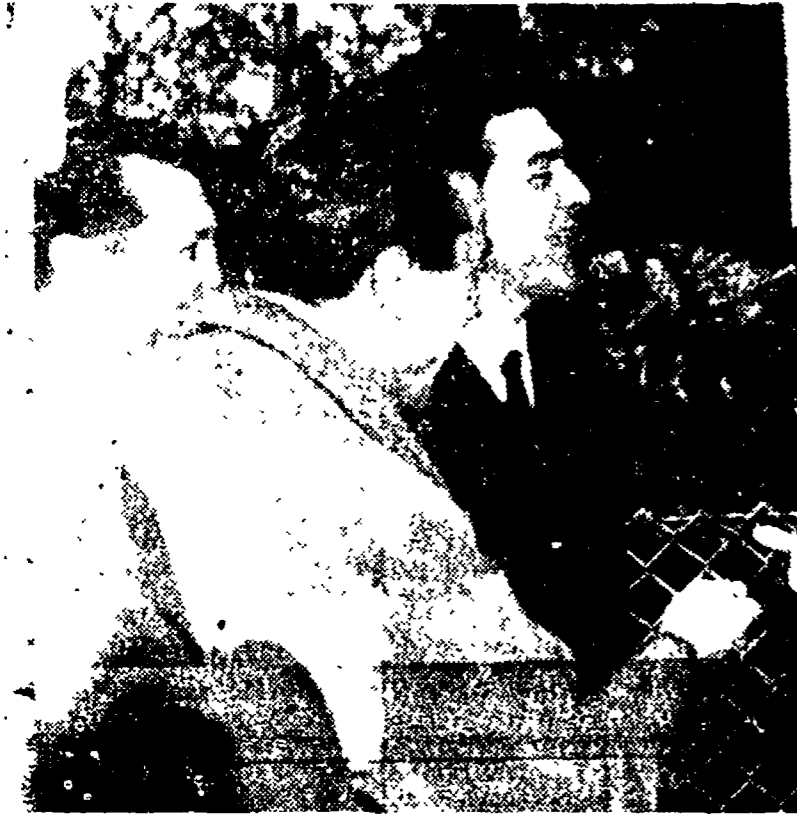
GINEVRA — L'ambasciatore Bova Scoppa, osservatore italiano alla Conferenza, discute con i giornalisti al termine del suo colloquio con Molotov

CATANIA, 3. — A leggere il programma ufficiale della visita del Presidente della Repubblica in Sicilia, così come era stato elaborato e distribuito ieri sera ai giornalisti, c'era da temere che ben poco margine restasse fra ricevimenti, banchette di gala ed omaggi delle autorità locali, per una parte di contatto semplice e umana con la massa popolare. La folla, però, ha non solo sfidato i cordoni di polizia, ma ha sfidato anche i cordoni e si è portata fino sotto la vettura del Capo dello Stato lanciando ovvia alla Repubblica, all'Italia, alla Costituzione.