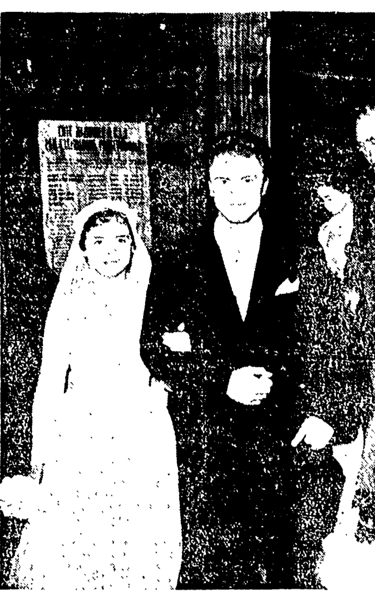
A Roma, Vittorio De Sica ha iniziato le riprese del suo nuovo film "Il Tetto", da un soggetto di Cesare Zavattini...