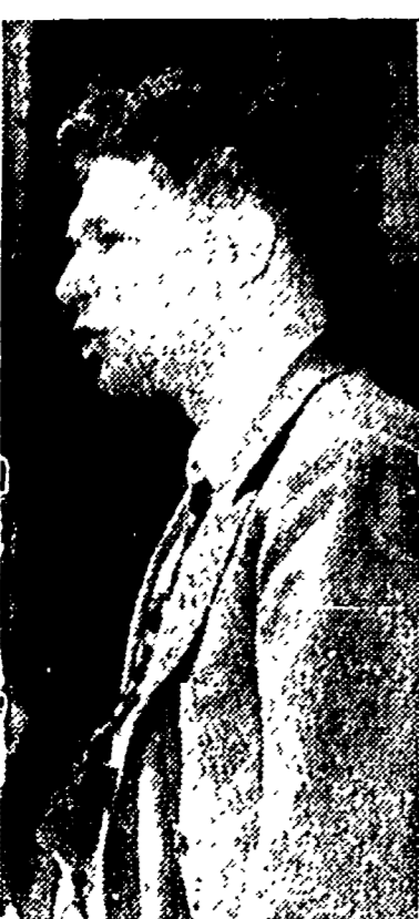
Il compagno Lama