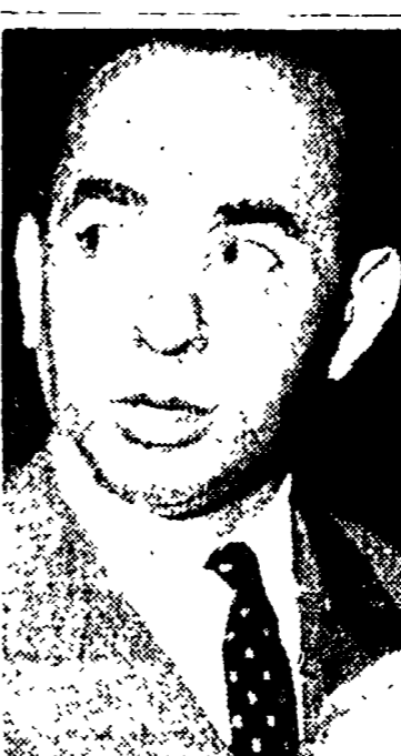
Il compagno Lama