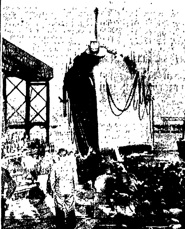
GDANSK (Polonia) — La motonave «Marceli Nowotko», di 10.700 tonnellate, varata nel porto di Gdansk, è la prima nave di questo tonnellaggio costruita interamente in cantieri polacchi. Nella foto: il varo

UNA CONFERENZA STAMPA A PRAGA DEL MINISTRO DVORAK