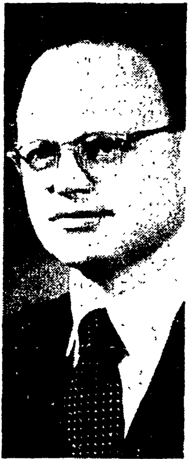
Il ministro Dvorak

Un discorso, si comprende facilmente, specialmente tra i lavoratori (tanto quelli che militano in organizzazioni sindacali, quanto il 75 per cento degli operai americani che sono ancora fuori dell'organizzazione), che qualcosa di nuovo, destinato ad avere immense ripercussioni sulla vita quotidiana, sta per nascere.