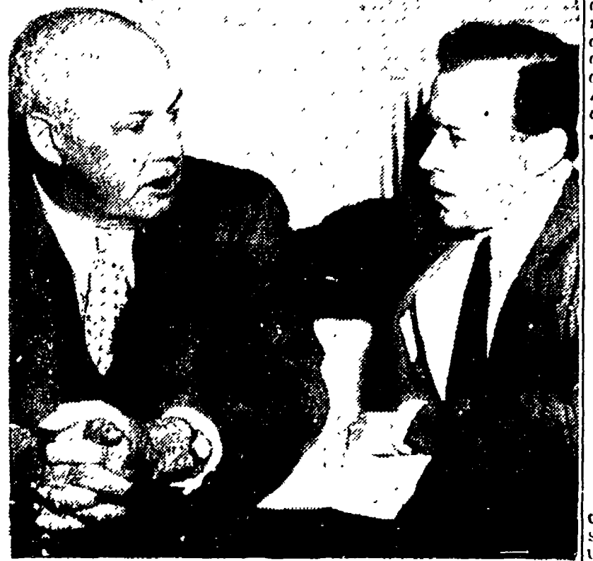
NEW YORK — George Meany (a sinistra) presidente dell'AFL e futuro presidente della nuova Confederazione sindacale unificata, insieme a Walter Reuther, presidente del CIO