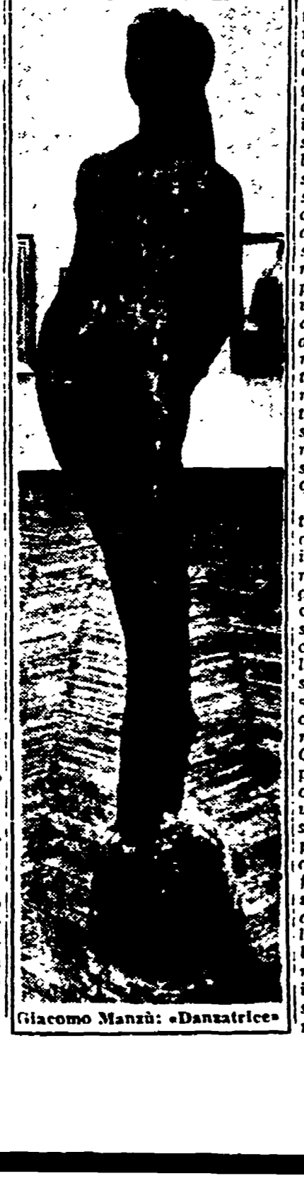
Giacomo Manzù: «Danatrice»