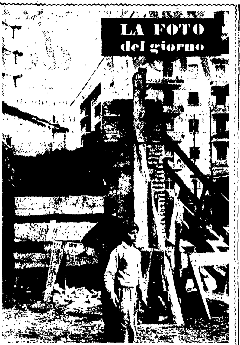
LA FOTO del giorno