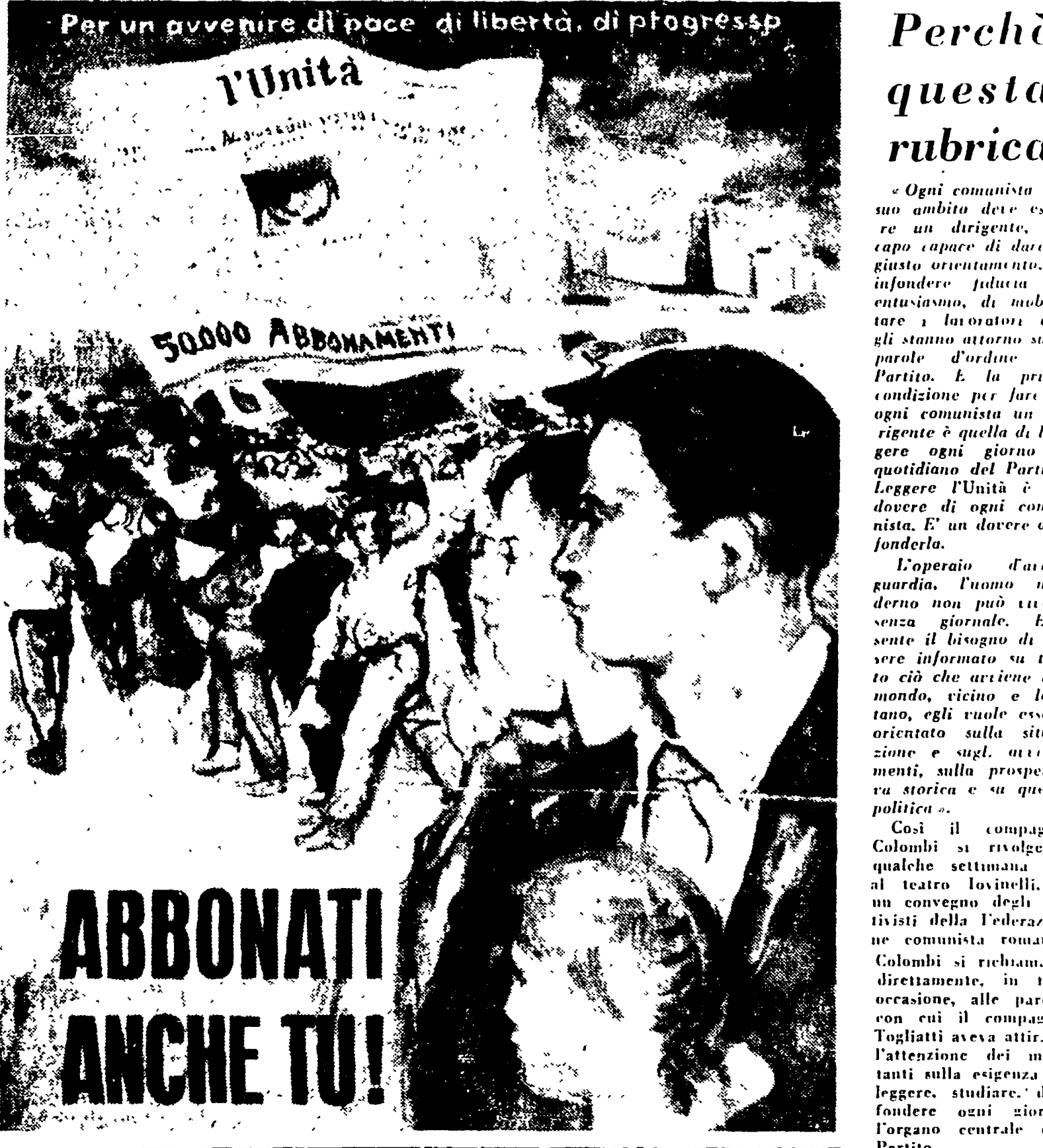
Per un avvenire di pace, di libertà, di progresso

Perché questa rubrica Ogni comunista nel suo ambito deve essere un dirigente, un capo capace di dare il giusto orientamento, di infondere fiducia e di entusiasmare, di mobilitare i lavoratori che gli stanno attorno sulle parole « ordine di Partito ». È la prima condizione per fare di ogni comunista un dirigente è quella di leggere ogni giorno il quotidiano del Partito. Leggere l'Unità è un dovere di ogni comunista. È un dovere del- l'operaio, dell'operaio d'azienda, del comunista, del comunista.