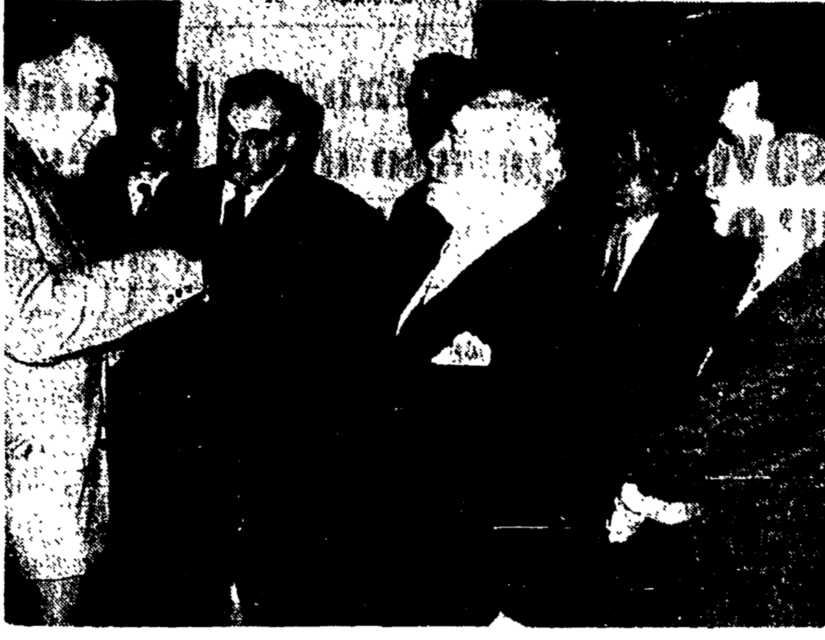
La delegazione comprende la commissione interna della Lingotto e i dirigenti locali e nazionali della FIOM e delle altre correnti sindacali si è incontrata con il ministro del Lavoro che ha dichiarato aperte le trattative sul licenziamento alla FIAT.