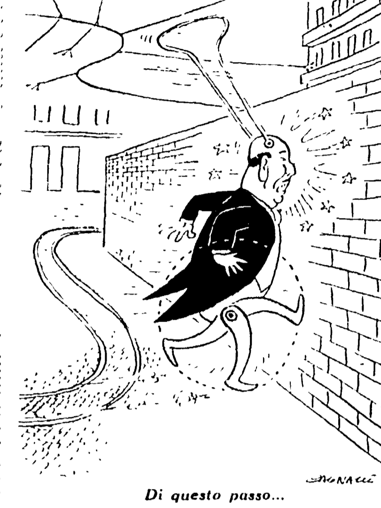
Di questo passo...