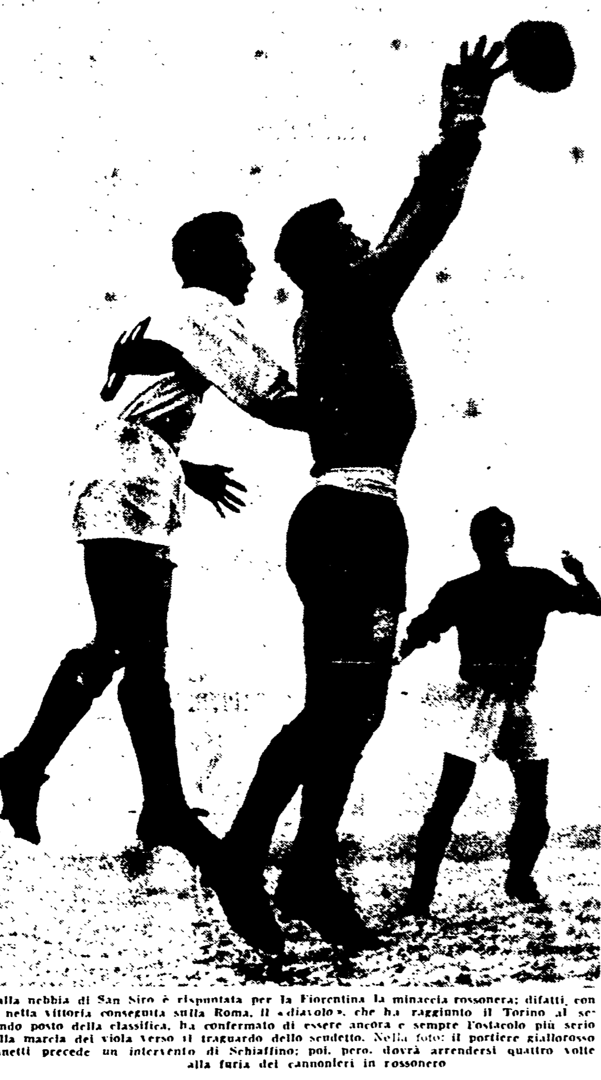
Dalla nebbia di San Siro è risparata per la Fiorentina la minaccia rossoneria: difatti, con la netta vittoria conseguita sulla Roma, il «diavolo», che ha raggiunto il Torino al secondo posto della classifica, ha confermato di essere ancora e sempre l'ostacolo più serio sulla marcia del viola verso il traguardo dello scudetto.