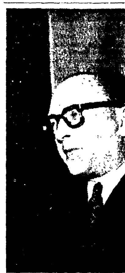
Guy Mollet, segretario generale della SFIO

PARIGI, 9. - Il segretario generale del partito socialdemocratico francese, Guy Mollet, ha rilasciato a Combat una serie di dichiarazioni di notevole interesse politico e abbastanza illuminanti per quel che concerne il futuro di un eventuale governo di fronte repubblicano.