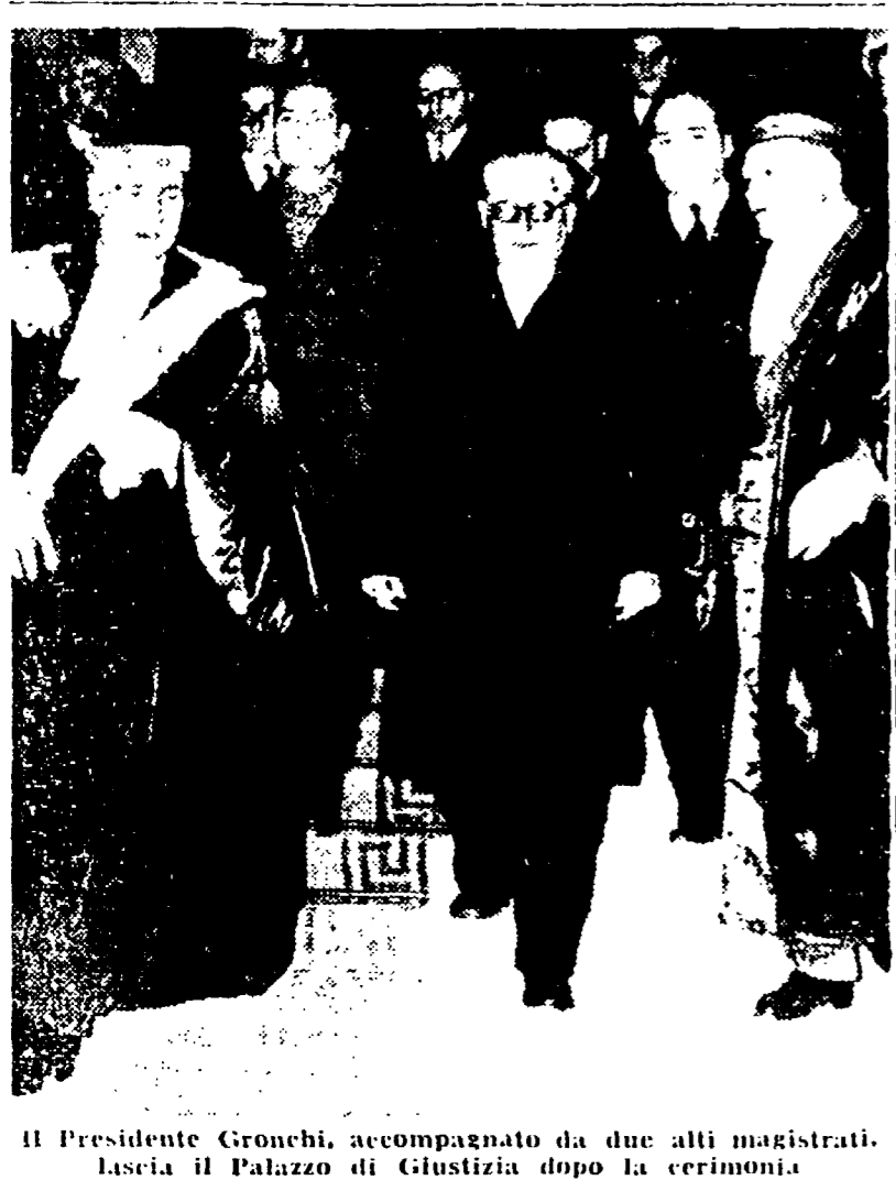
Il Presidente Gronchi, accompagnato da due altri magistrati, lascia il Palazzo di Giustizia dopo la cerimonia.

Ieri mattina, nell'aula magna della Corte di Cassazione, al Palazzo di Giustizia, si è svolta la solenne inaugurazione del nuovo anno giudiziario. Alla cerimonia hanno partecipato il Presidente della Repubblica, i Presidenti delle Camere, i Presidenti dei Consigli costituzionali, i giudici della Corte costituzionale, numerosi magistrati, autorità civili e militari.