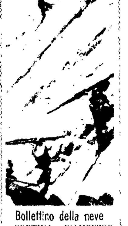
Boletino della neve. CORTINA D'AMPEZZO. È tornato a cadere dopo due giorni di bel tempo...