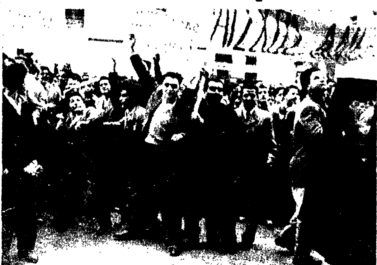
Il popolo greco non ha cessato, durante questi anni, di manifestare la sua opposizione alla politica di sberleffiata persecuzione da suoi governanti. Manifestazioni contro la dominazione dell'imperialismo americano, ieri come oggi, e sono state annunciate la formazione di una alleanza elettorale al centro e la sinistra per la consultazione che avrà luogo il 19 febbraio. Nella foto: manifestazioni di studenti ad Atene contro l'assoggettamento della Grecia all'America.