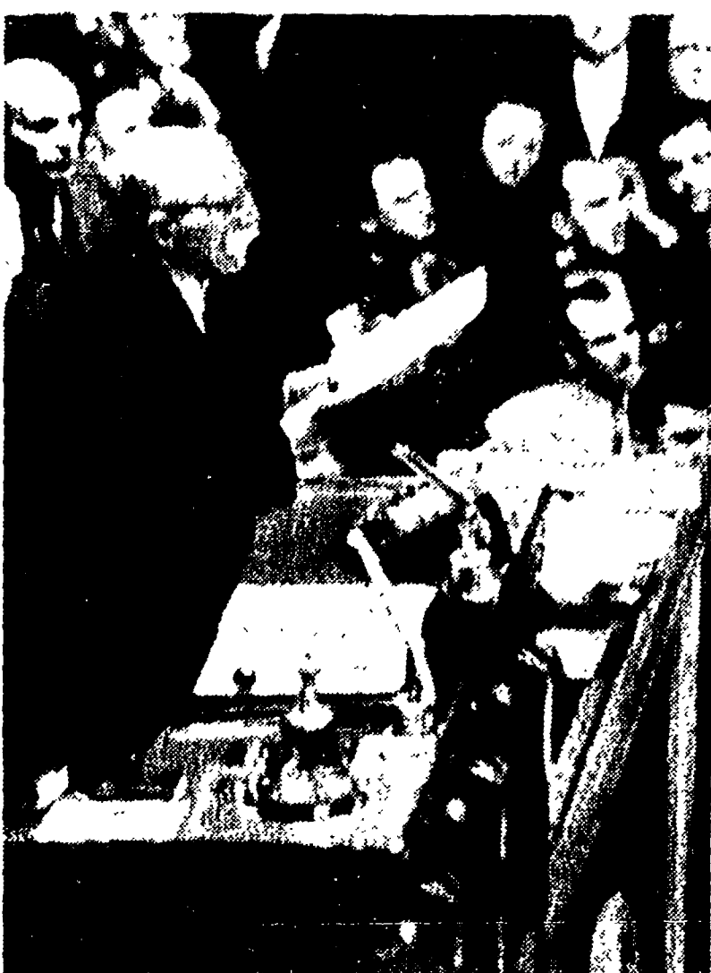
PARIGI — Il compagno Cachin apre i lavori dell'Assemblea nazionale francese.

PARIGI, 19. — Quando alle 15 e 16 minuti, un rullante ha annunciato « Monsieur le Président » e Marcel Cachin è salito alla tribuna presidenziale, il momento di Duchassaing era già colmo. Folla alle tribune del pubblico, resa in quelle destinate alla stampa, con in di-