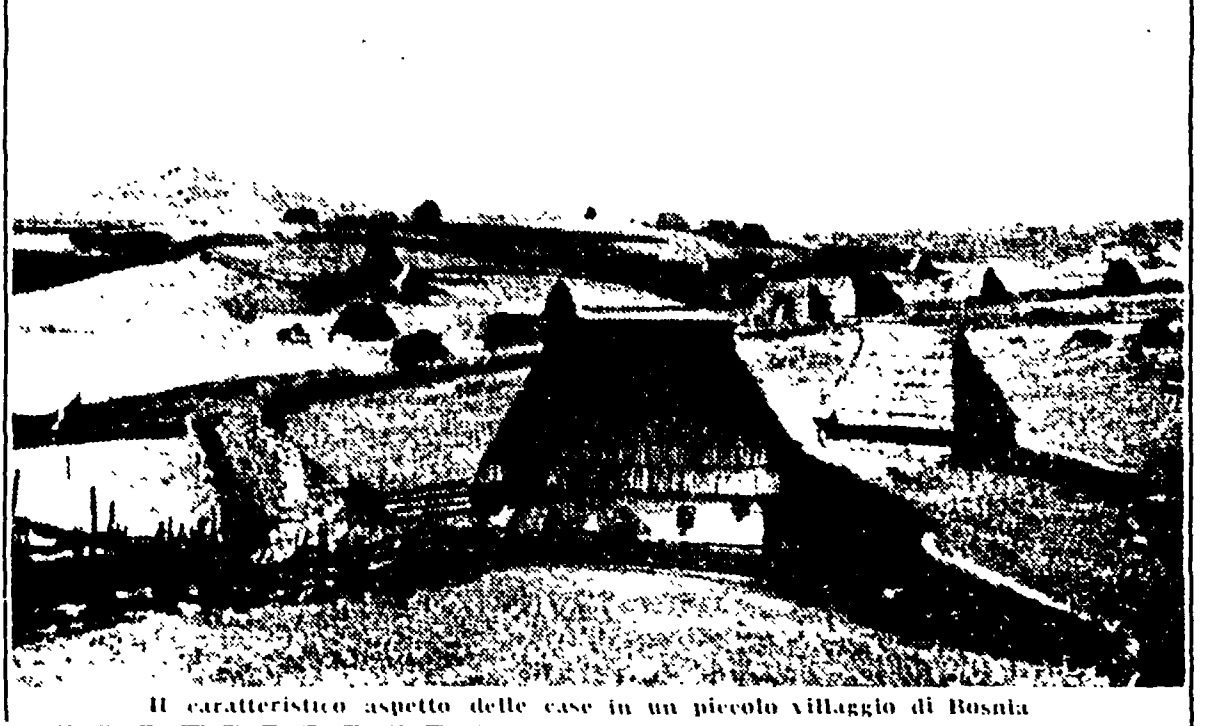
Il caratteristico aspetto delle case in un piccolo villaggio di Bosnia