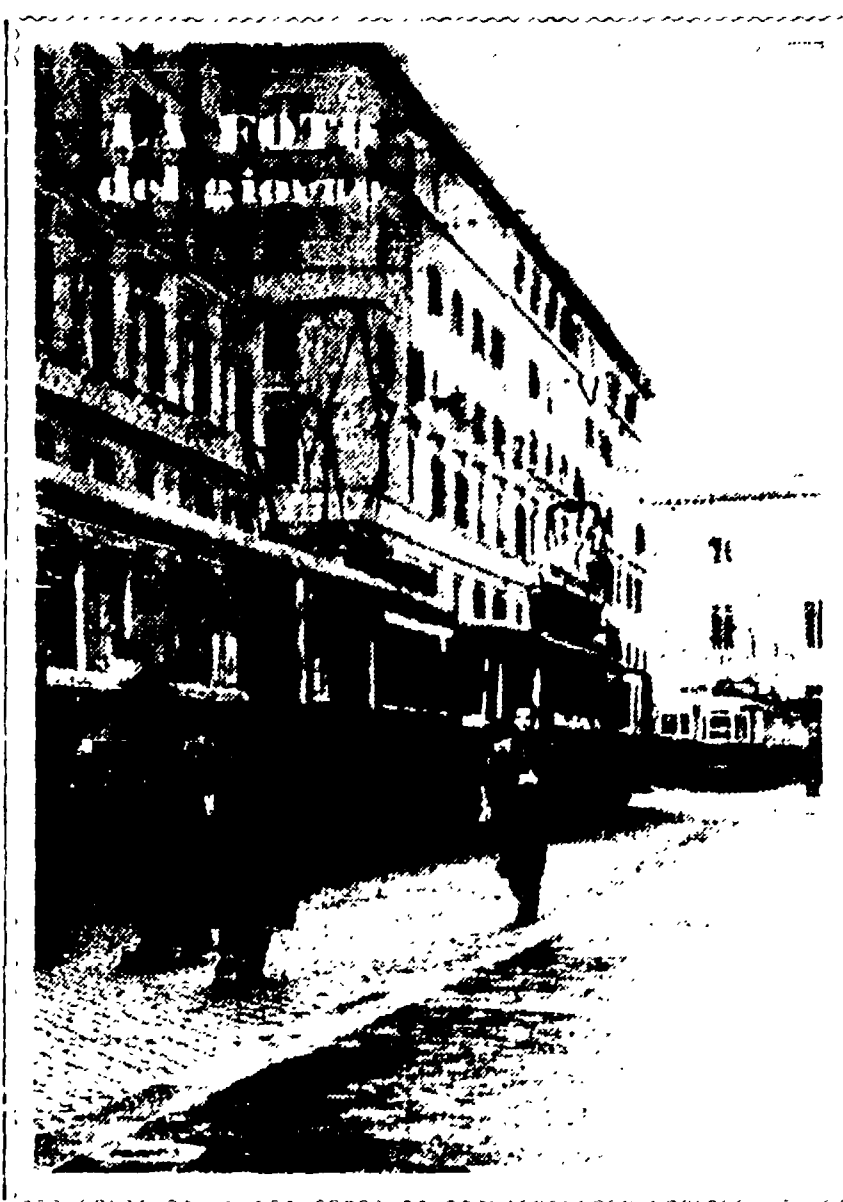
Sciopero alla Stefer. I lavoratori della Stefer hanno scioperato.

L'emulo di Rodolfo Valentino in Tribunale per diffamazione. Il giudice ha condannato il defunto a risarcire i danni causati dalla diffamazione. Il giudice ha condannato il defunto a risarcire i danni causati dalla diffamazione.