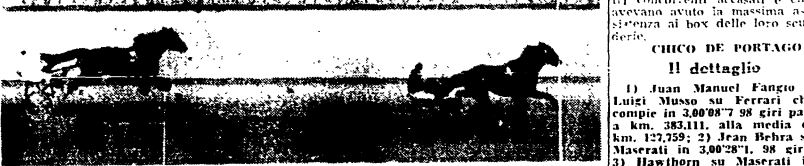
CELLINI batte senza forzare Caprioglio

Tutto come previsto a Villa Glori, nel Gran Premio degli Stretti, nella gara contro Cellini che ha pareggiato da un lato, difensore della prova indimenticabile, non mai essere disturbato da alcuno mentre Cellini si andava assai ritardando la piazza d'onore a causa di un banale incidente sull'ultima curva allorché egli era in lotta con Ricciardi e gli altri più freschi.