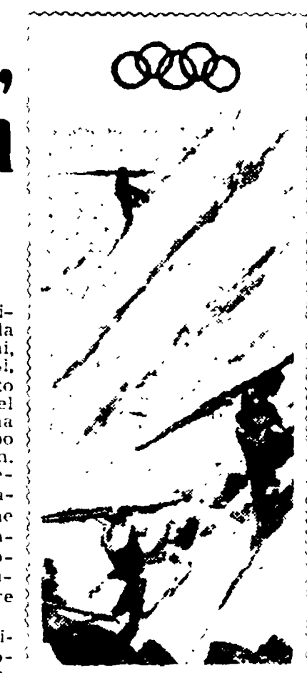
CORTINA. 22. — Annunziamenti di poco spessore che tendono ad aumentare. Venti deboli da ovest. Visibilità buona tende a peggiorare leggermente. Temperatura parte più bassa della vallata. Temperatura in temporaneo lieve aumento: minimo intorno - 3.

CORTINA D'AMPEZZO. 22. — I finlandesi hanno raggiunto le migliori misure nei