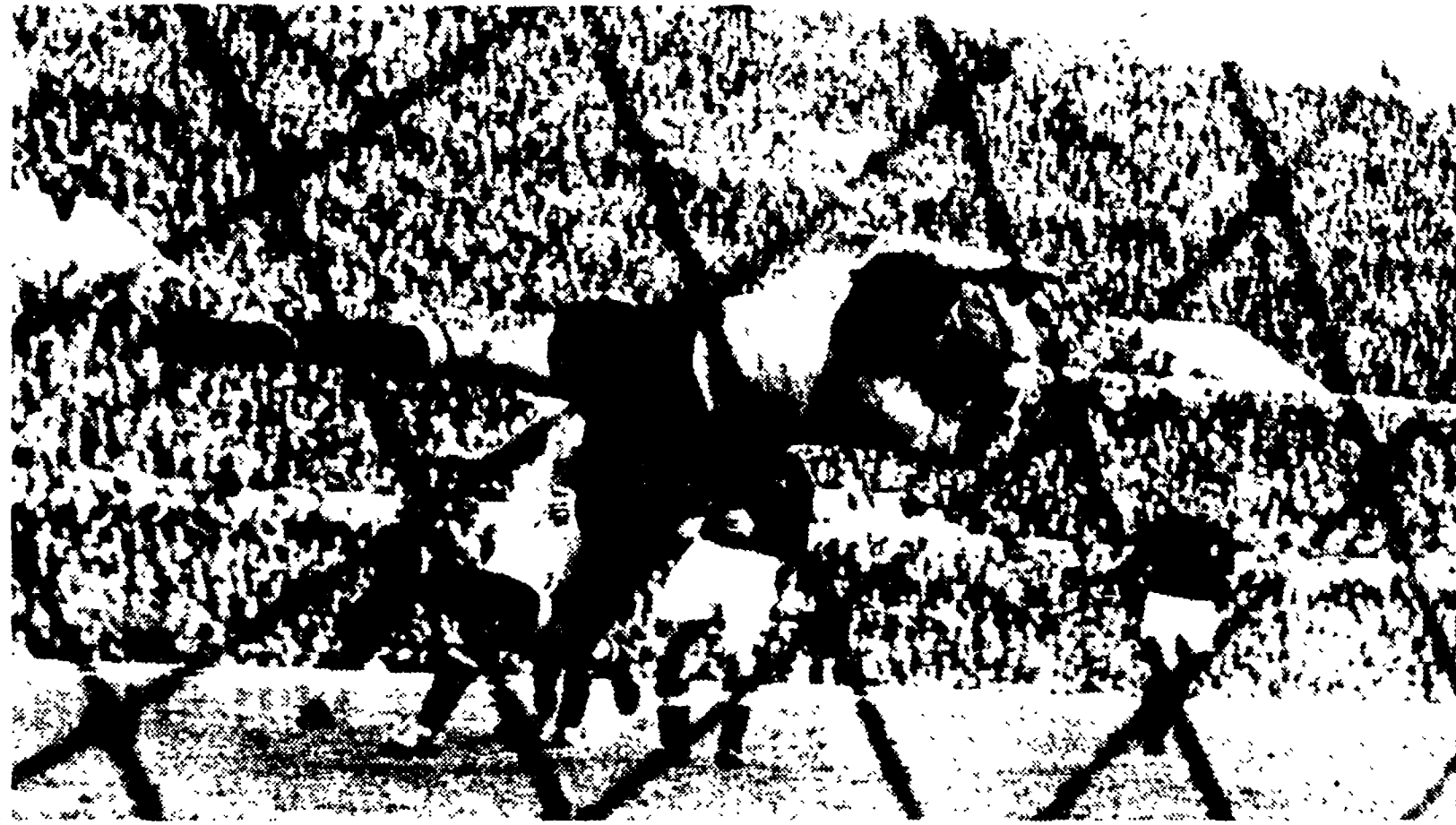
LAZIO-FIORENTINA 2-2: Aerobatica parata di Lovati al 33 della ripresa: il pareggio è salvo