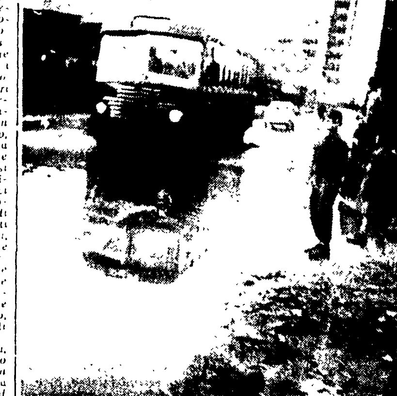
Un giovane degente nel sanatorio Ramazzini sarebbe l'autore della rapina alla mondana

L'arrivo dell'inverno, siamo a suo grado, dobbiamo questo nome con un'impetuosa e balzante a un'aria secca e un'umidità certo, i mesi due di Trieste e di Venezia, a un tempo, una sera di Bolzano. L'arrivo dell'inverno, siamo a suo grado, dobbiamo questo nome con un'impetuosa e balzante a un'aria secca e un'umidità certo, i mesi due di Trieste e di Venezia, a un tempo, una sera di Bolzano.