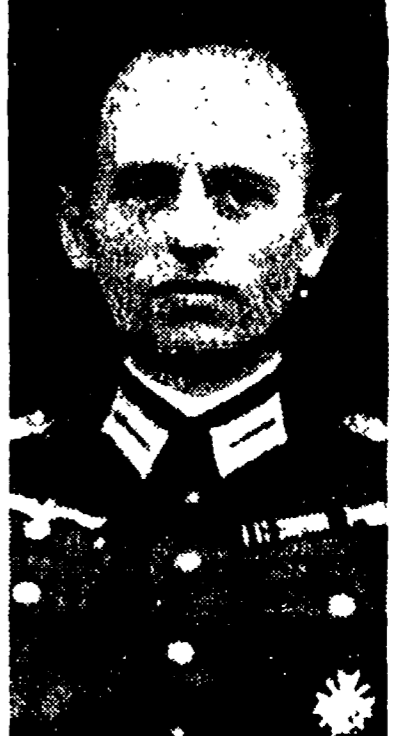
Il generale Gehlen, il nazista ora al servizio di Adenauer

Il generale Gehlen, il nazista ora al servizio di Adenauer, ha una lunga e misteriosa carriera di spia.