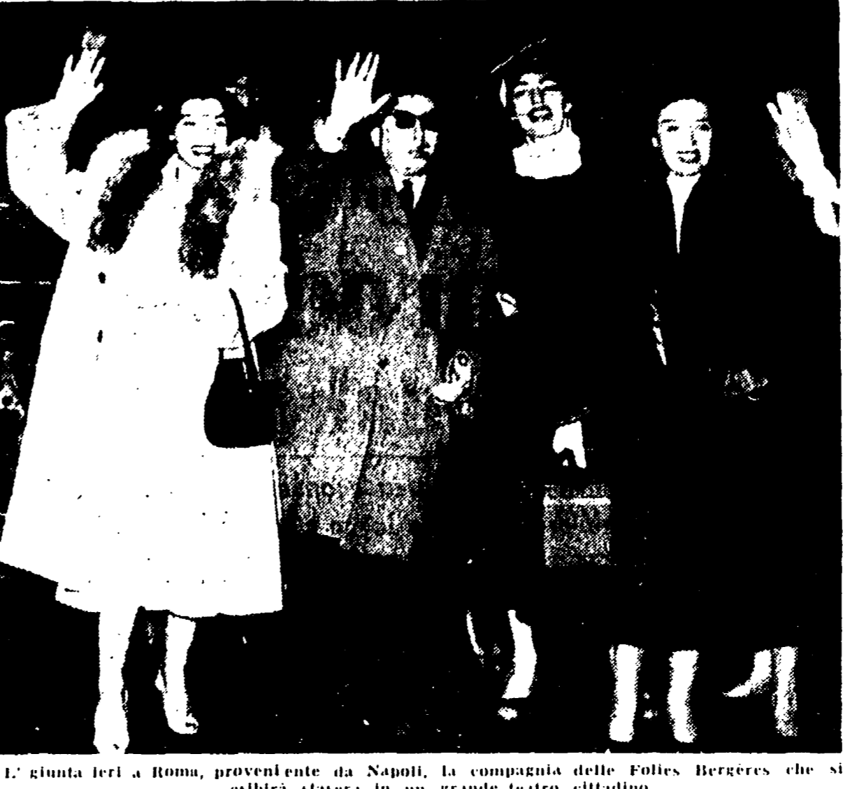
L'arrivo ieri a Roma, proveniente da Napoli, la compagnia delle Folies Bergères che esibirà stasera in un grande teatro cittadino