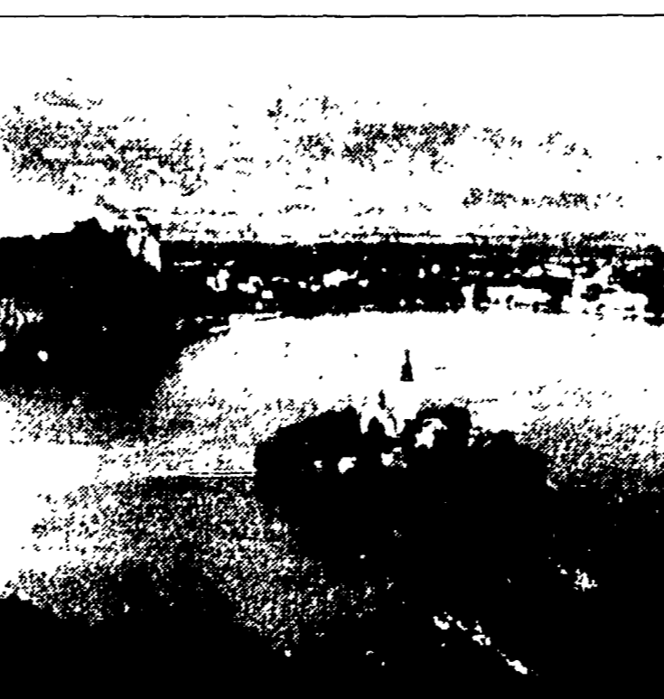
Una suggestiva visione panoramica di Rijeka, in Slovenia.

Civiltà di Spalato Una splendida città sulla riva del mare, con i suoi palazzi e i suoi giardini. È una città di cui si parla tanto in questi giorni. La Jugoslavia è un paese di cui si parla tanto in questi giorni. La Jugoslavia è un paese di cui si parla tanto in questi giorni.