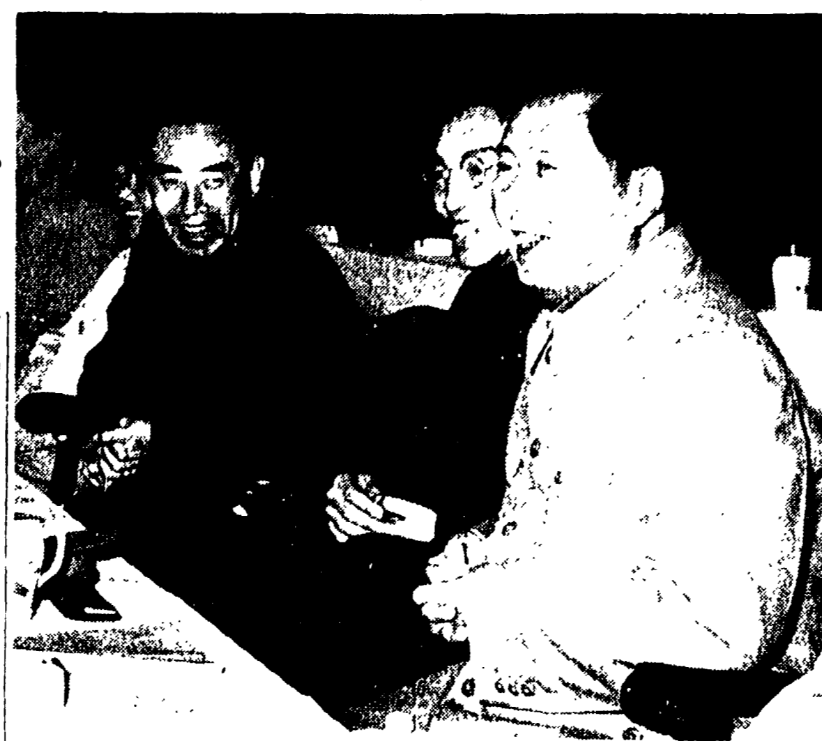
PECHINO -- Il presidente Mao Tse-tung e il primo ministro Chu En-lai alla riunione della Conferenza consultiva pubblica

Wilson ha dal momento di questo colloquio, rifiutato ogni tentativo di contatto con i funzionari del governo sovietico, ma ha espresso l'opinione che dell'invio, attraverso il parlamento, di una delegazione a Mosca, è una questione che si discuterà in occasione della prossima visita di Krusiov a Londra.