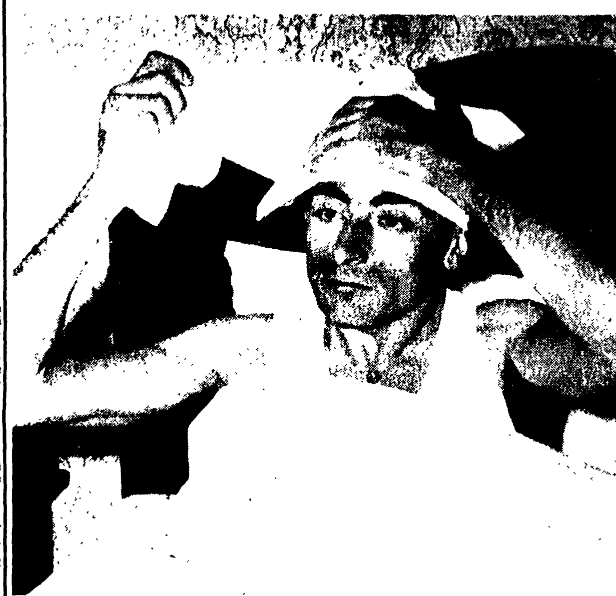
FAUSTO COPPI, colpito improvvisamente da una seria malattia e ricoverato in clinica, gli auguri di tutti gli sportivi

CONCLUSE SUL «LAGO MAGICO» LE GARE DI PATTINAGGIO VELOCE