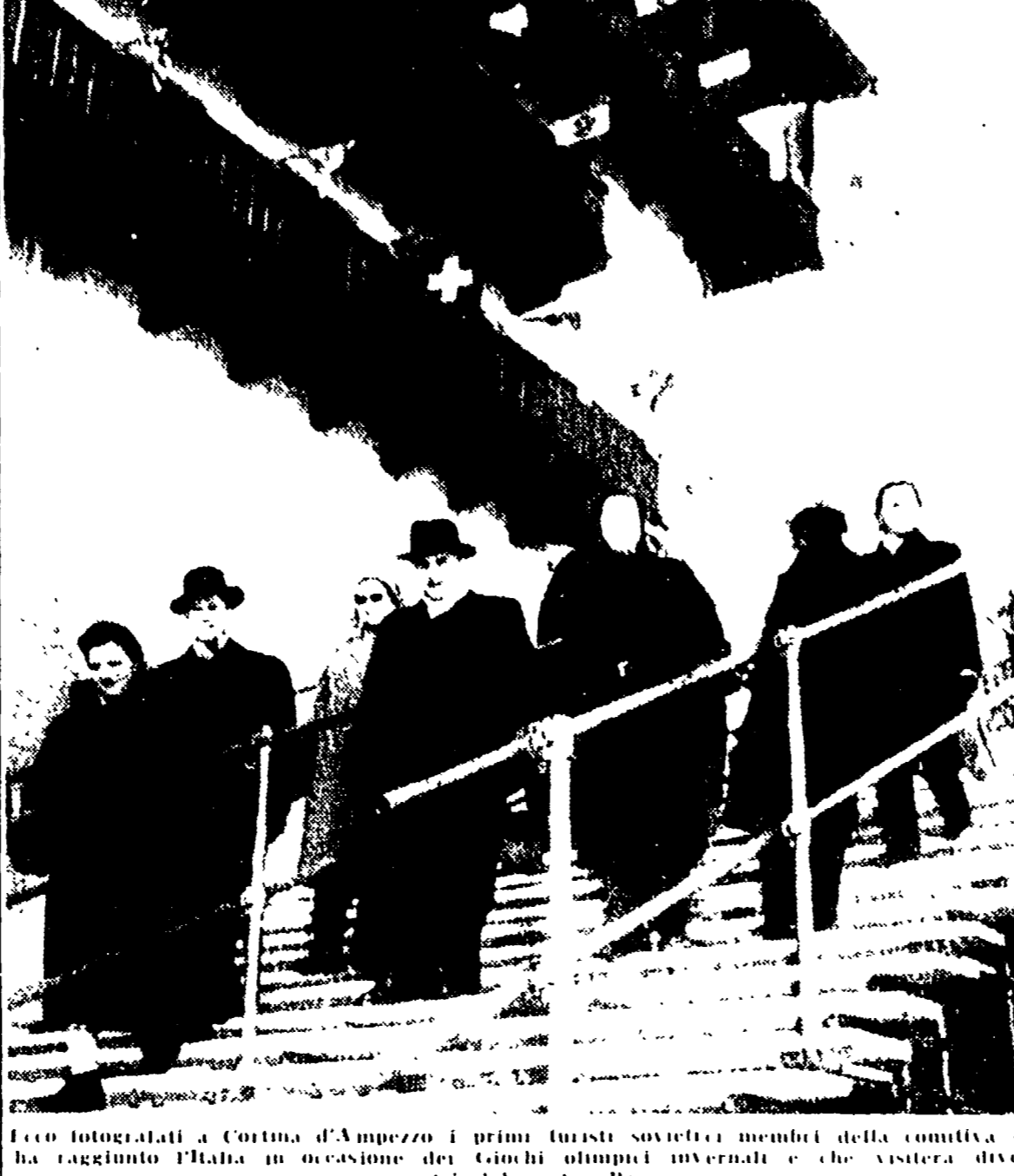
Turisti fotografati a Cortina d'Ampezzo. I primi turisti sovietici membri della comitiva che ha raggiunto l'Italia in occasione dei funerali internazionali e che visiterà diversi centri del nostro Paese.