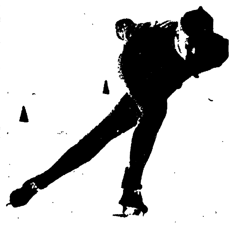
Un momento della gara di pattinaggio veloce sui 10.000 metri.