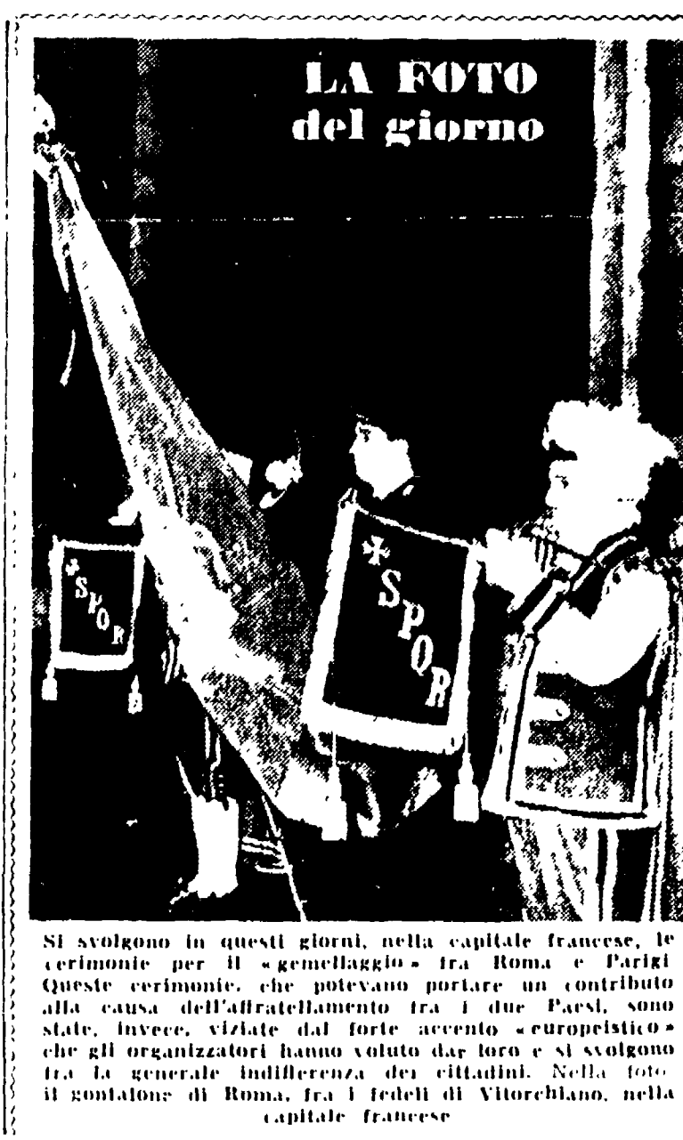
LA FOTO del giorno

Il Piano Regolatore non si fa e non si farà per molto tempo. Il Piano Regolatore non si fa e non si farà per molto tempo. Il Piano Regolatore non si fa e non si farà per molto tempo.