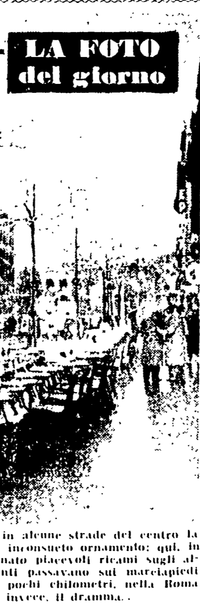
LA FOTO del giorno. LE DUE CITTA' — Solo in alcune strade del centro la neve ha rappresentato un inusitato ornamento. In via Veneto, essa ha disegnato piacevoli ricami sugli alberi, per la gioia di quanti passavano sui marciapiedi perfettamente sgombri. Nella Roma delle borgate, è invece, il dramma.