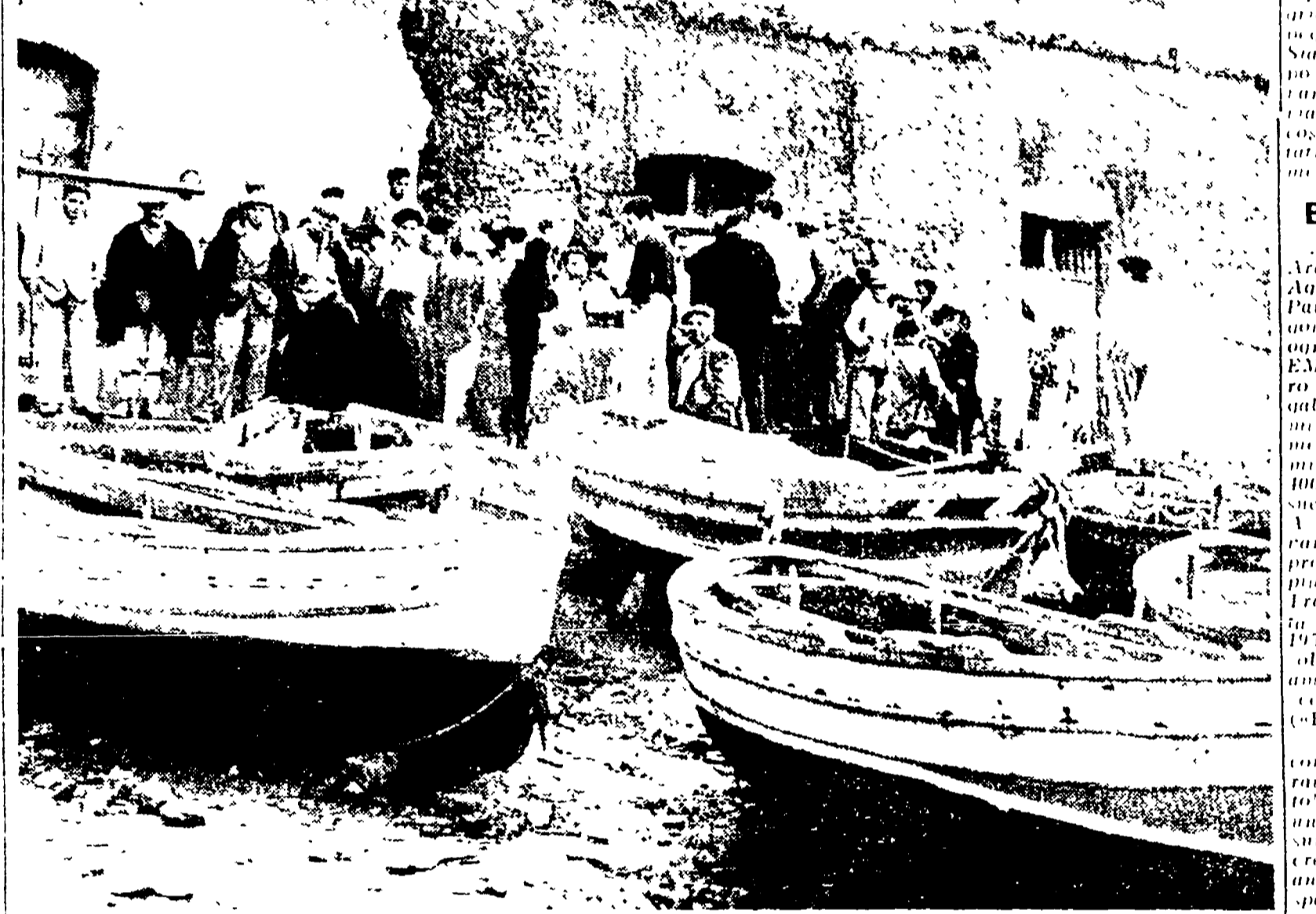
Pescatori di Trappeto: ad essi sono dedicate molte pagine del libro di Danilo Dolci «Bandiere a Partinico»

Non c'è solo Partinico. Anche noi, minatori di Aragona, di Sommatino, di Riesi, di Ravanusa, della Trabia Tallarita, gridiamo giustizia. Non c'è solo Partinico, anche noi gridiamo giustizia.