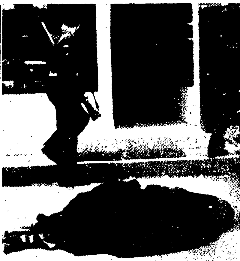
NICOSIA (Cipro) -- Uno dei due soldati della RAF uccisi dai partigiani nel corso di un'azione condotta in pieno centro di Nicosia nelle prime ore del pomeriggio di sabato scorso