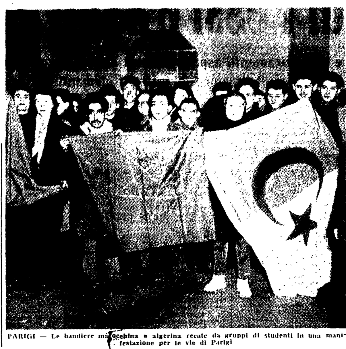
PARIGI - Le bandiere marocchina e algerina recate da gruppi di studenti in una manifestazione per le vie di Parigi