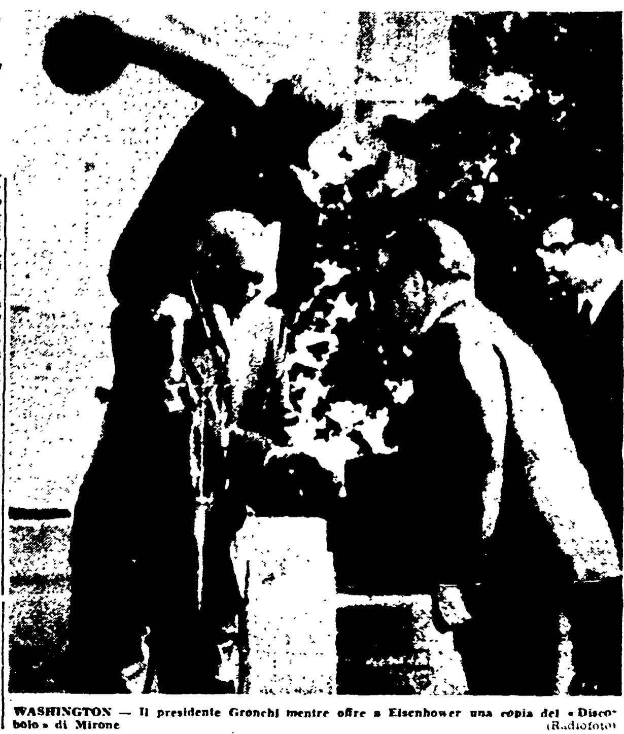
WASHINGTON — Il presidente Gronchi mentre offre a Eisenhower una copia del «Discorso» di Moro

Il programma prevedeva fino a qualche giorno fa, un incontro privato fra Eisenhower e Gronchi, un «tête à tête» al quale non avrebbe dovuto partecipare nessun altro eccettuato l'interprete. Invece il programma ha subito un mutamento che è, più che di forma, di sostanza: all'incontro hanno infatti partecipato Martino e Brosio da parte italiana e, da parte americana, il sottosegretario di Stato Hoover, l'ambasciatore Lucio e il sottosegretario di Stato ad interim per gli affari europei Brick. Questo fatto ha