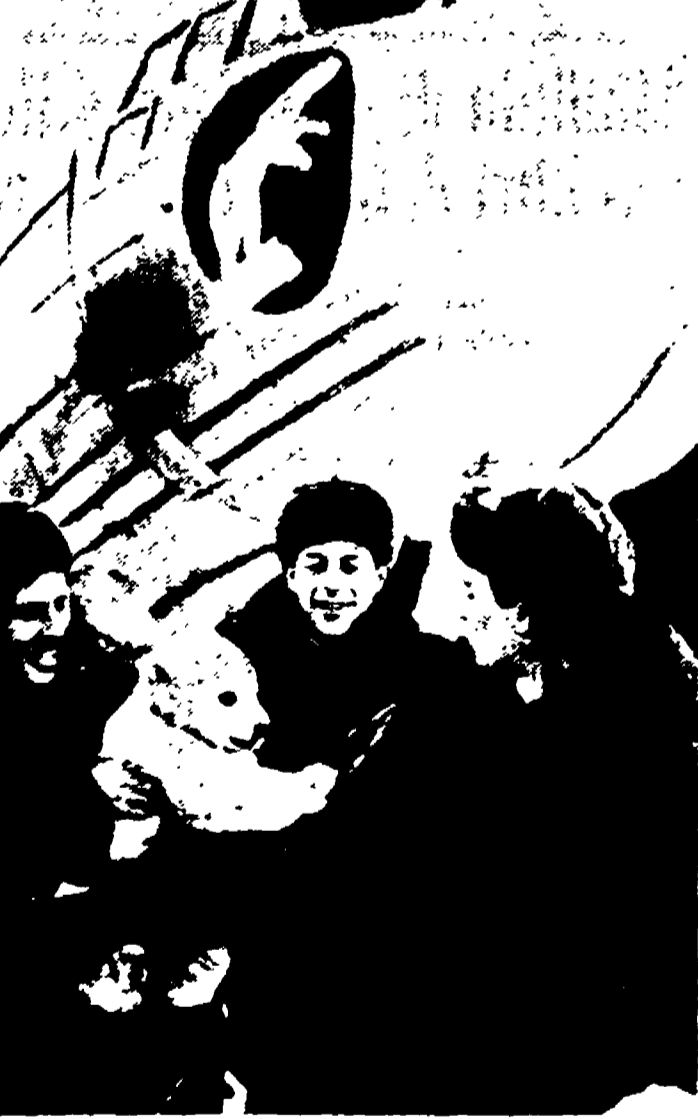
ARTICO — Membri di una spedizione polare scottese giocano con un grazioso orsacchiotto da loro catturato