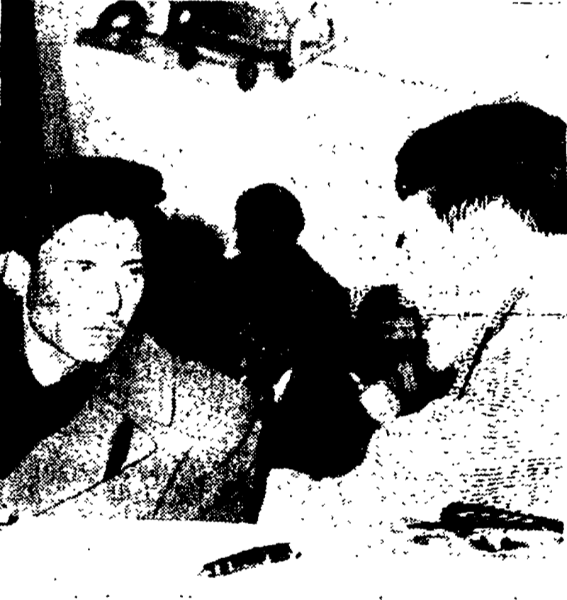
Il compagno Giuseppe Di Vittorio, segretario generale della C.G.I.L., parla con il figlio del bracciante Paolo Vitale, ucciso a Comiso

investimenti indirizzata unilateralmente verso la sola meccanizzazione; l'attacco padronale al collocamento democratico, agli imprenditori e alla giusta causa permanente; l'impiego del credito agrario con metodi discriminatori; l'opera della Cassa per la piccola pro-