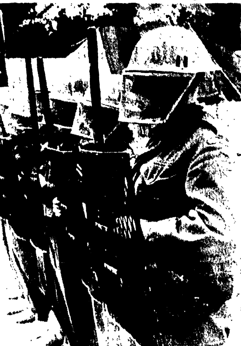
CIPRO — Soldati del primo battaglione britannico di Leicester, stanziato a Famagosta, si addestrano con i nuovi mezzi di cui sono stati dotati per fronteggiare i dimostranti durante le manifestazioni per l'unione dell'isola alla Grecia...