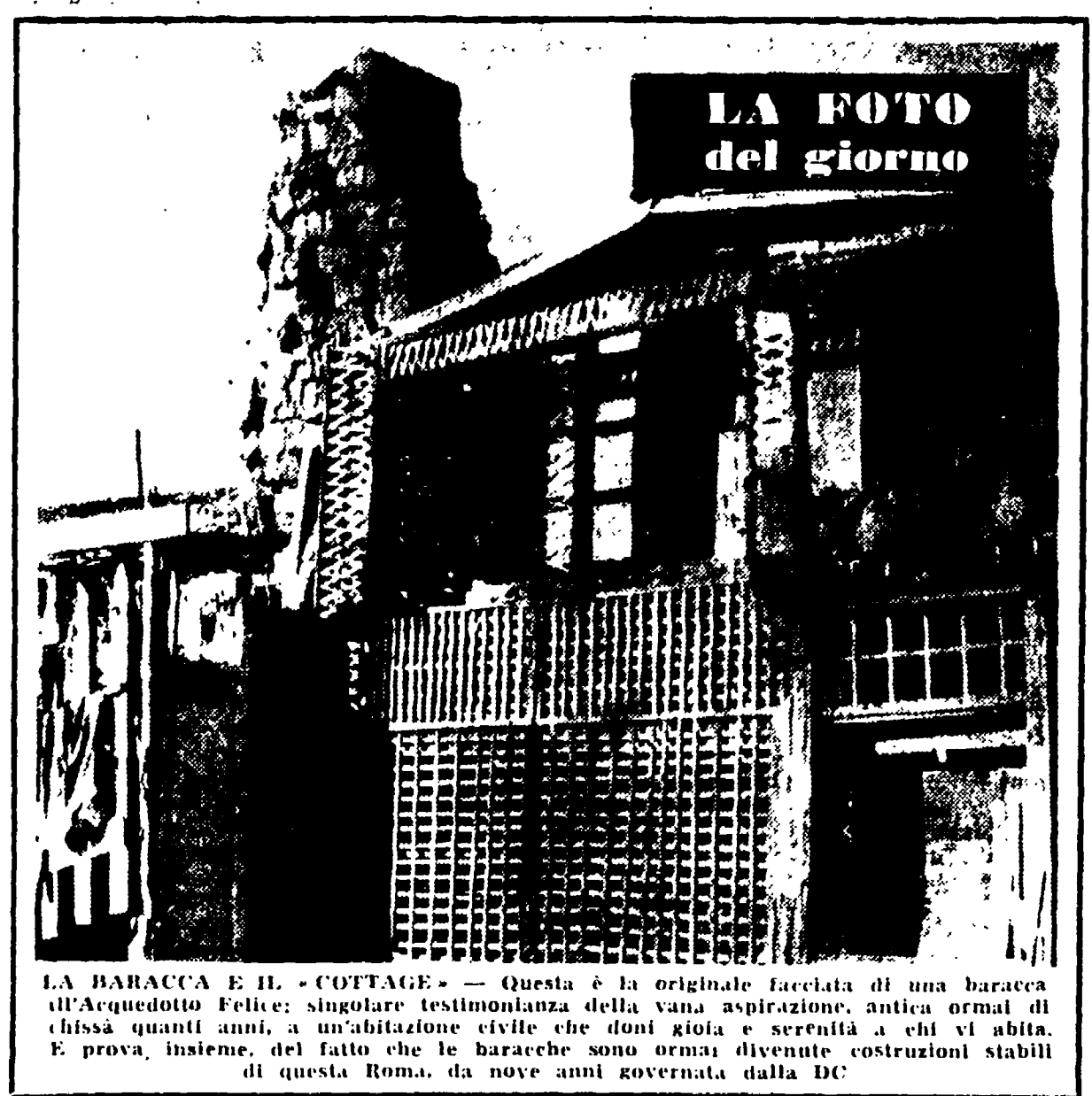
LA BARACCA E IL "COTTAGE" - Questa è la originale facciata di una baracca dell'Arquedotto Felice; singolare testimonianza della sua aspirazione, antica ormai di chissà quanti anni, a un'abitazione civile che doni gioia e serenità a chi vi abita. E prova, insieme, del fatto che le baracche sono ormai diventate costruzioni stabili di questa Roma, da nove anni governata dalla Dc.

Oggi verrà solennemente ricordato il dodicesimo anniversario dell'eccidio nazista delle Fosse Ardeatine. La memoria dei barbuti eroi, ancora fresca nel cuore dei romani e ancora tremida d'orrore, suscita il nome del luogo che fu teatro del trionfo di un'orgia di barbarie.