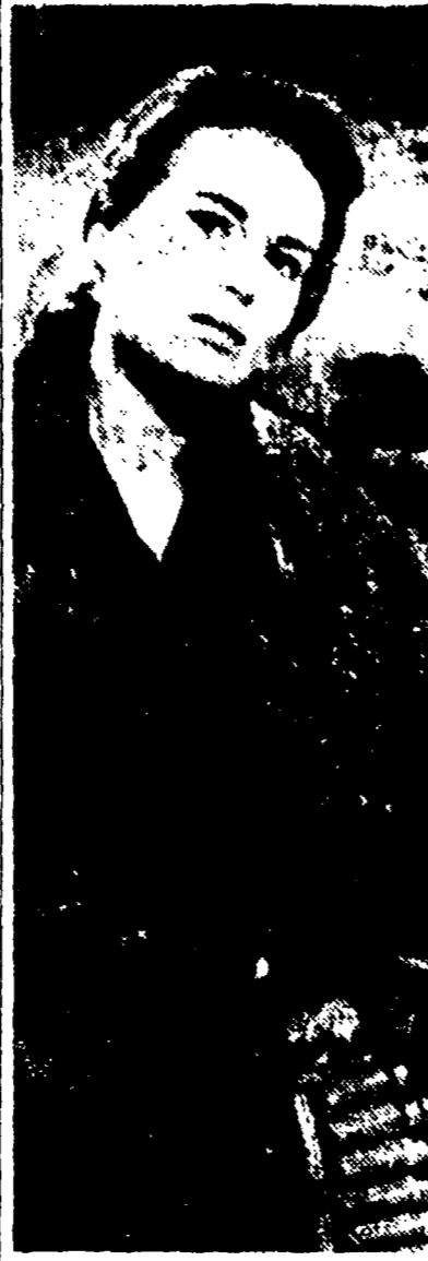
Silvana Mangano come appare nel nuovo film di Giuseppe De Santis "Omnia et in omnia secula".

Il gesto della Società americana di chimica era ancor più inaffabile se si pensa che da molti anni ormai non si può aprire un solo fascicolo del suo giornale senza trovarvi notizie di lavori utilissimi e radio-isotopi artificiali scoperti da Irene e Frédéric Joliot-Curie.