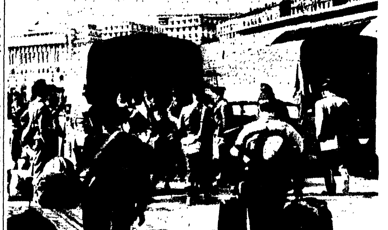
ALGERIA - Rinforzi di truppe coloniali francesi affluiscono ininterrottamente in Algeria per via aerea e marittima mentre si susseguono i combattimenti...