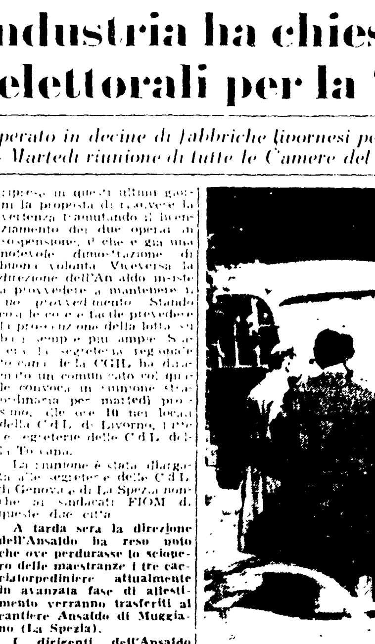
PALERMO: continua a Palermo la lotta degli autotrasportatori per l'indennità di extra-zona. Nella foto: pattuglie della polizia davanti a una raffica della SANI, durante lo sciopero giornaliero che si è svolto il 29