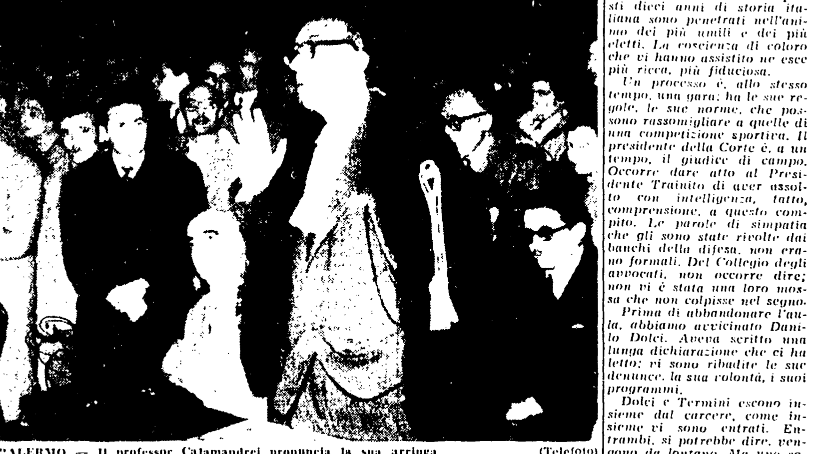
PALERMO - Il professor Calamandrei pronuncia la sua arringa

per il nostro Paese, la libertà e la dignità. Difendete noi vivi e difendete i morti che si sono sacrificati per la Costituzione. Difendete la legge dello Stato, che è la Carta della nostra speranza e della nostra dignità.