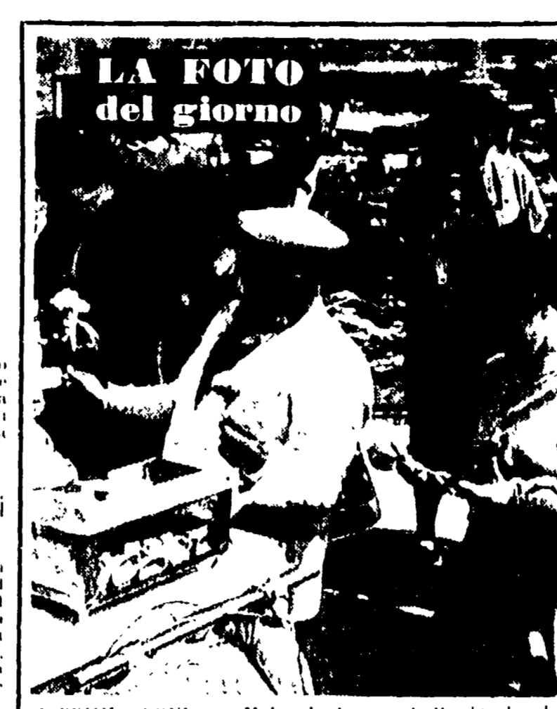
LA FOTO del giorno. I primi «coni» - Malgrado i rovesci di pioggia e di vento che hanno accompagnato la giornata, i primi «coni» di ghiaccio sono stati distribuiti al pubblico del giardino zoologico. Si tratta di una novità per i romani. I coni sono stati distribuiti al pubblico del giardino zoologico. Si tratta di una novità per i romani. I coni sono stati distribuiti al pubblico del giardino zoologico. Si tratta di una novità per i romani.