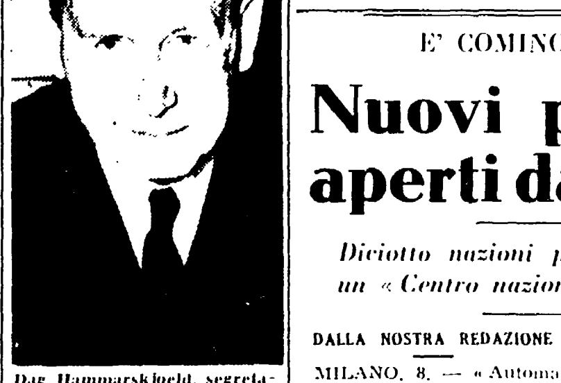
Dag Hammarskjöld, segretario generale dell'ONU.

La giunta di ieri all'albergo Excelsior, dove ha preso alloggio, esaminando e discutendo con i suoi collaboratori le ultime notizie dalla zona di Gaza.