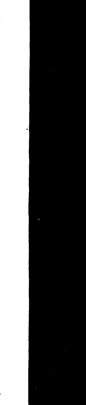
Una fotografia di una persona, probabilmente legata all'evento sportivo o elettorale menzionato.

Il Fronte popolare unitario ha ottenuto un grande successo. Il Pci ha parlato del ruolo del Pci nella lotta per la conquista di una maggioranza democratica di sinistra.