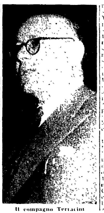
Il compagno Terracini

coloro che nel paese sentono la necessità di profonde trasformazioni sociali, la via italiana del socialismo, una via per la quale i socialisti ed i democratici italiani hanno già cominciato a muoversi attraverso le fucine della Resistenza, della Repubblica e della Costituzione, è una via per la quale possono procedere insieme i partiti democratici e socialisti. La democrazia italiana articolata in partiti che rispondono a interessi di gruppi sociali di produttori e di lavoratori alle particolari tradizioni storiche, può avanzare a condizione di impedire le interferenze straniere nella vita politica del paese, di rifiutare con vigore l'intervento delle forze del privilegio, della reazione corrottrice e ricattatrice del monopolio e degli stranieri.