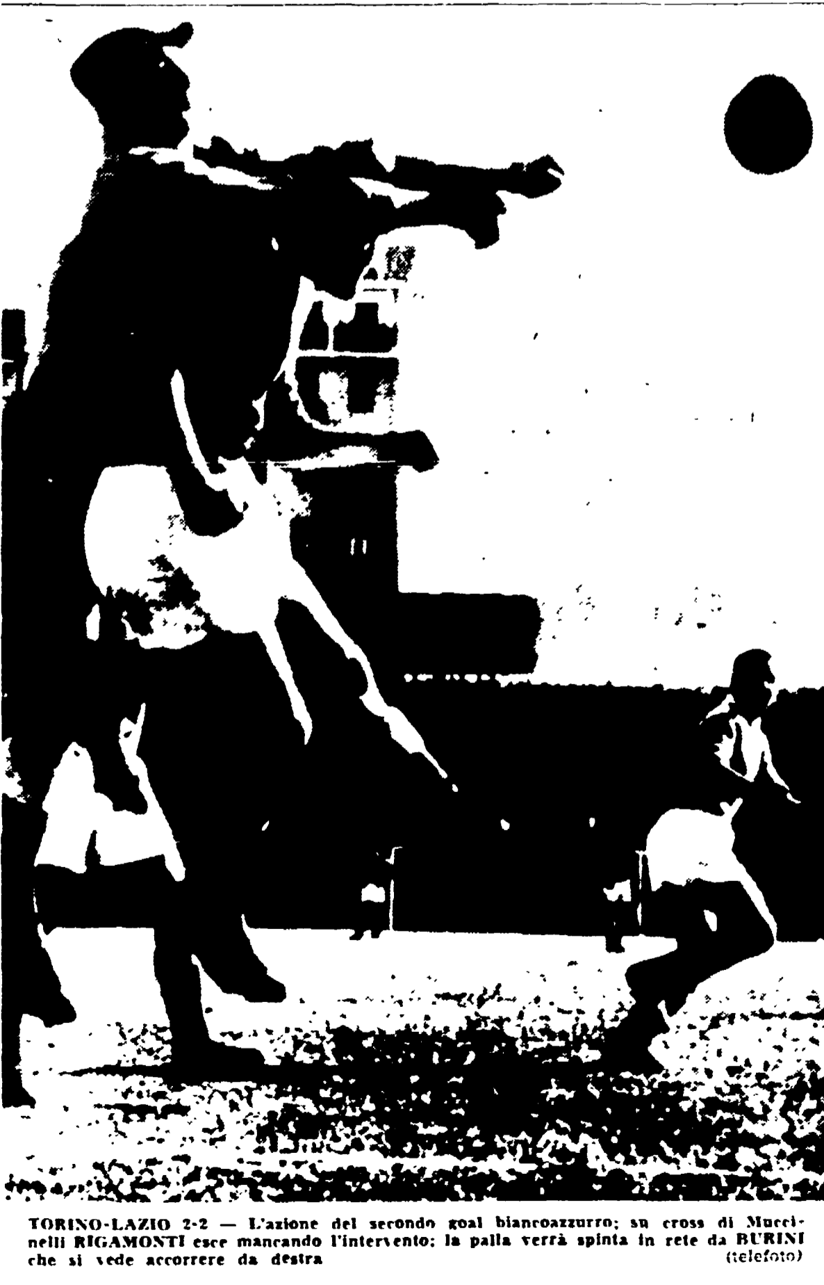
TORINO-LAZIO 2-2 - L'azione del secondo goal biancoazzurro; su cross di Mucelli RIGAMONTI esce mancando l'intervento; la palla verrà spinta in rete da BURINI