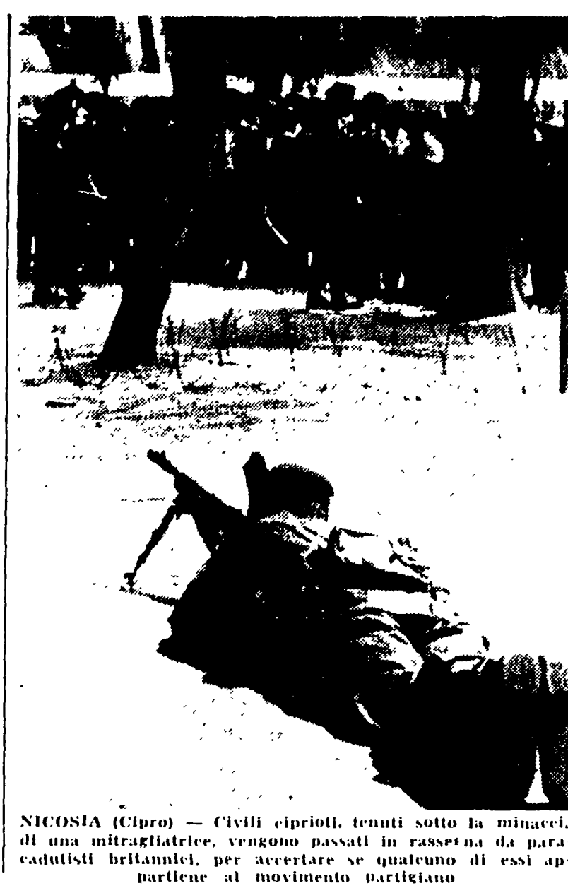
Nicosia (Cipro) - Civili ciprioti, tenuti sotto la minaccia di un mitra, vengono passati in rassegna da paracadutisti britannici.

Un intenso programma di visite attende nelle prossime settimane il Capo dello Stato.