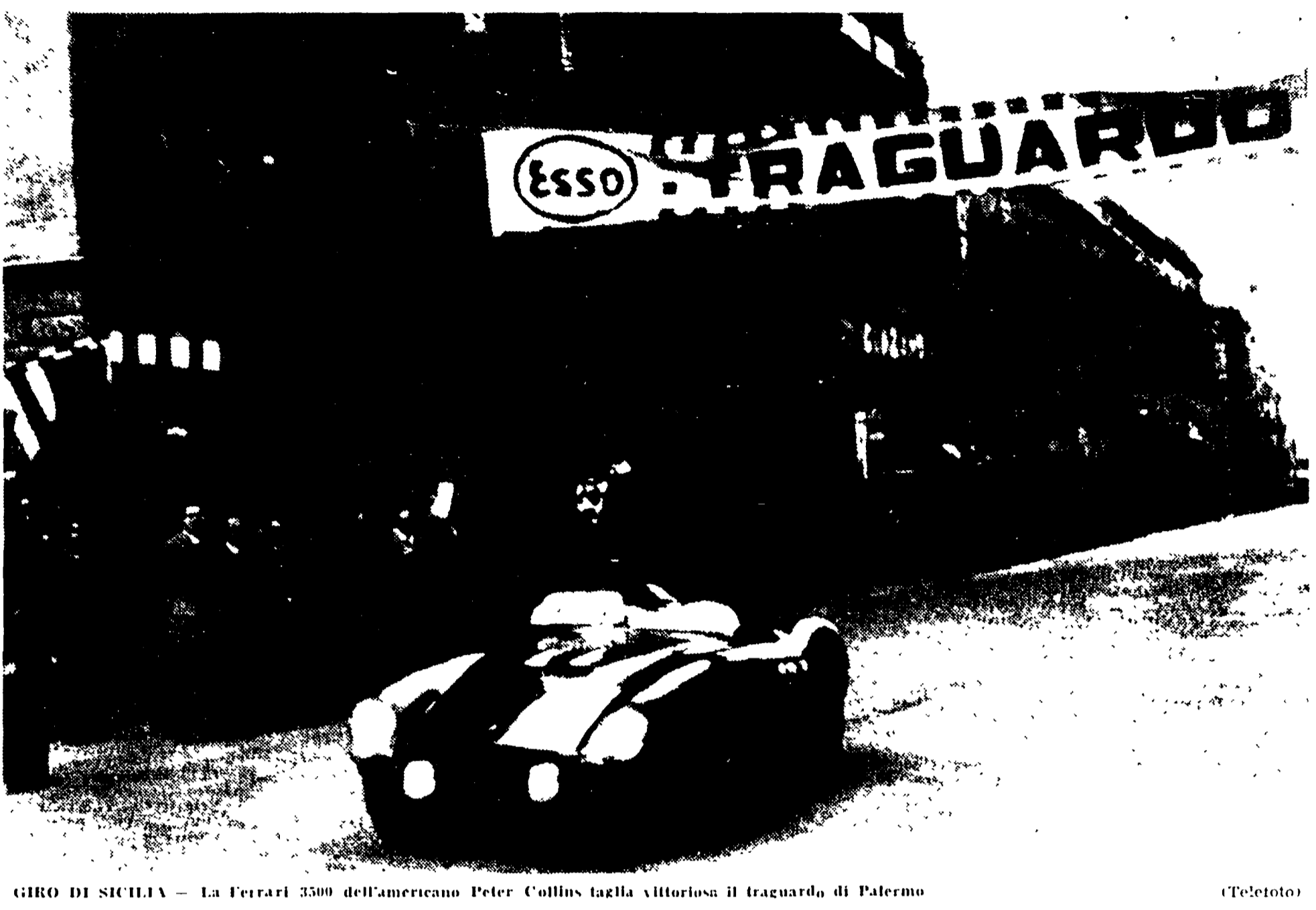
GIRO DI SICILIA - La Ferrari 3500 dell'Americano Peter Collins taglia vittoriosa il traguardo di Palermo