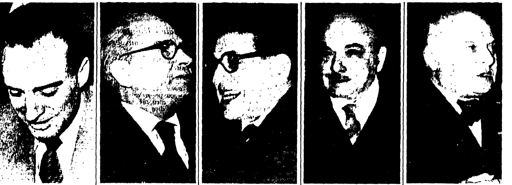
Il compagno Aldo Natoli e il capoluogo del P.C.I. Consigliere comunale uscente, egli si è battuto in Campidoglio per contrastare il passo agli speculatori e al monopolio... Il compagno Edoardo D'Onofrio, vice-presidente della Camera... Il sen. Enrico Molè, vice-presidente del Senato... Il sen. Tomaso Smith è un popolare rappresentante della opinione pubblica romana.