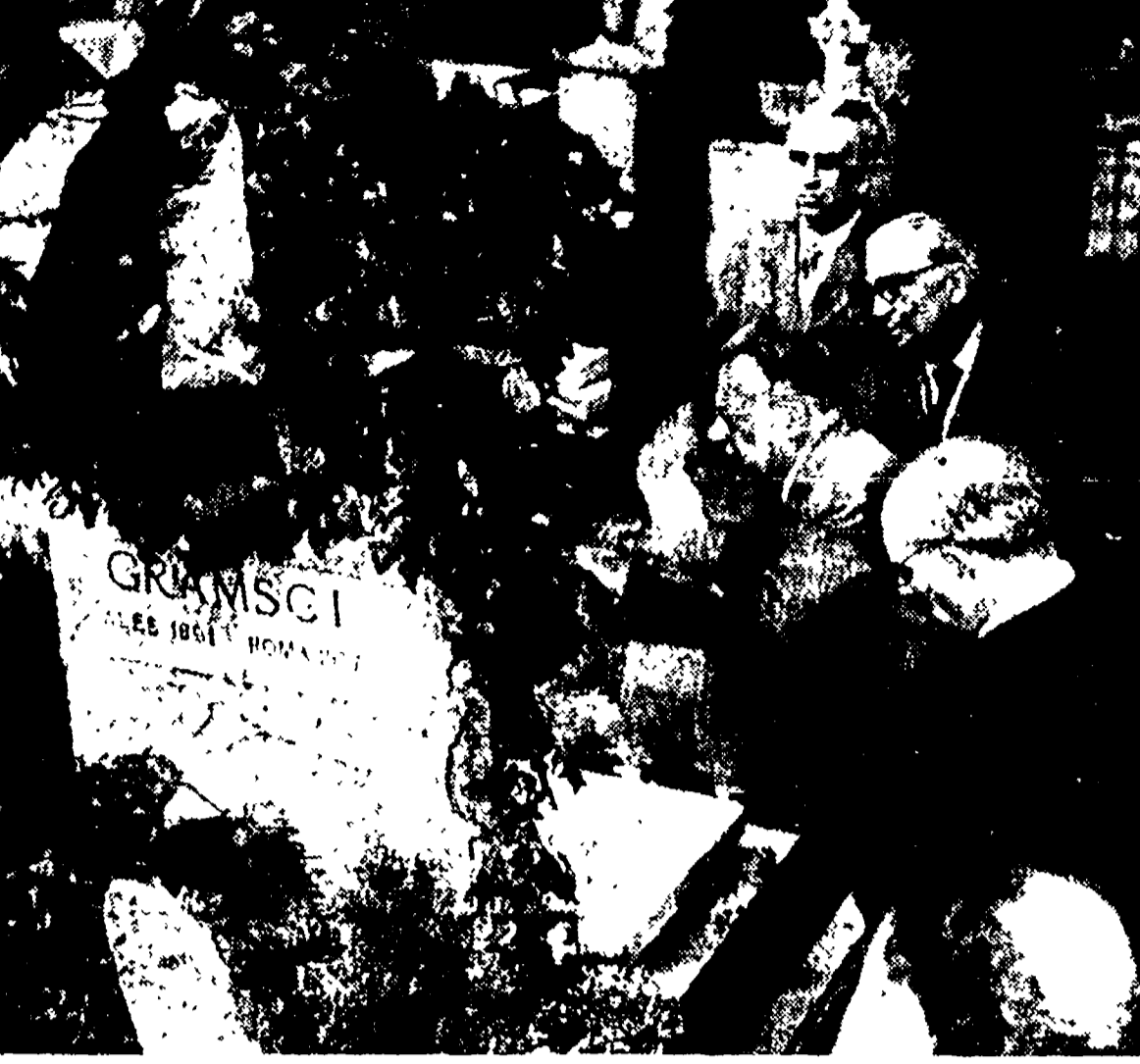
I compagni della Segreteria, della Direzione e dell'apparato del Comitato centrale si sono recati ieri mattina al cimitero degli Inglesi, a Roma, a deporre fiori sulla tomba di Antonio Gramsci...