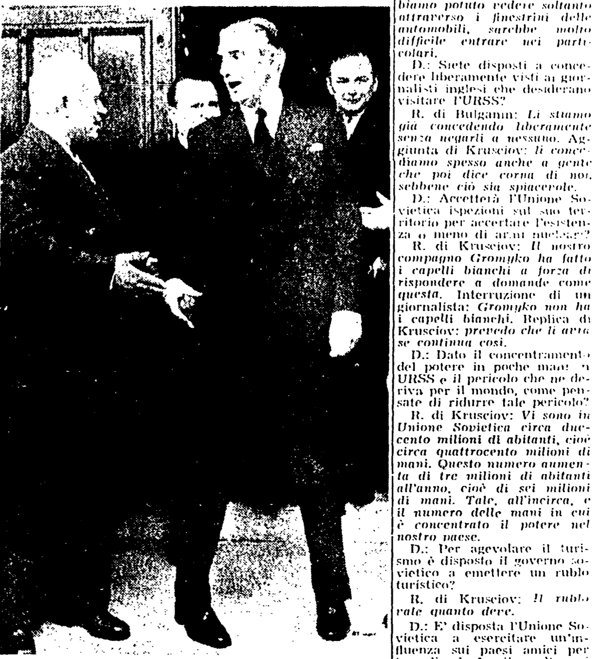
LONDRA - Il «premier» Eden (a destra) si accomia dal compagno Krusciov

BUENOS AIRES, 27 - Il porto della capitale argentina è stato seriamente paralizzato da uno sciopero di avvertimento di 24 ore, che è il quinto prolungato nel corso degli ultimi due mesi. Vi hanno partecipato ottomila lavoratori, che protestano contro il rifiuto delle autorità di concedere aumenti salariali.