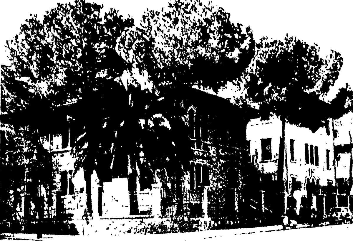
UN NUOVO LICEO SCIENTIFICO — In questa graziosa palazzina, di via Brenta, che la Provincia ha acquistata e rifatto è sorto un nuovo liceo scientifico.

La migliore rete stradale d'Italia. Le realizzazioni nel settore scolastico. L'assistenza. I rapporti col Comune. Iniziative ritardate o intralciate dall'amministrazione capitolina.