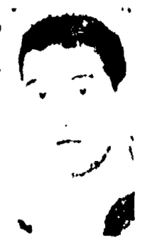
Nella foto il campione del mondo di boxe

L'imbattuto Rocky Marciano annuncia il suo ritiro dalle attività sportive