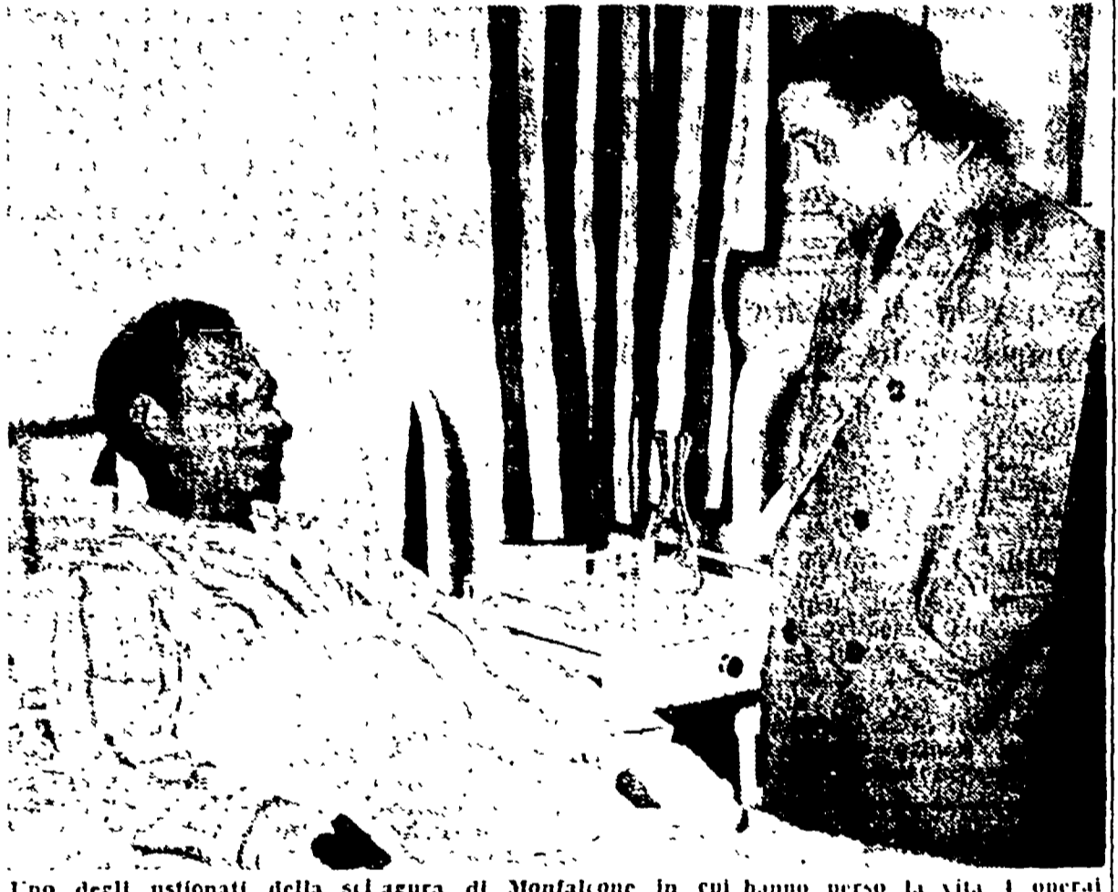
Uno degli ustionati della sciagura di Montefiore in cui hanno perso la vita i operai

La FILEA invita le autorità a far rispettare le leggi sulla prevenzione - Le impressionanti statistiche sugli infortuni