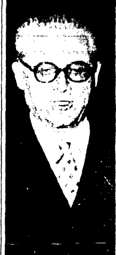
Ricorre oggi un anno dalla seduta delle Camere riunite nella quale Giovanni Gronchi fu eletto Presidente della Repubblica.