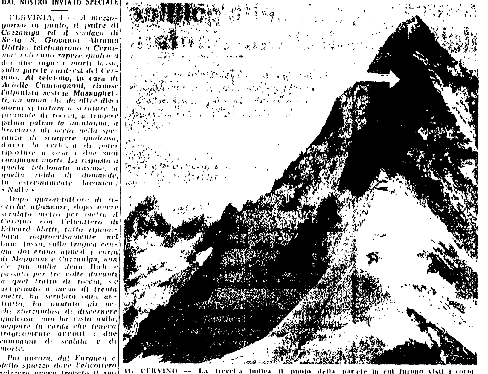
H. CERVINO - La freccia indica il punto della parete in cui furono visti i corpi inattuali delle due vittime

La scoperta del pilota dell'elicottero che sta effettuando le ricerche - Si ritiene che una slavina abbia fatto precipitare i due corpi lungo il ghiacciaio