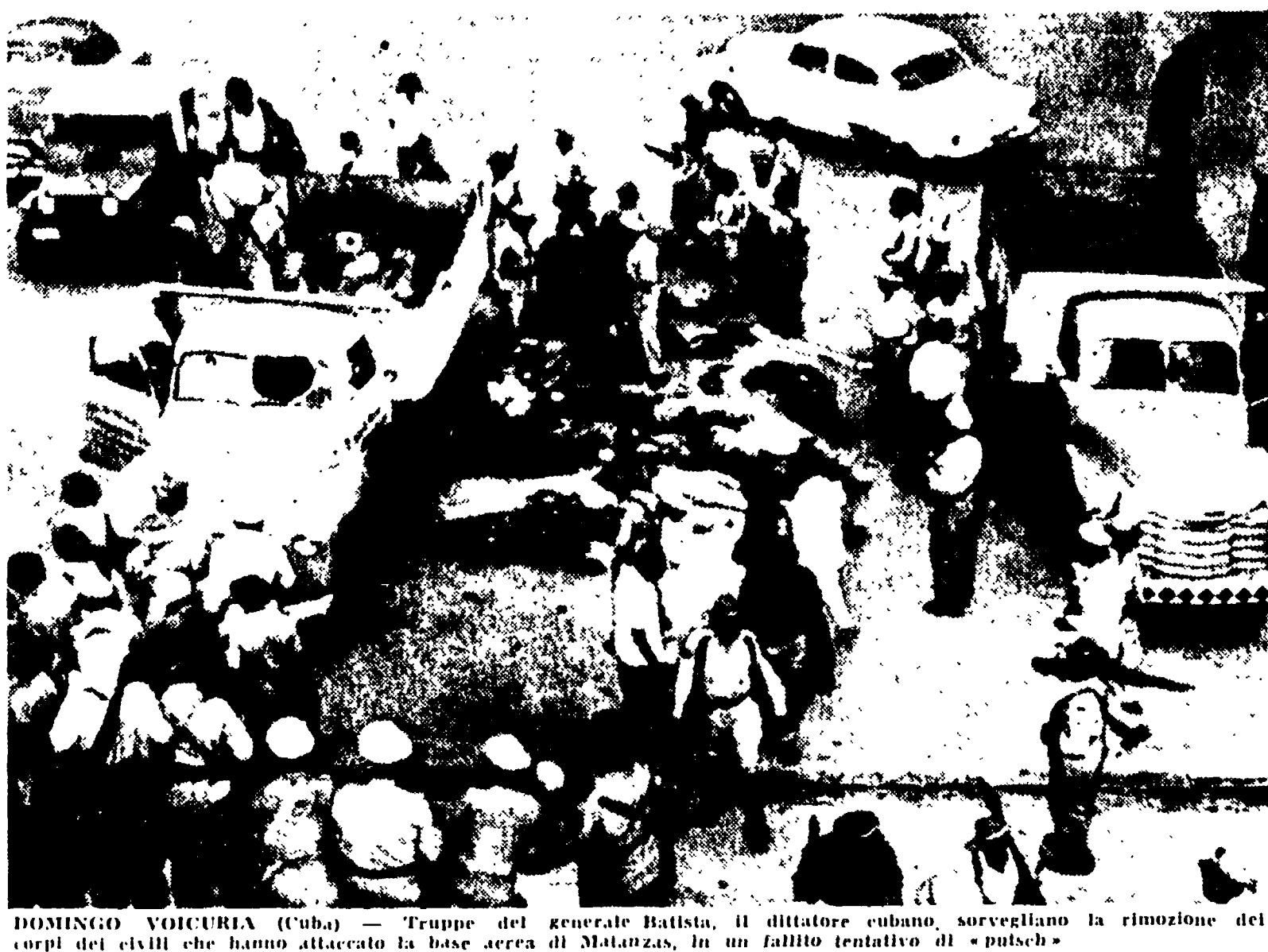
DOMINGO VOICURIA (Cuba) - Truppe del generale Batista, il dittatore cubano, sorvegliano la rimozione dei corpi dei civili che hanno attaccato la base aerea di Matanzas, in un fallito tentativo di "putsch".

LA REVOCA DI DUE LEGGI SOVIETICHE DEL '34 E DEL '37