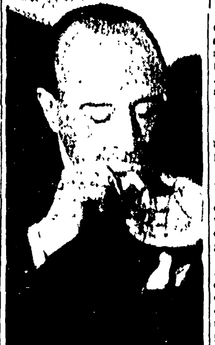
Il Conte Falina, presidente della Montecatini, è stato costretto a rinviare l'aumento del prezzo del solfato di rame...

La borsa nera degli anticrittogamici - E' possibile ridurre anche i prezzi dei concimi