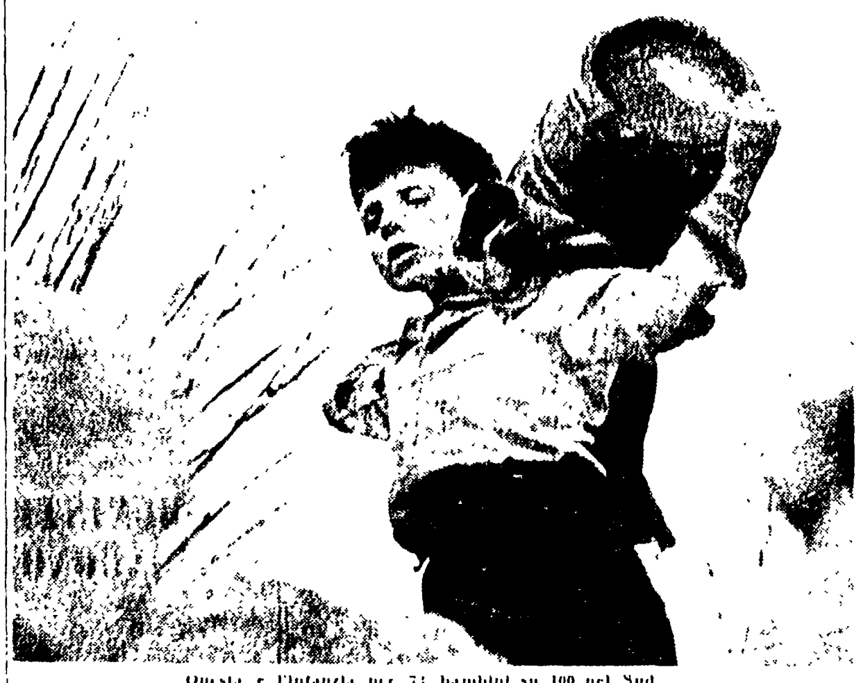
Questa è l'infanzia per 77 bambini su 100 nel Sud

La percentuale dei bambini che nel Sud terminano le elementari è del 37 per cento. Queste cifre sono un atto di accusa per quelle forze conservatrici che oggi si sono coalizzate nella triplice