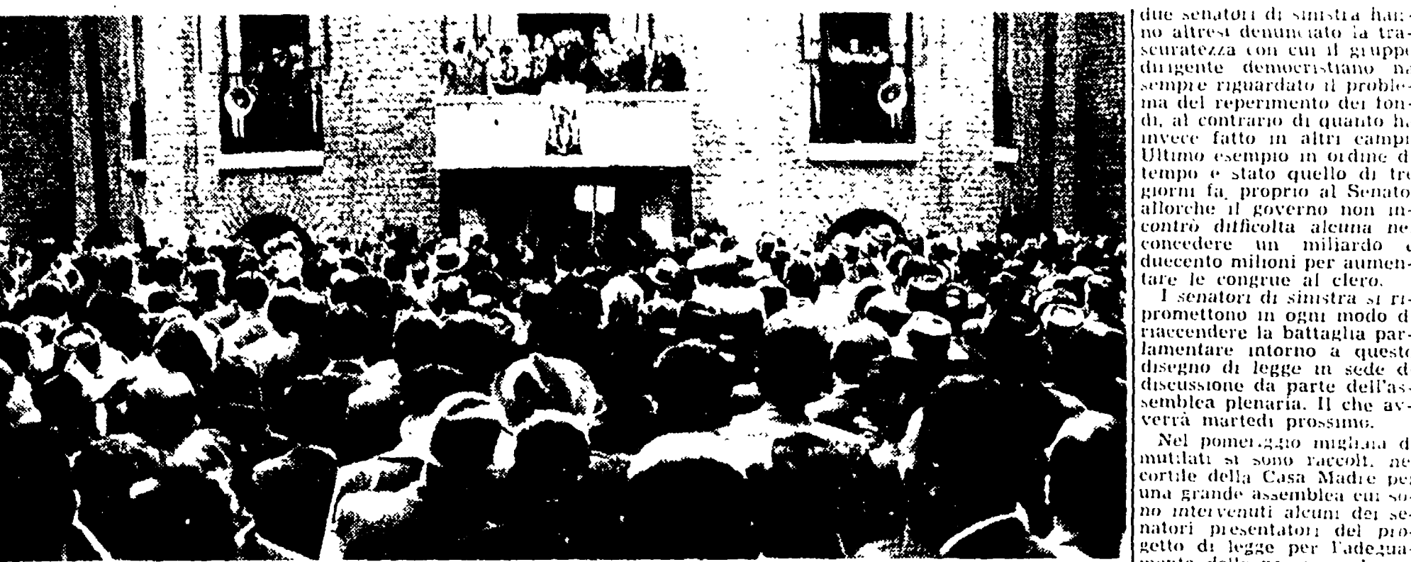
Un aspetto della manifestazione di ieri alla Casa Madre dei mutilati a Roma

Il governo ha respinto la rivalutazione delle pensioni di guerra. La presa di posizione è stata respinta per mattina dal ministro Zoli, in occasione del dibattito, dinanzi alla commissione finanze e tesoro del Senato, della proposta di legge presentata unitariamente dai dc Angelilli e Carelli, dai socialisti Lussu e Mancinelli, dal comunista Falcini e dal ministro Barbaro sin dal 12 febbraio 1954. Dopo oltre due anni di sabotaggio, cioè, i commissari del Senato hanno potuto finalmente affrontare uno dei problemi più sentiti da oltre un milione di italiani, che hanno compiuto più del loro dovere sui campi di battaglia: l'attesa, però, è stata mal ripagata. Il relatore sul progetto di legge — il dc Spagnolli — ha infatti affermato che, pur essendosi precedentemente dichiarato favorevole all'aumento delle pensioni, a ben ripensarci doveva ora ammettere l'impossibilità per l'Erario di reperire i 56 miliardi necessari. Che cosa si può, dunque, fare adesso? — si è chiesto il relatore, fingendo di non