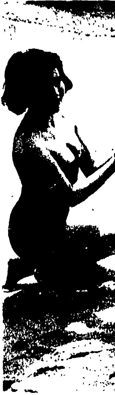
Passaggio del festival di Cannes. Un bambino di strada francese, interpretato da un bambino di strada di queste sfilate.

Con Lukács, ma il colore lo rimandiamo ad altra occasione. Lukács, ma il colore lo rimandiamo ad altra occasione. Lukács, ma il colore lo rimandiamo ad altra occasione. Lukács, ma il colore lo rimandiamo ad altra occasione.