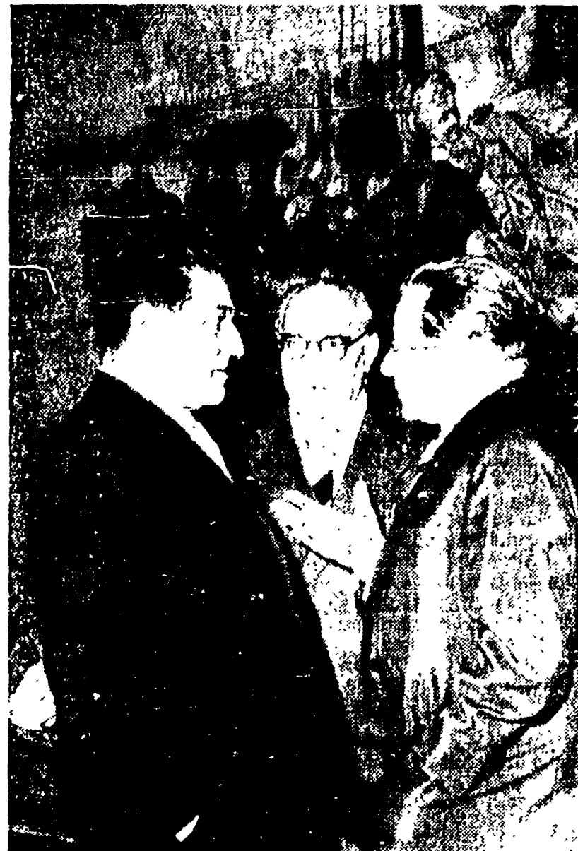
I compagni Tagliatti, Scoccimarro e Di Vittorio al ricevimento che il Presidente Gronchi ha dato ieri nei saloni del Quirinale nella ricorrenza del decennale della Repubblica.

Il mondo della cultura ha partecipato in modo particolare al ricevimento. Tra gli ospiti di spicco si ricordano: Sibilla Aleramo, che ha fatto gremire di una folla e propria folla anche il mondo della cultura.