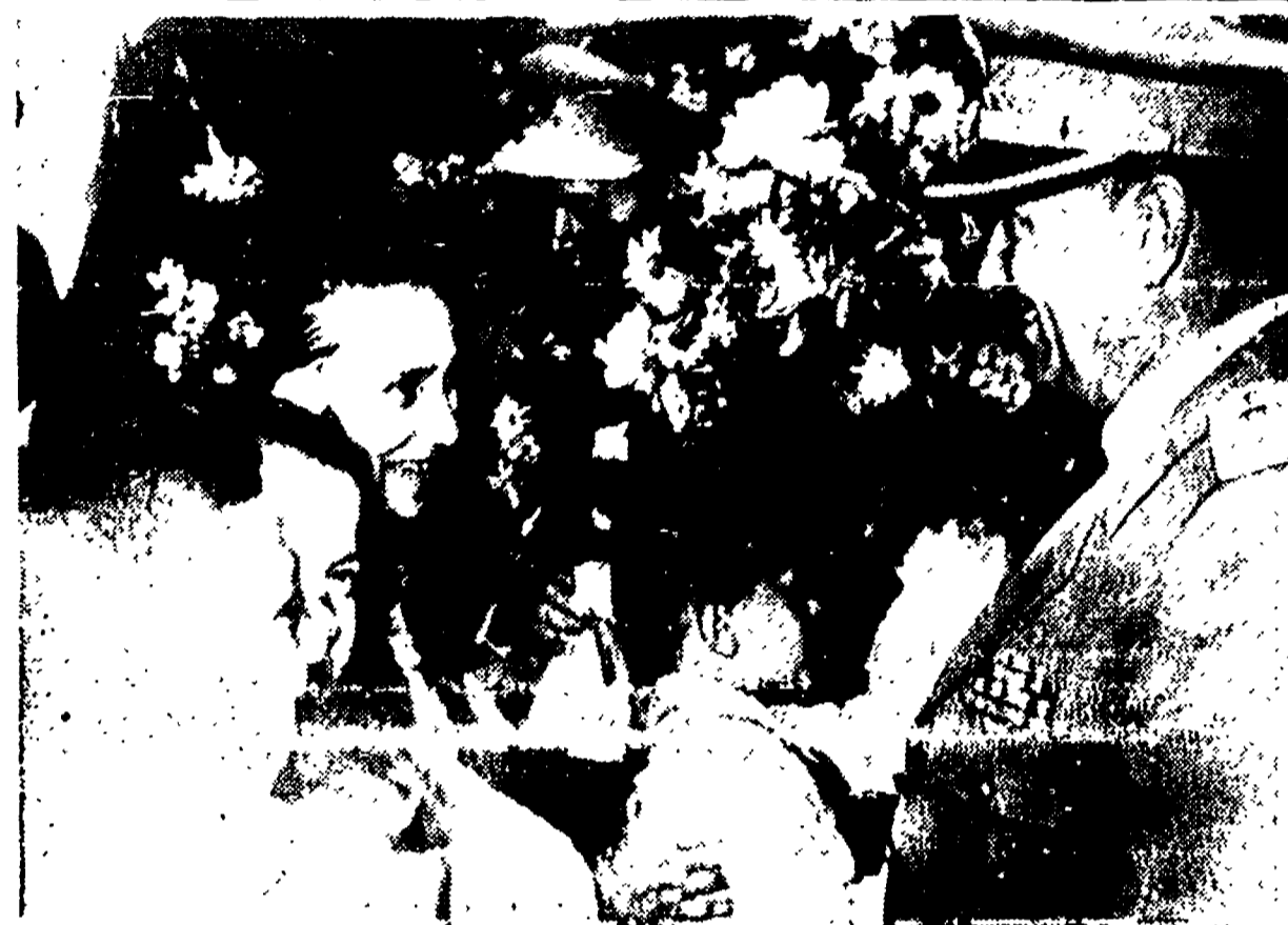
MOSCA - I fiori dei bimbi moscoviti al compagno Tito

PARIGI, 2. - (A. P.) - Guy Mollet ha posto questa notte la questione di fiducia sulla politica governativa in Algeria, Marocco e Tunisia. Un solo ordine del giorno contro le previsioni. Tale decisione è uscita stanotte da una riunione dibattimentale del gruppo parlamentare SFIO. I socialisti più coscienti hanno fatto rilevare a Guy Mollet che presentando tre ordini del giorno distinti uno per ognuno dei problemi dell'Africa del Nord si faceva il gioco della reazione. Questa infatti aveva in programma di votare contro la politica governativa condotta dal ministro Savary a Marocco e Tunisia, di condannare la politica estera di Pincou e dare un voto massiccio alla politica algerina di Lacoste. In questo modo Guy Mollet si sarebbe trovato con una certa maggioranza contraria a se stesso.