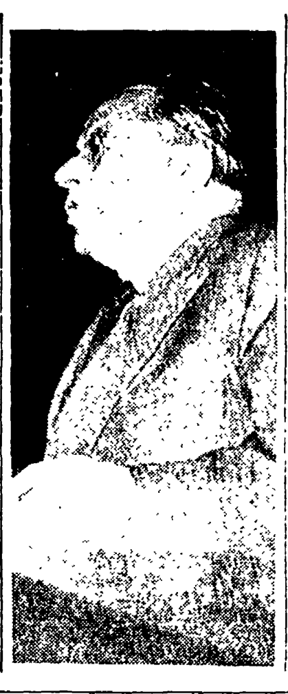
Il compagno Palmiro Togliatti.

Il problema fondamentale è che il mondo non è più quello di prima, è cambiato e continua a cambiare. Il mondo è cambiato, prima di tutto, nella sua struttura. È cambiato, in secondo luogo, nell'indirizzo delle relazioni internazionali, le quali devono adeguarsi a questa nuova struttura e già lo stanno facendo. È cambiato, infine, perché si è accumulata, in quest'ultimo decennio, una grande esperienza dei popoli e dei governi, si sono creati grandi movimenti di masse che hanno condotto lotte fortunate, in difesa della causa della pace, si sono formati nuovi stati di coscienza nei