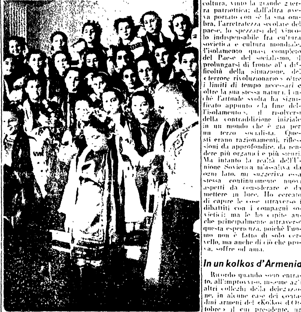
Kiev — Coro di bambine ucraine.

Una brusca domanda. «Come mai il popolo sovietico non si ribella, non ha mai fatto un passo verso la democrazia?». Questa la domanda che è stata rivolta a un professore di storia all'Istituto polacco di storia all'Istituto polacco di storia.