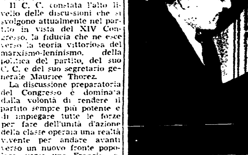
NEW YORK — Marilyn Monroe risponde alle domande dei giornalisti sul suo prossimo matrimonio col commediografo Arthur Miller

«Difendo il diritto di uno scrittore alle sue idee» dichiara il commediografo ai rappresentanti dell'inquisizione maccartista