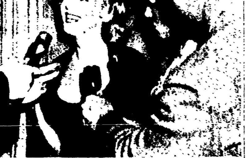
NEW YORK — Arthur Miller, si dice a New York, è stato letteralmente preso al laccio dagli inquirenti

«Difendo il diritto di uno scrittore alle sue idee» dichiara il commediografo ai rappresentanti dell'inquisizione maccartista