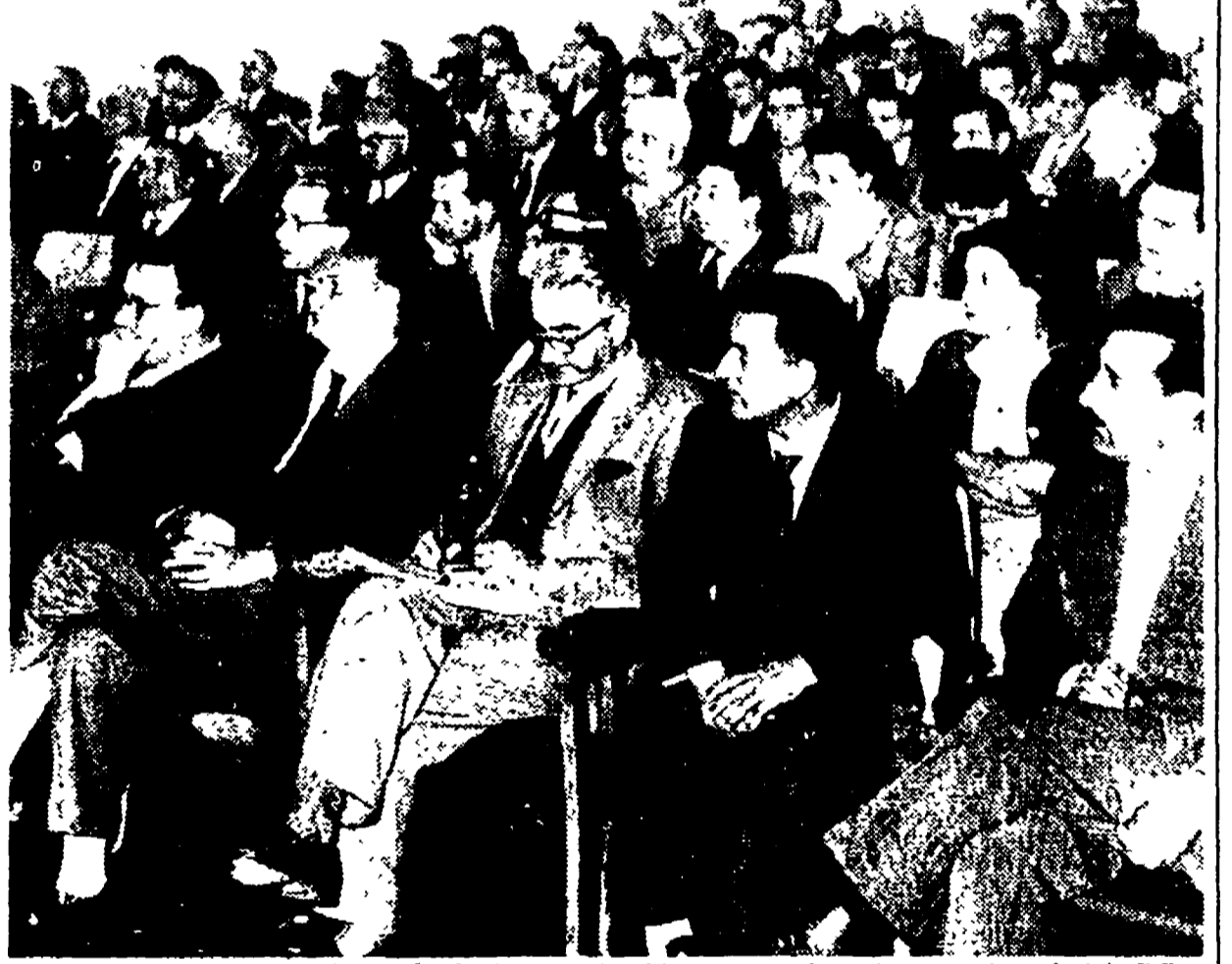
Un aspetto della sala delle riunioni a Frattocchie mentre si svolgono i lavori del C.C.