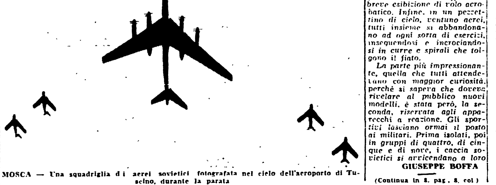
MOSCA - Una squadriglia di aerei sovietici fotografata nel cielo dell'aeroporto di Tusino, durante la parata