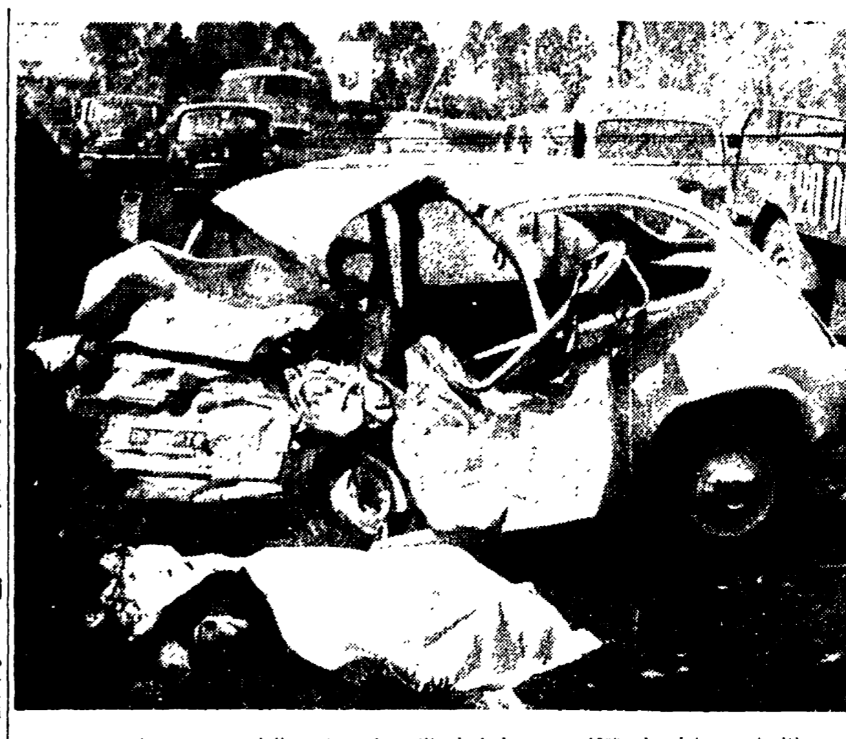
TORINO - La carcassa della « 600 » investita ieri da una « 1900 » lanciata a velocità pazzesca. Nella scena hanno preso la vita cinque persone, mentre altre sono rimaste ferite...