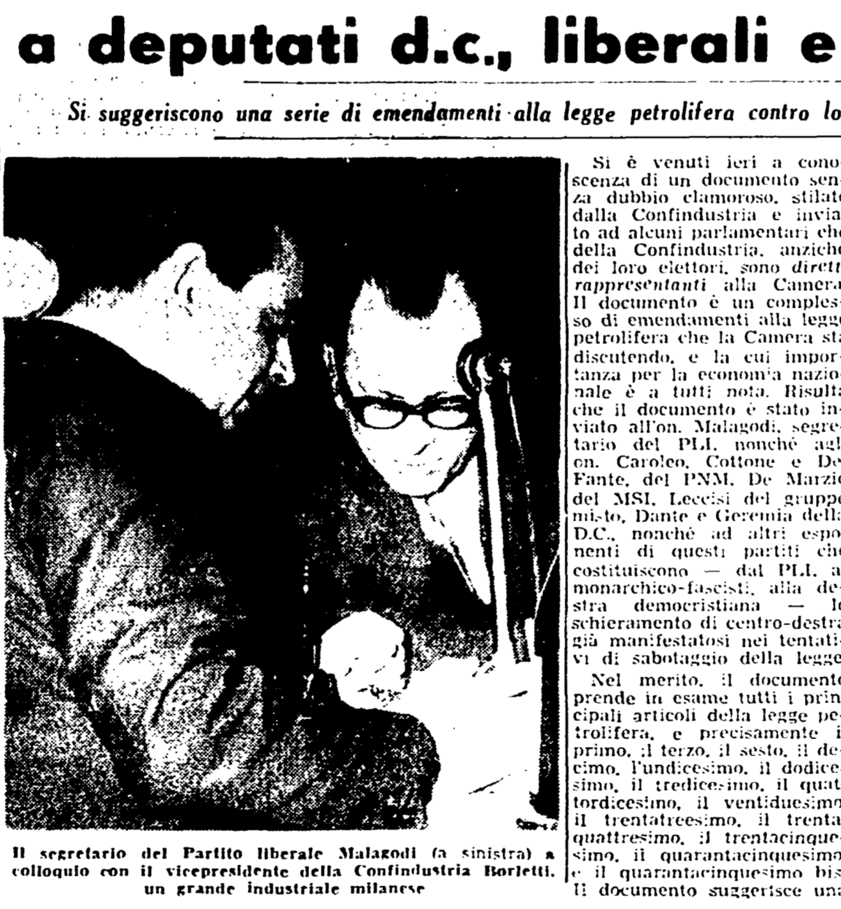
Il segretario del Partito Liberale Malagodi (a sinistra) a colloquio con il vicepresidente della Confindustria Borretti, un grande industriale milanese

Si suggeriscono una serie di emendamenti alla legge petrolifera contro lo Stato e per favorire la pirateria dei monopoli