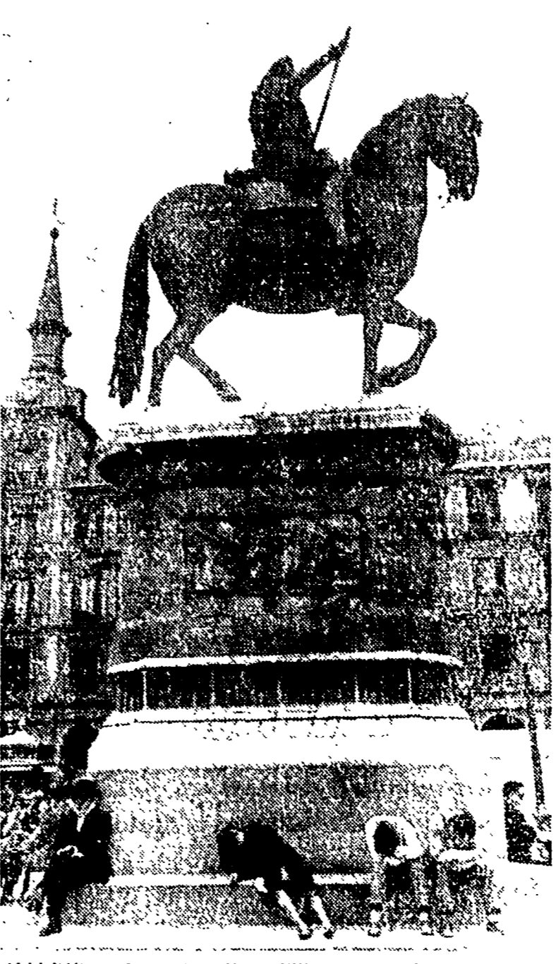
MADRID — La statua di re Filippo III nella Plaza Mayor