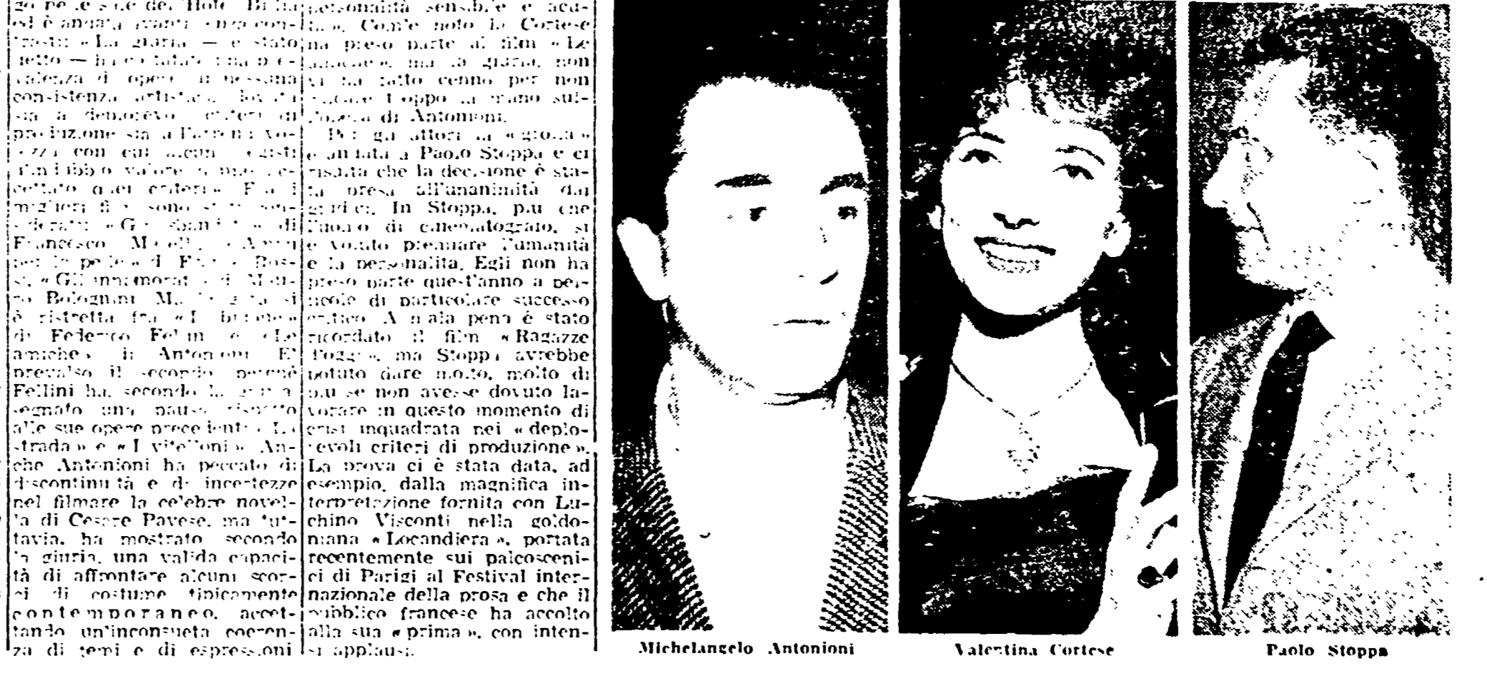
Michelangelo Antonioni, Valentina Cortese, Paolo Stoppa