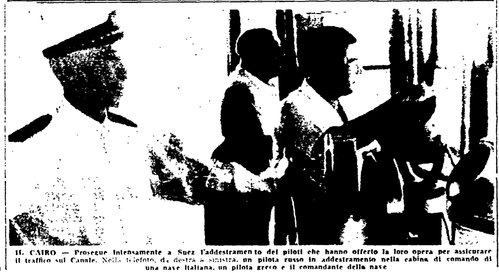
IL CAIRO — Prosegue intensamente a Suez l'addestramento dei piloti che hanno offerto la loro opera per assicurare il traffico sul Canale. Nella foto: a destra a sinistra, un pilota russo in addestramento nella cabina di comando di una nave italiana, un pilota greco e il comandante della nave

Il segretario generale del Partito comunista italiano, Palmiro Togliatti, pronuncerà un discorso alle 18.30 di domenica durante lo svolgimento della festa nazionale dell'Unità che si terrà a Roma nel grande parco di Villa Gori.