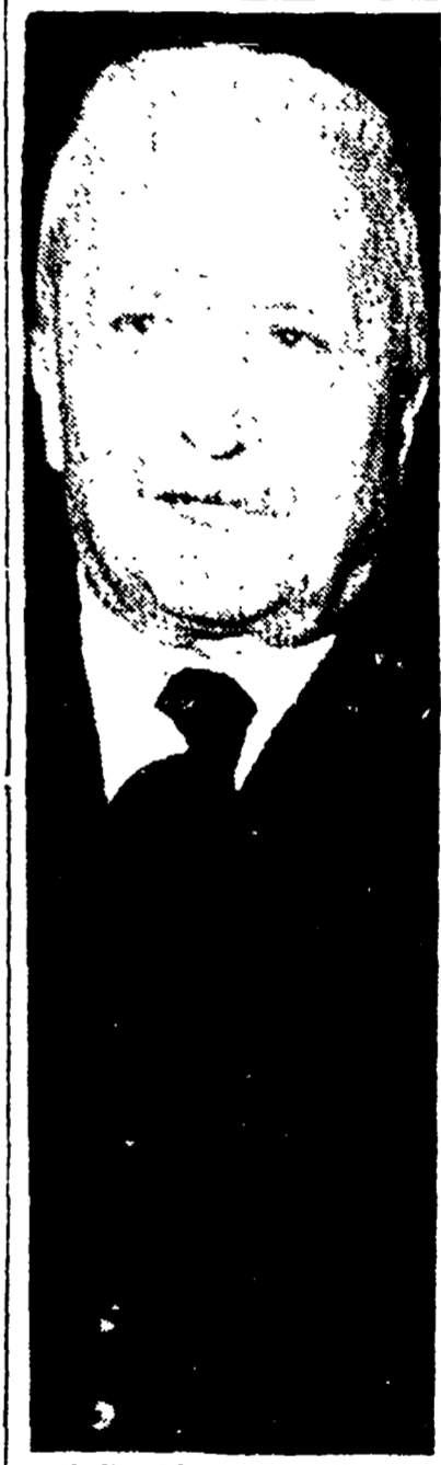
Il Presidente De Nicola

La conferenza di Suez, che si apre oggi a Londra, è un evento di grande importanza. La conferenza di Suez, che si apre oggi a Londra, è un evento di grande importanza. La conferenza di Suez, che si apre oggi a Londra, è un evento di grande importanza.