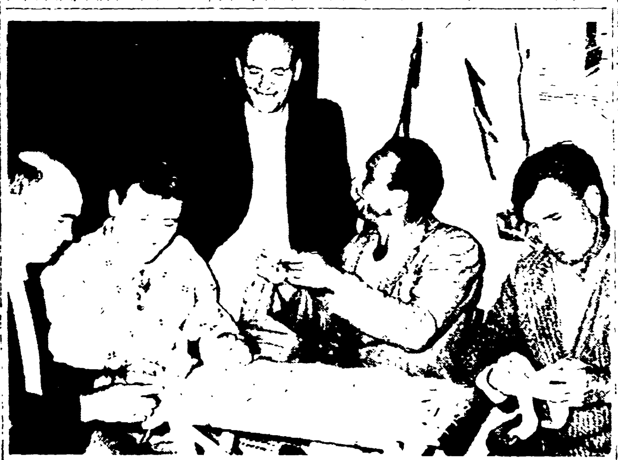
CAMPAGNANO - Compagni della sezione comunista contano i versamenti della sottoscrizione

La riunione della Direzione del Partito. La riunione sarà presieduta dal compagno Longo. La riunione sarà presieduta dal compagno Longo. La riunione sarà presieduta dal compagno Longo.