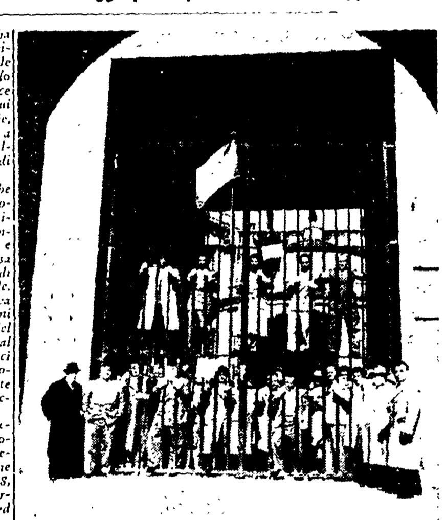
Una manifestazione dei mutilati di guerra asserragliati nella Casa Madre di Roma

La graduatoria delle Federazioni nella sottoscrizione per l'Unità