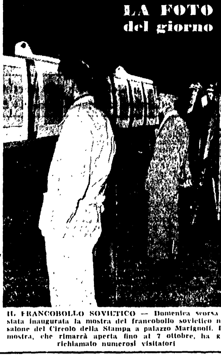
LA FOTO del giorno

Il franco-bollevol sovietico - Domenica scorsa è stata inaugurata la mostra del franco-bollevol sovietico nel salone del Circolo della Stampa a palazzo Marignoli. La mostra, che rimarrà aperta fino al 7 ottobre, ha già richiamato numerosi visitatori.