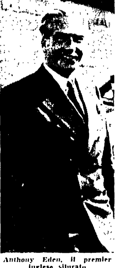
Anthony Eden, il premier inglese sfilato

do arabo, il quale continua a fornire petrolio all'America, solo a condizione che neppure una goccia venga trasferita ai due paesi aggressori. La pressione economica esercitata da Washington, di poter indirizzare la situazione a proprio vantaggio ed addirittura di poter salvare dal naufragio alcuni degli obiettivi fondamentali dell'operazione antiegitto, e cioè la « conquista » del canale di Suez. L'informazione pubblica oggi dal Daily Herald, secondo cui a Porto Said si sono ripresentati, sulla scia delle forze d'invacchia, i funzionari della vecchia Compagnia del Canale, appare in questo senso rivelatrice.