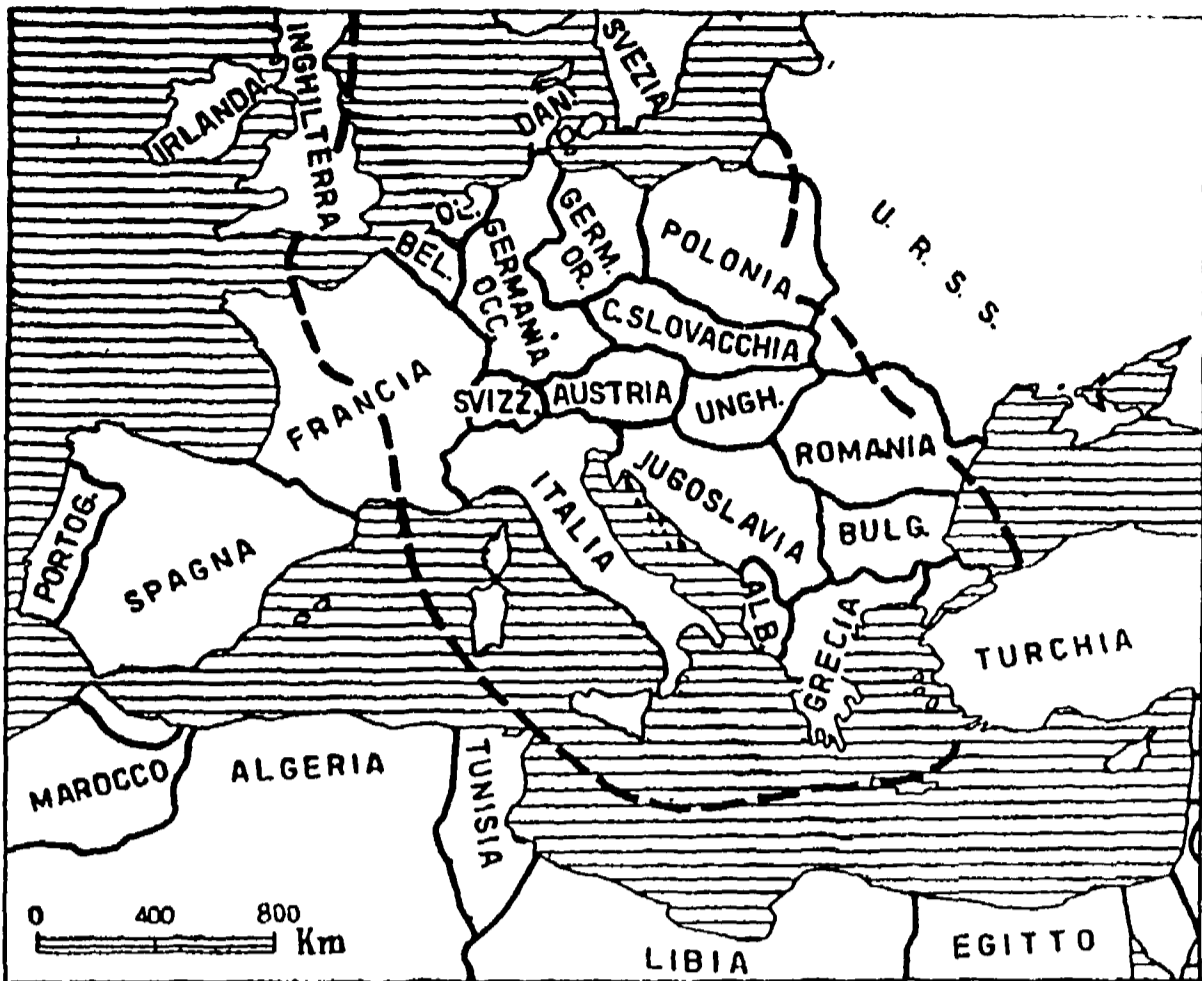
Le zone comprese tra le due linee tratteggiate indicano il territorio che - secondo l'ultima proposta sovietica - dovrebbe essere sottoposto al reciproco controllo aereo