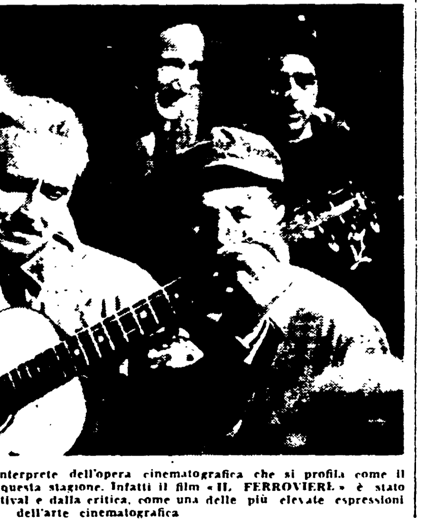
Pietro Germi è il regista ed interprete dell'opera cinematografica che si profila come il più grande successo italiano di questa stagione. Infatti il film «IL FERROVERDE» è stato giudicato dal pubblico del Festival e dalla critica, come una delle più elevate espressioni dell'arte cinematografica.