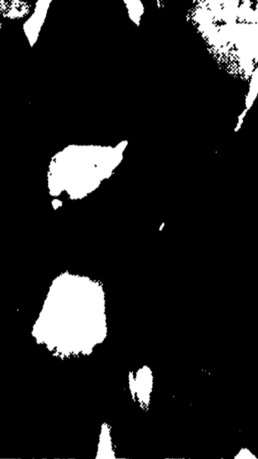
MOSCA - Il comitato tra i dirigenti sovietici e polacchi. Da sinistra Zavadski, Gomulka, Krusov, Kaganovic (parzialmente coperto) e Mikolaj

Varsavia che il debito annuo di oltre 2 miliardi di rubli, più di mezzo miliardo di dollari. Con l'annullamento di questo debito, vengono risolte le diverse questioni connesse al prezzo del carbone polacco esportato nell'URSS, come derivava dall'accordo concluso fra i due governi il 16 agosto 1945.