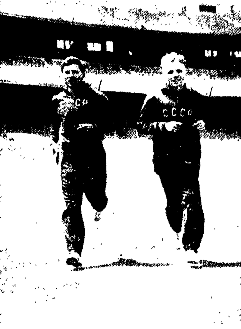
Il sovietico Vladimir Kuts, recordman del m. 10.000 si è leggermente ferito ieri: l'attesa mentre si faceva fotografare al volante di un'automobile, ha inavvertitamente premuto l'acceleratore e si è gettato contro un palo. Kuts si è cavata con qualche scalfittura e potrà continuare gli allenamenti e partecipare alle Olimpiadi. Nella foto KUTS (a sinistra) è in compagnia del connazionale Scherbakov.

◆ Come la luce del sole supera ogni cosa per calore e splendore, così non vi è più nobile vittoria di quella di Olimpia PINDARO