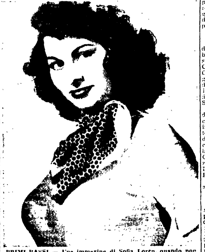
PRIMI PASSI — Una immagine di Sofia Loren, quando non era ancora la diva famosa che è oggi (ma non ci voleva molto intuito per dire che lo sarebbe divenuta). Fu all'incirca in quel tempo che il sarto Galatieri le confezionò i vestiti che sono oggi oggetto di un processo.

Il regista Gillo Pontecorvo assolto con formula piena. Era stato incriminato per un articolo pubblicato dal giornale di cui era direttore responsabile. La pubblicazione avvenne l'8 gennaio 1950.