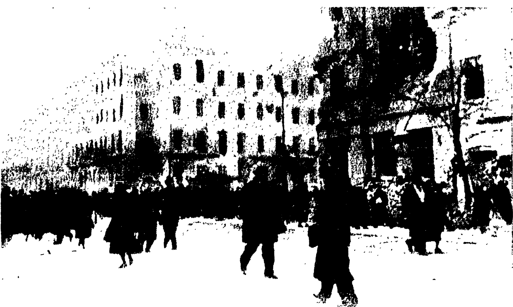
BUDAPEST - La popolazione ha ormai ricominciato a circolare intenzionalmente per le vie della capitale. Nella foto: la caserma «Maria Teresa», danneggiata nei combattimenti.