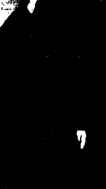
MOSCA - Il comitato tra i dirigenti sovietici e polacchi. Da sinistra Zavadski, Gomulka, Krusov, Kaganovic (parzialmente coperto) e Mikolaj (Telefoto)

Varsavia che il debito annuo di oltre 2 miliardi di rubli, più di mezzo miliardo di dollari. Con l'annullamento di questo debito, vengono risolte le diverse questioni connesse al prezzo del carbone polacco esportato nell'URSS, come derivava dall'accordo concluso fra i due governi il 16 agosto 1945.