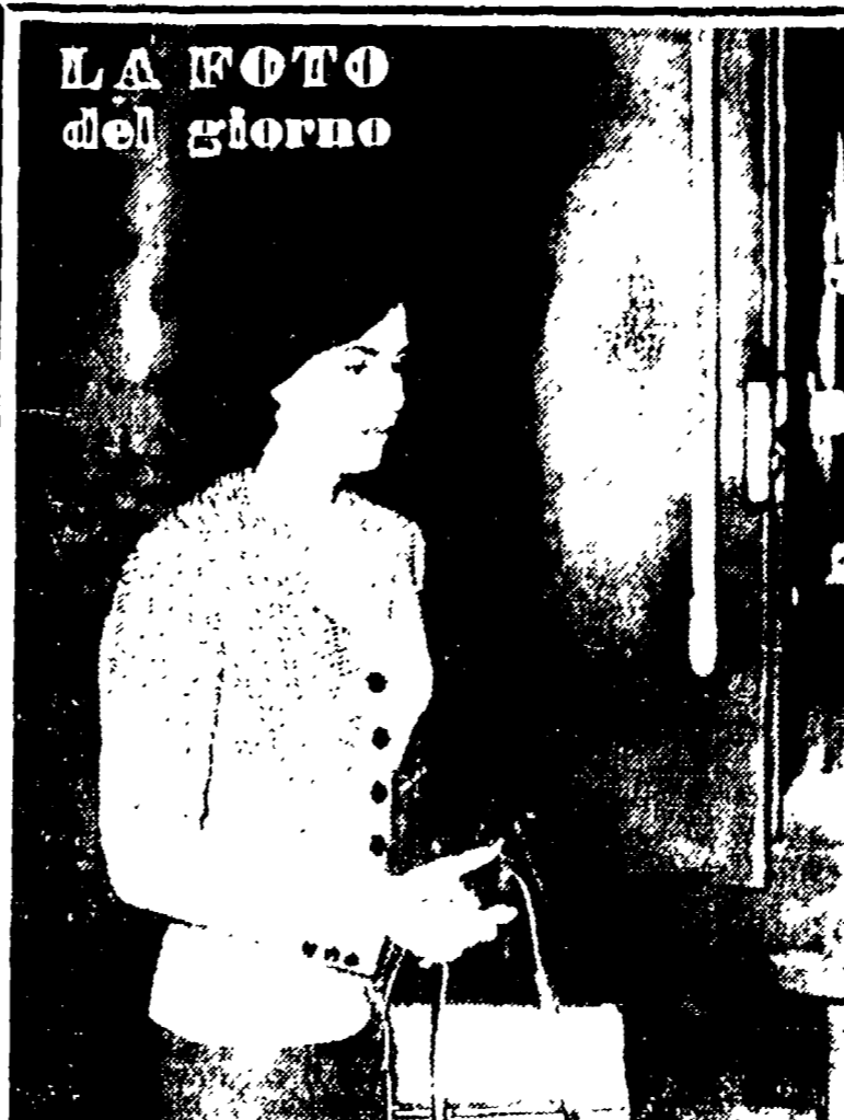
CINEMA IN GRECIA - Comincia in questi giorni ad Atene la settimana del film italiano.