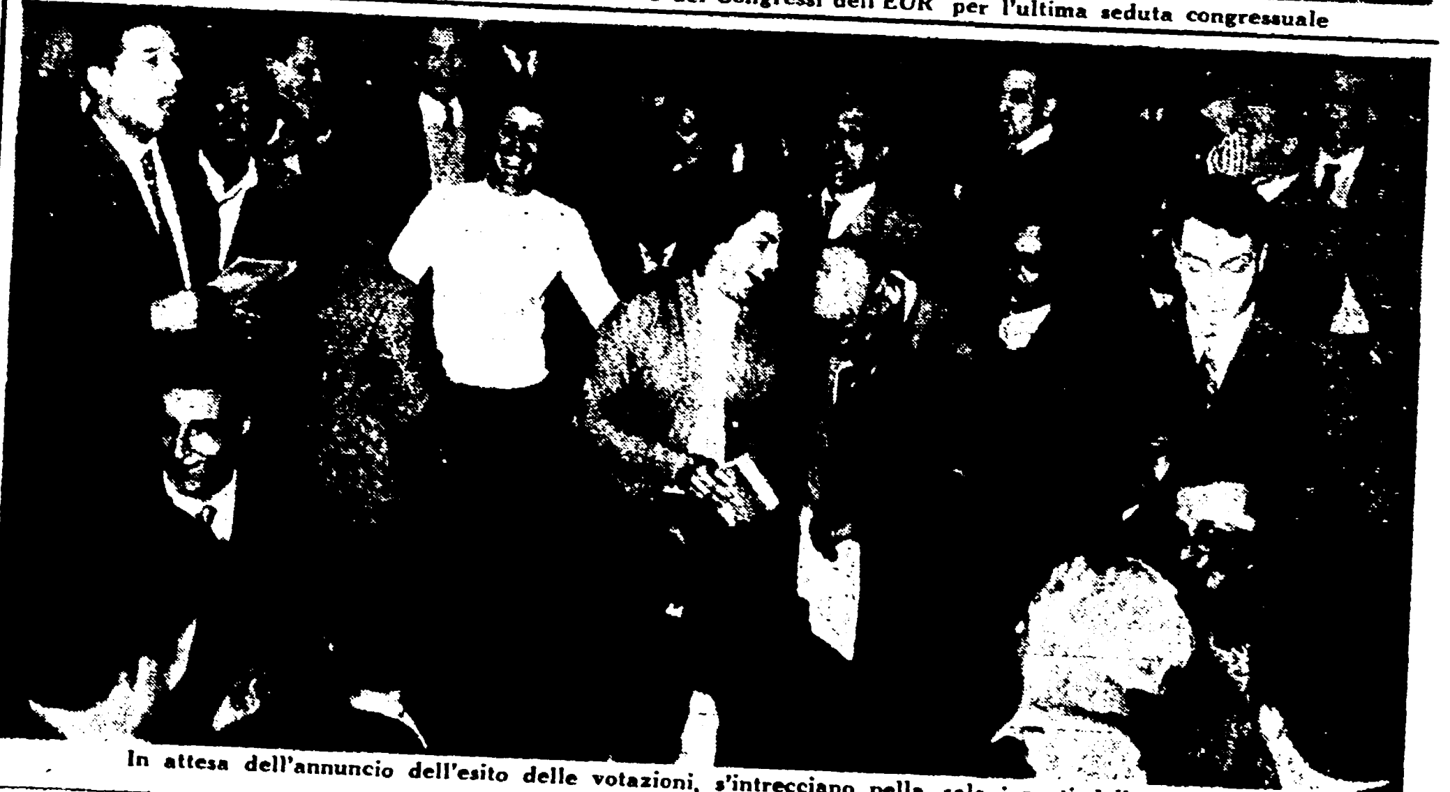
In attesa dell'annuncio dell'esito delle votazioni, s'intrecciano nella sala i canti delle varie regioni