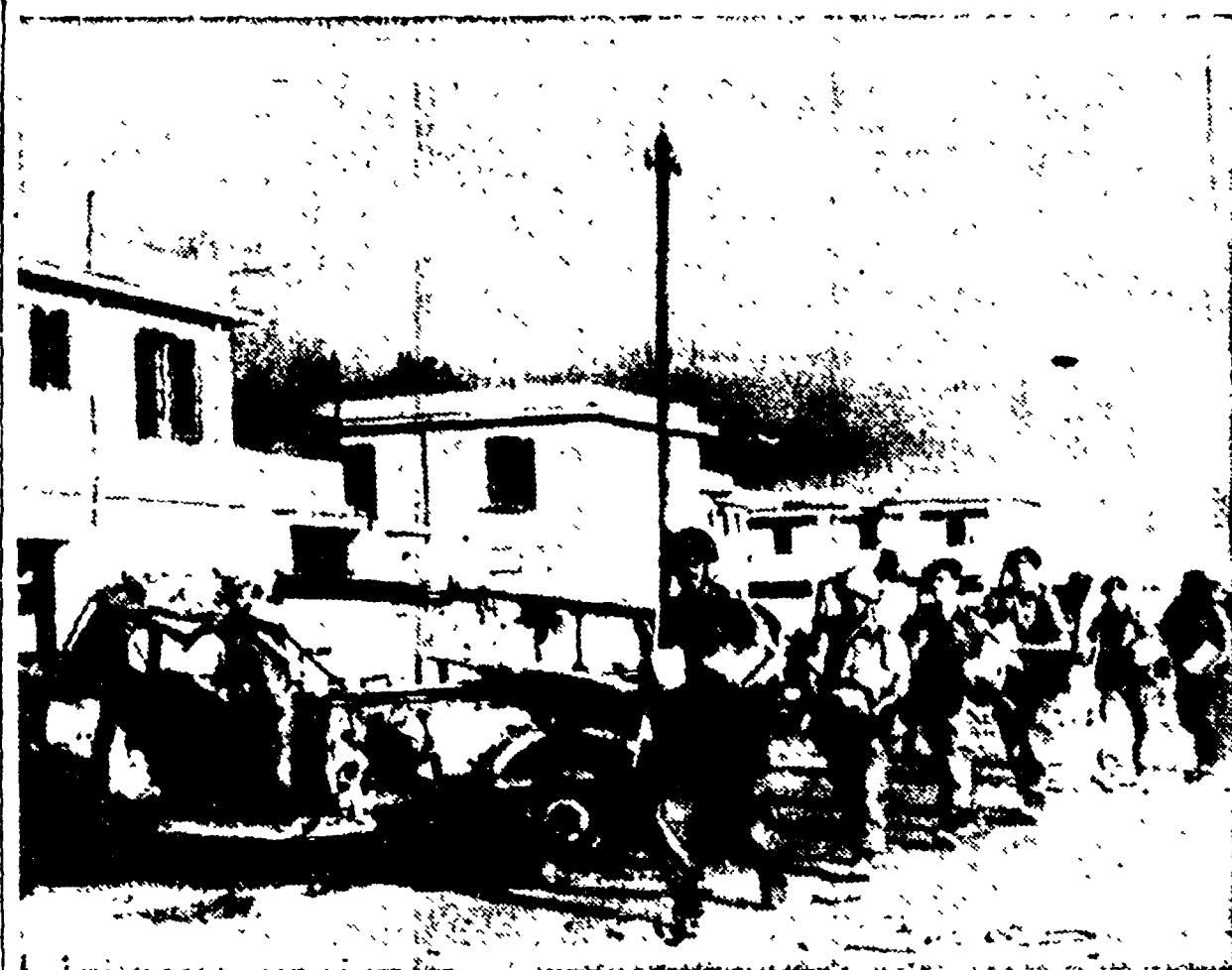
PORTO SAID — Reparti britannici lasciano la città. L'evacuazione avrebbe dovuto essere completata ieri

portieri. Ci siamo brevemente intrattenuti con uno di loro. «La maggior parte degli operai sono in fabbrica — ci ha detto — ma c'è ancora un po' di inquietudine; credo che i più approvano il servizio di vigilanza istituito dai reparti delle forze armate ungheresi: così possono essere impediti eccessi ed intimidazioni».