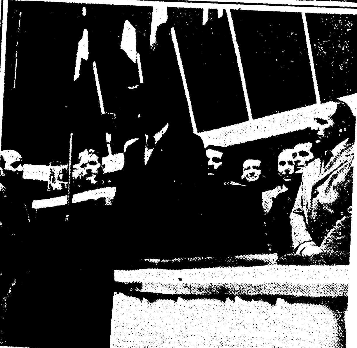
Una delegazione di tramvieri romani reca il suo saluto al Congresso