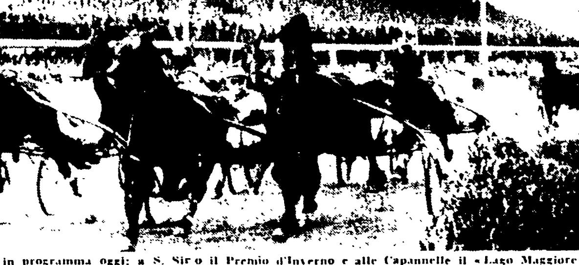
Due interessanti riunioni sono in programma oggi a S. Siro il Premio d'Inverno e alle Capannelle il «Lago Maggiore»

Giornata di gala per l'ippica a Milano e di scena il Premio d'Inverno in cui saranno di scena le migliori gelineotte del trotto italiano. La gara sarà disputata alle Capannelle di S. Siro, alle 14.30, e sarà vinta da un cavallo di nome «Lago Maggiore». Il premio d'Inverno è una delle più importanti gare del calendario ippico italiano. La gara sarà disputata alle Capannelle di S. Siro, alle 14.30, e sarà vinta da un cavallo di nome «Lago Maggiore».