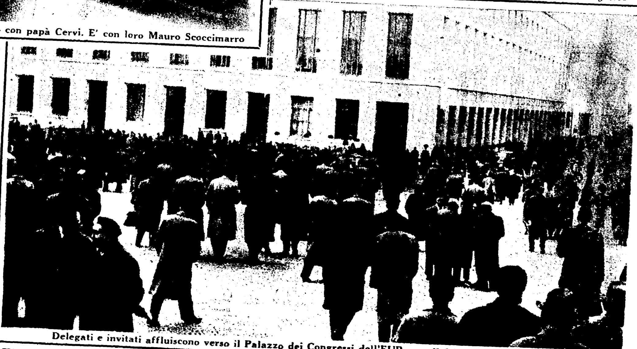
Delegati e invitati affluiscono verso il Palazzo dei Congressi dell'EUR per l'ultima seduta congressuale