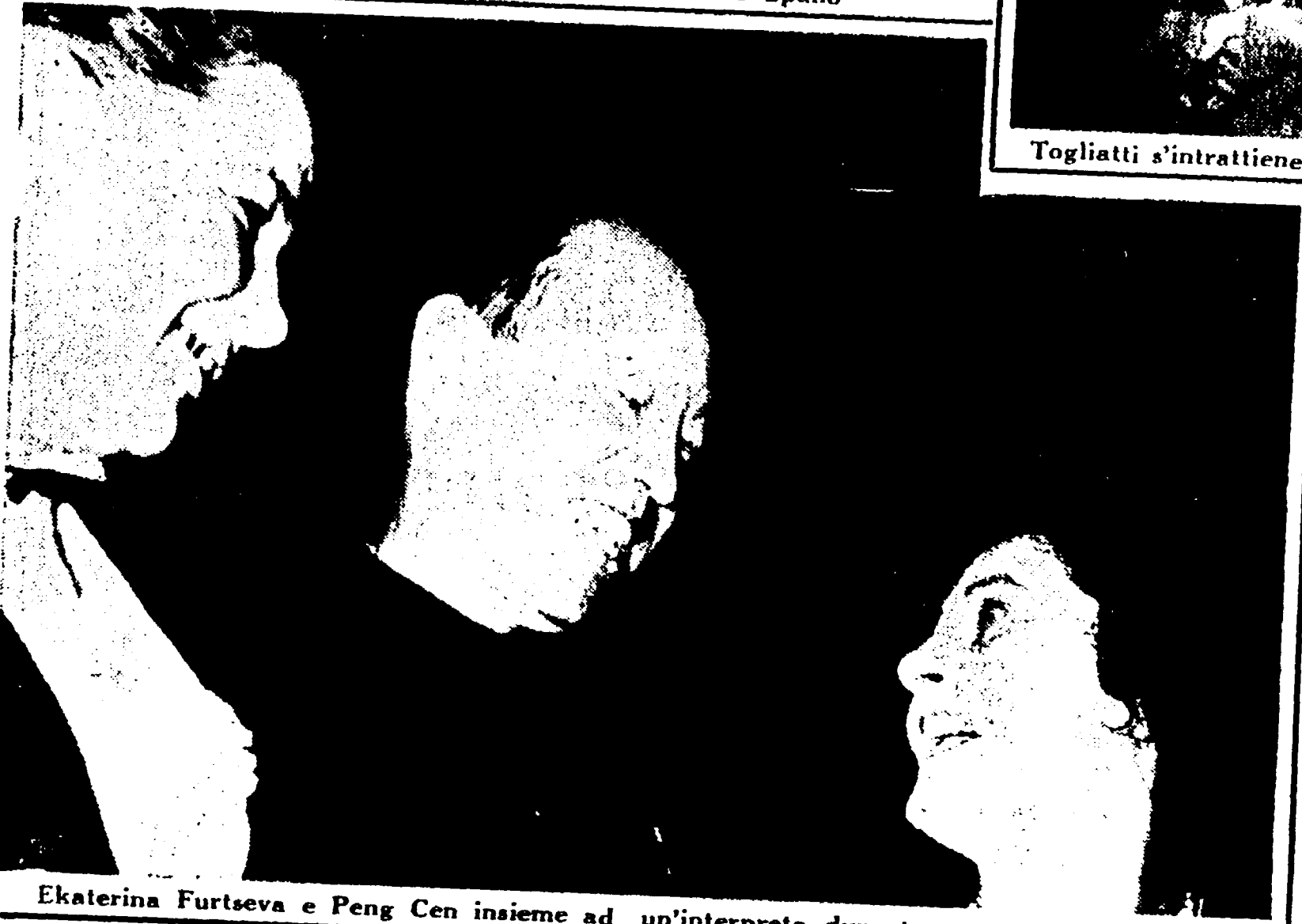
Ekaterina Furtseva e Peng Cen insieme ad un'interprete durante una pausa dei lavori