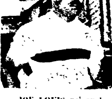
JOE LOUIS nei guai

CHICAGO, 15. — Le disavventure fiscali di Joe Louis sono ancora in corso. Un tribunale ha infatti approvato la decisione del governo di sequestrare la somma di 65.000 dollari che l'ex campione del mondo di pugilato aveva intestato ai suoi due figli Joe jr. e Jacqueline. L'avvocato di Louis Aaron Pave ha dichiarato che durante gli ultimi tre mesi l'ex campione aveva girato 124.000 dollari al Tesoro americano. La somma totale dei suoi debiti verso il fisco è valutata a 1.199.121 dollari.