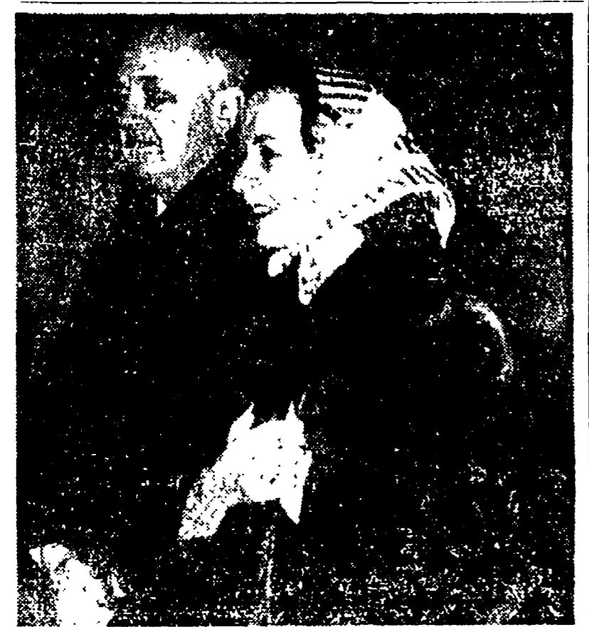
Pineau a passeggio per Roma con sua moglie