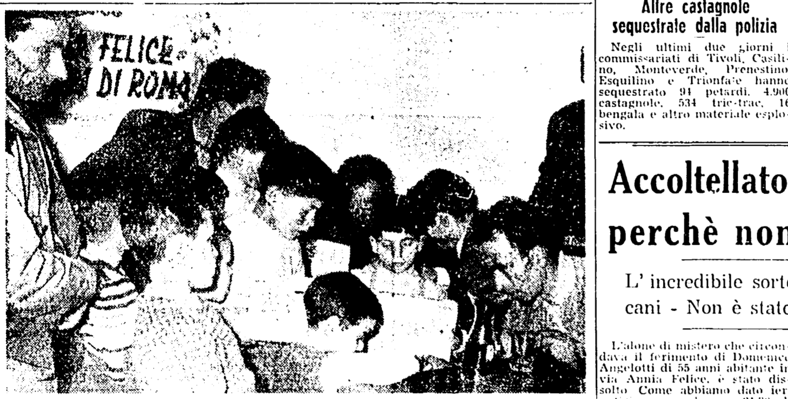
PER I LORO PICCOLI AMICI - Ieri, alla riunione di Borgata Finocchio per la raccolta dei doni per la nostra befana...