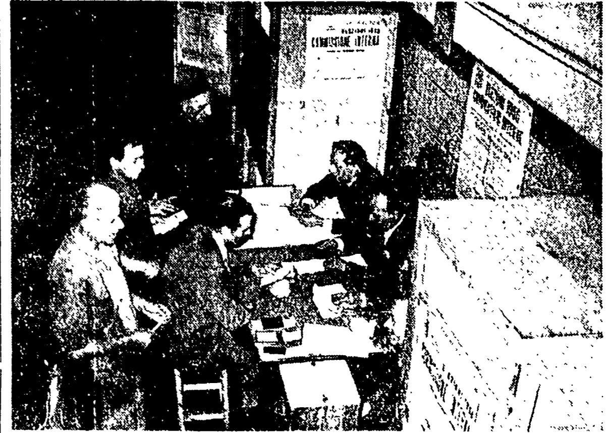
TORINO - Le votazioni dello scorso anno per l'elezione della C. I. alla FIAT

Una parte rilevante delle maestranze non aderisce ad alcuna organizzazione - Vasto dibattito tra i lavoratori per individuare e superare le cause della crisi