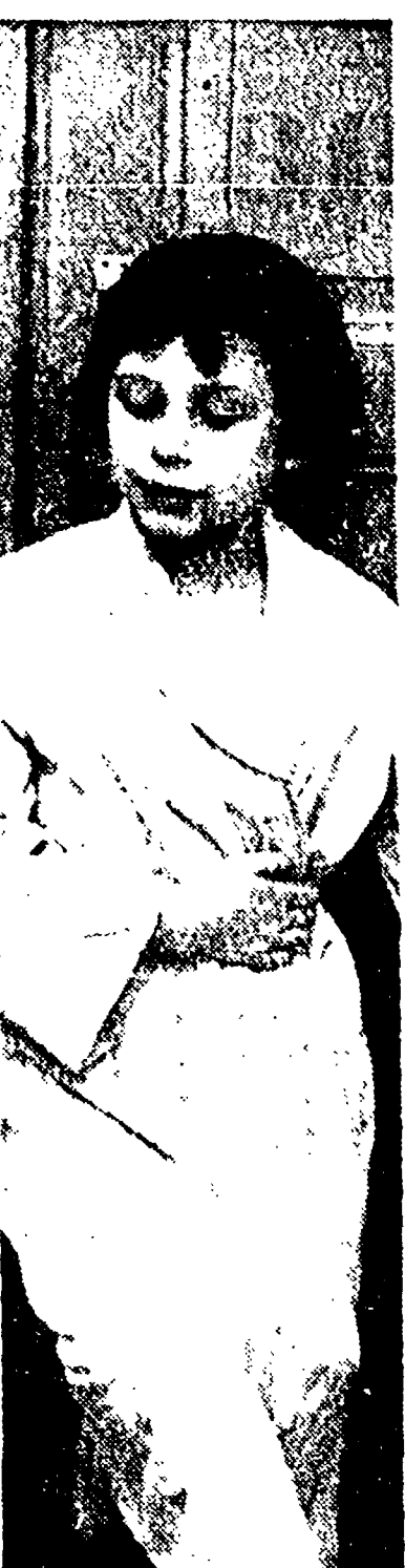
La moda dei fanciulli pro- dutto, dalla stessa Francia, sembra trasferirsi ora nel nostro Paese...

Il giudizio degli intenditori rimane comunque favorevole alla storiella che ha vinto il premio dell'anno scorso