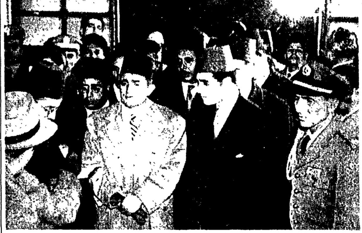
GENOVA — Ben Yusef, sultano del Marocco, fotografato al suo arrivo in Italia, domenica...