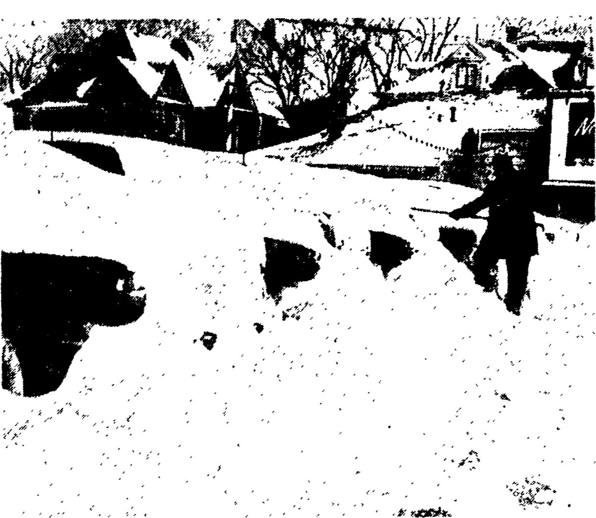
Anche in America il freddo non scherza. Ecco un gruppo di automobili completamente coperto dalla neve.