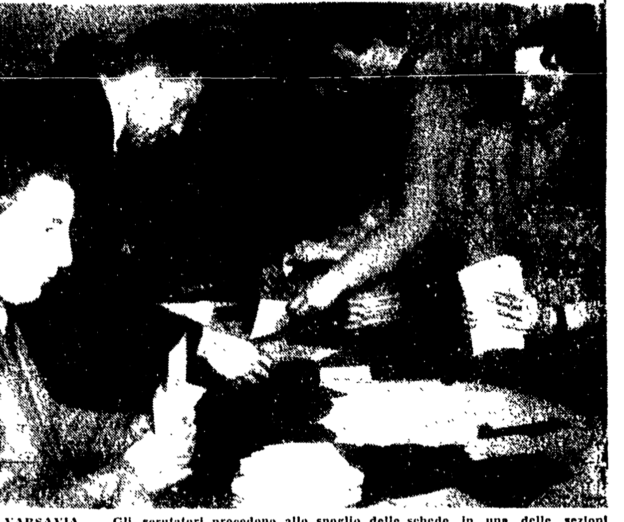
VARSAVIA - Gli scrutatori procedono allo spoglio delle schede in una delle sezioni elettorali della terza circoscrizione di Varsavia...