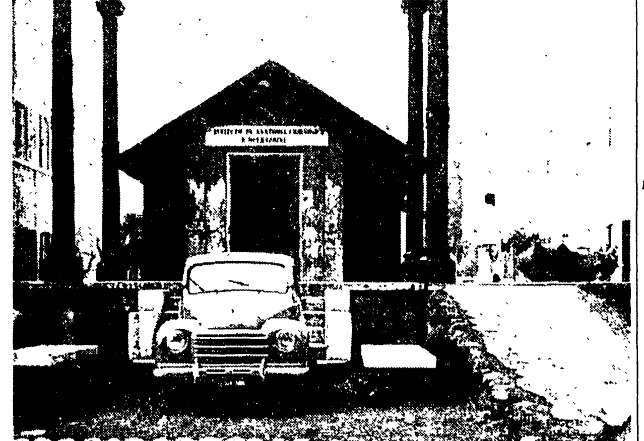
IL VECCHIO - Fra i padiglioni del Policlinico sorge questa baracca: è, come dice il cartello sull'architrave, l'Istituto di anatomia chirurgica. Un eloquente segno della presenza del vecchio negli ospedali romani