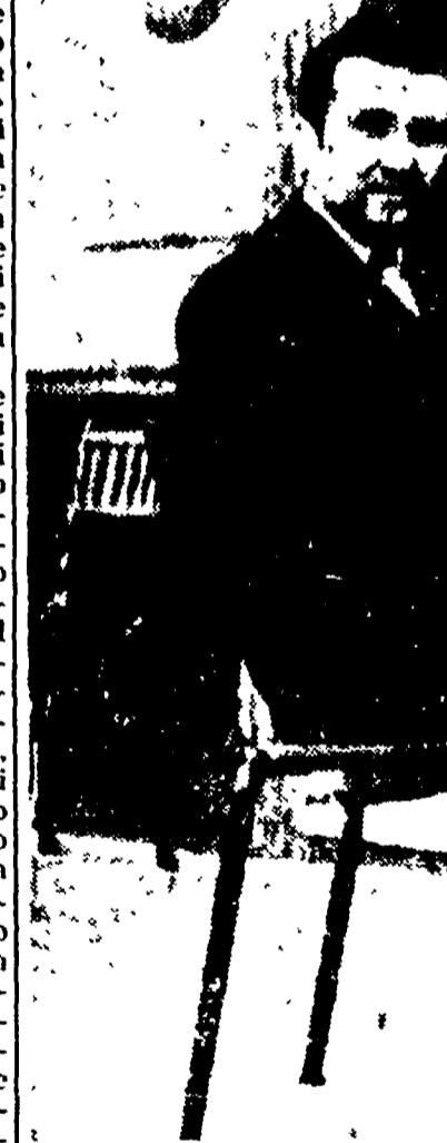
Nicola Tuccillo, il vincitore del 100 milioni della Lotteria

Più tardi il Tuccillo ha fatto una capatina al bar Carrea dove ha offerto cognac a tutti quanti erano nel locale, ed è ancora scappato.