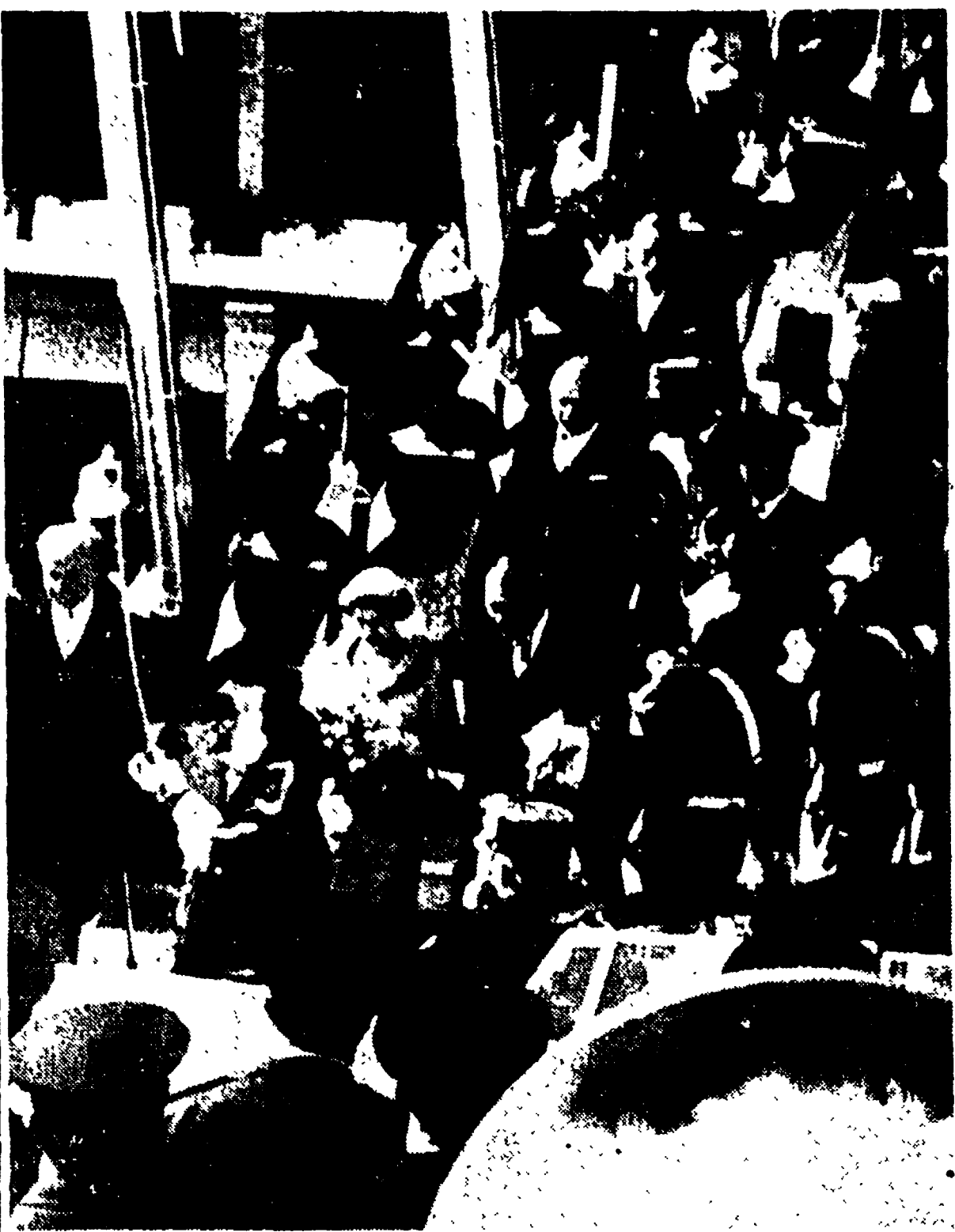
PARIGI - Elisabetta II e il Presidente francese Coty lasciano la saletta d'onore dell'aeroporto di Orly mentre la guardia della Repubblica presenta le armi