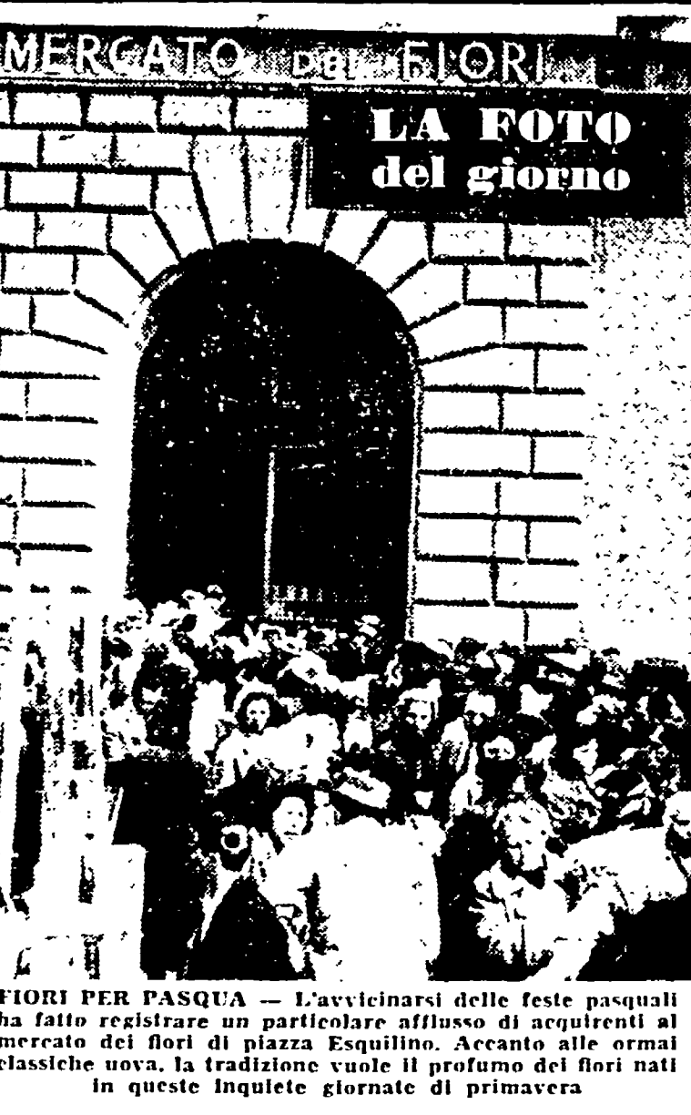
LA FOTO del giorno

Abbiamo già dato la notizia che i lavoratori installatori delle ditte appaltatrici della Roma Gas scenderanno nuovamente in sciopero, a tempo indeterminato, venerdì prossimo, 12 aprile, per contestare la possibilità di un'intesa tra i lavoratori e gli industriali.