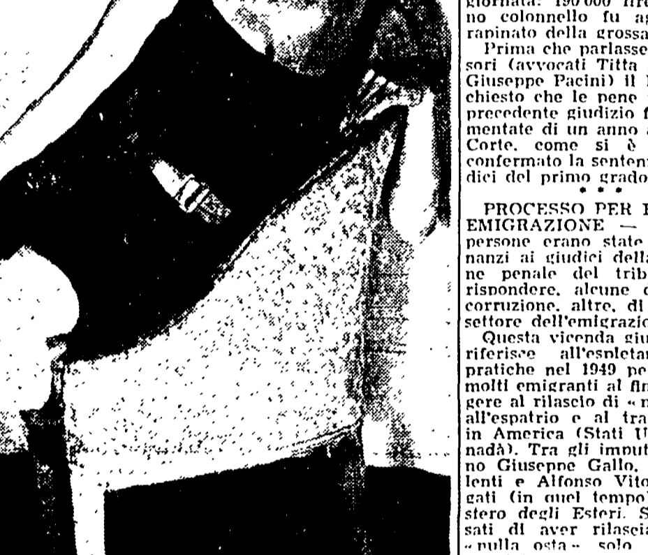
LA BELLA « GREVE » — Malgrado sia la più « sofisticata » delle dive italiane, Elsa Martinelli non è aliena dalle parole aeree romanesche, quando è il caso

Alle ore 17.20 del 3 agosto 1956, Elsa Martinelli con la sua automobile si era fermata nei pressi del Grand Hotel, a Roma, tentando di posteggiare la vettura in un viale dei giardini. Mentre la diva, fermata l'auto, stava per scendere,