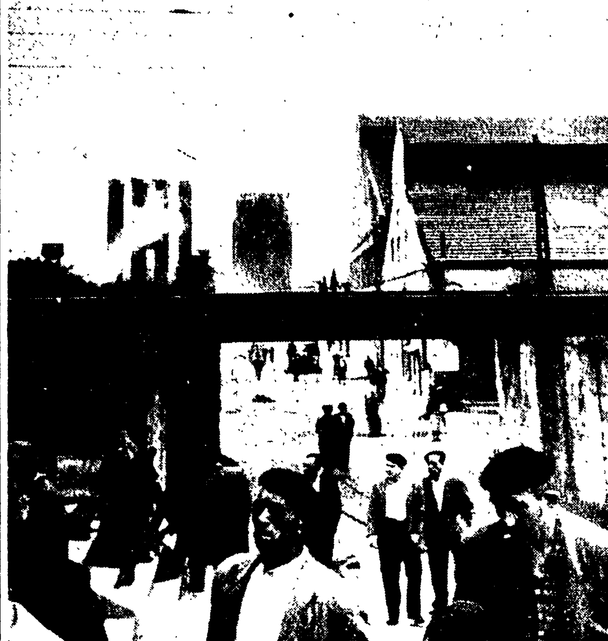
BILBAO - Un importante nucleo della classe operaia spagnola è nuovamente in movimento contro il regime franchista. Gli operai dei cantieri navali della « Constructora Naval » e della « Habcock-Wilcox » hanno scioperato ieri mattina...