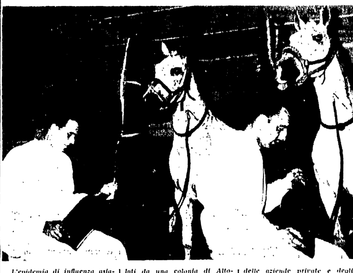
L'epidemia di influenza asiatica continua a svilupparsi, impetuosamente, sia pure in forma benigna, in modo inquietante, in tutti i continenti. In Sicilia, 41 ragazzi stato-tunisini sono stati colpiti dal male appena giunti nella colonia. In Napoli il contagio sta estendendosi, e si registra un nucleo familiare di influenza. A Torre Annunziata, il 50% dei dipendenti delle aziende private e degli uffici pubblici ha dovuto recarsi in luoghi di lavoro. Casi di «asiatica» sono stati accertati anche in provincia di Bari. Nella foto: un istituto farmaceutico sta sottoponendo al microscopio i materiali dell'industria di siero di cavallo. Ecco un momento dell'operazione.