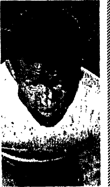
E' regolare la classifica del "Trofeo Desgrange-Colombo"? No, non è regolare. E' perché il regolamento del Trofeo Desgrange-Colombo, che è stato "invitato" al Giro d'Italia.

E' regolare la classifica del "Desgrange Colombo"?