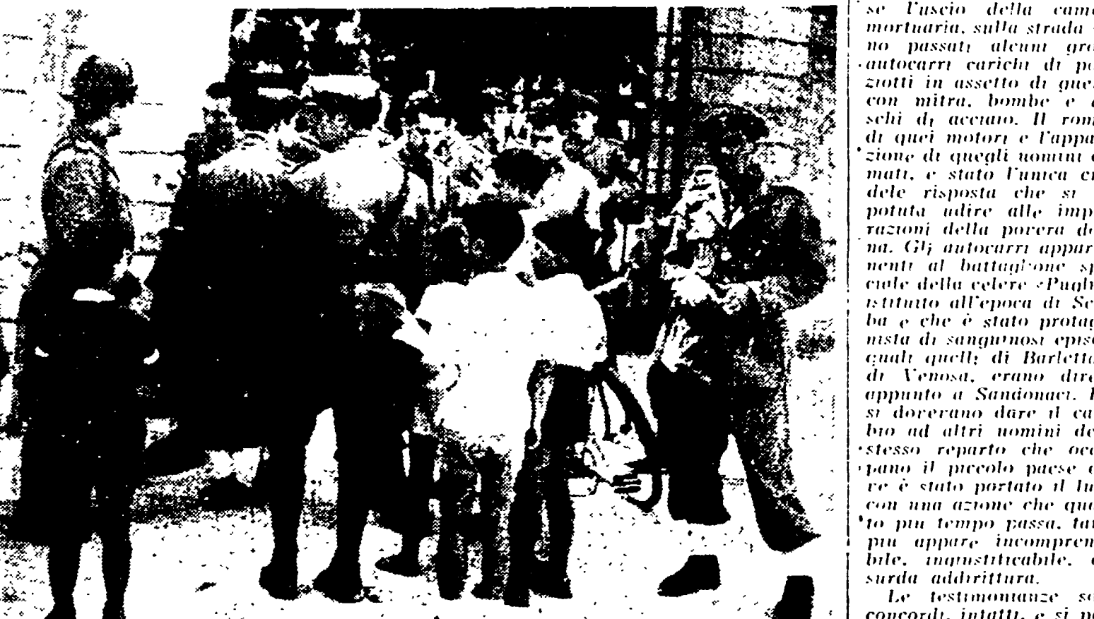
SAN PIETRO VERNOTICO — La scuola, unico edificio requisibile, presidiata dagli agenti di polizia