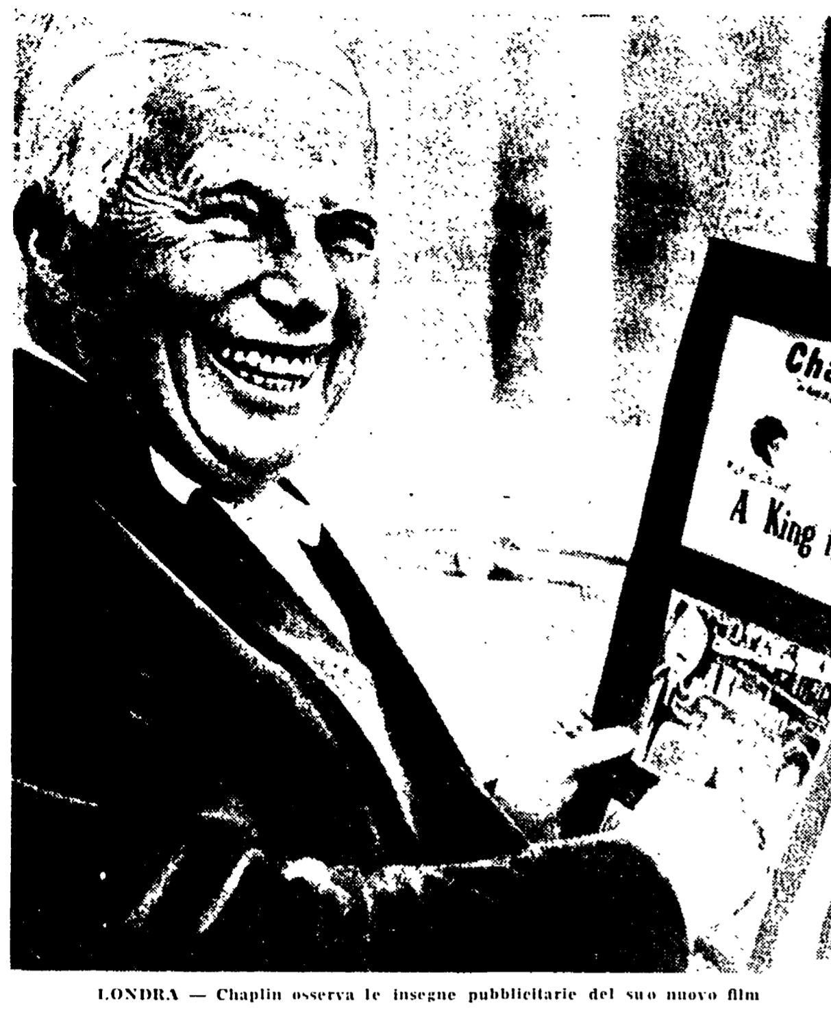
LONDRA - Chaplin osserva le insegne pubblicitarie del suo nuovo film

Eccellente esecuzione d'un gruppo di nuove opere del maestro settantacinquenne