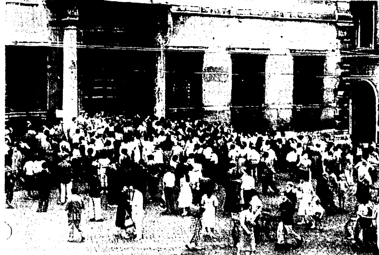
COSI' PER TRE ORE - Un momento della manifestazione dei baraccati davanti alla Prefettura: giungono delegazioni da decine di «borghetti».

Gli aumenti vanno da 2.000 a 14.000 lire - Pesanti maggiorazioni sui contributi di laboratorio