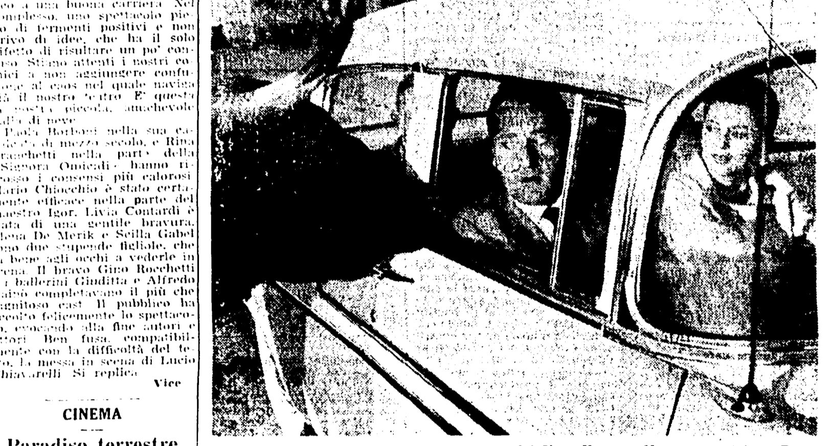
Alberto Sordi ed Anne Vernon in una scena del film «Il conte Max» presentato a Roma dalla Cineriz