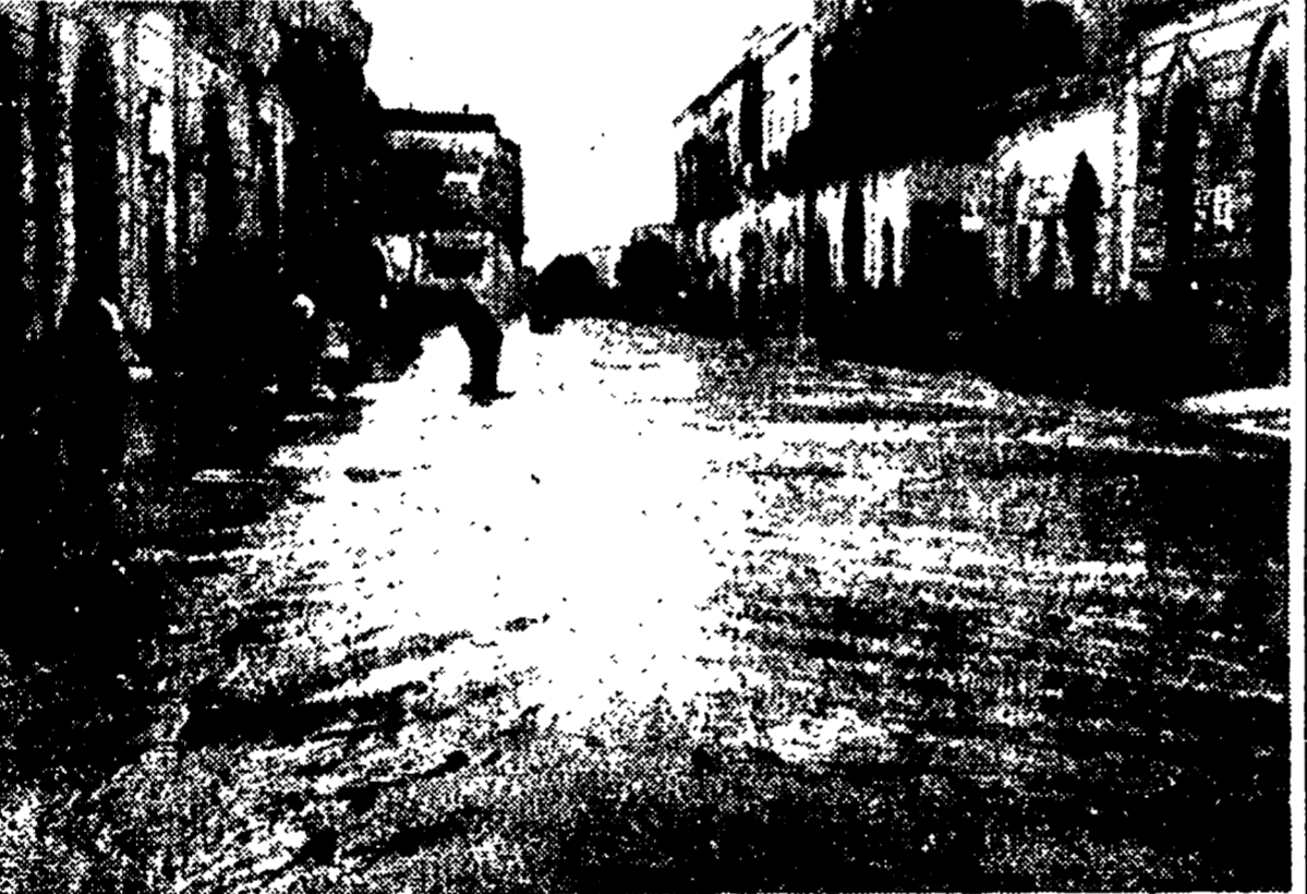
FOGGIARDI (Bari) - Le strade sono ancora allagate dopo 24 ore dall'alluvione (teletelo)