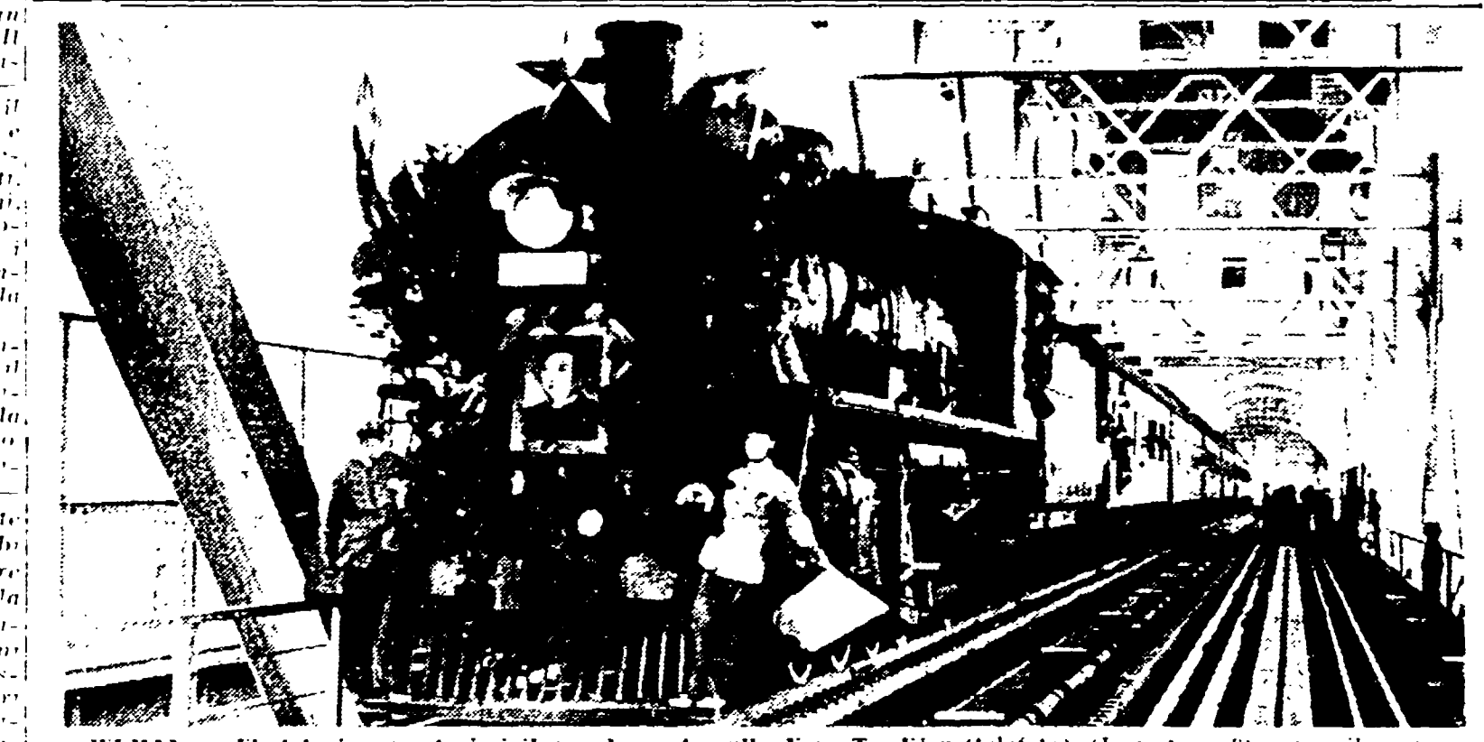
WHAN - È stato inaugurato ieri il grande ponte sulle Yang Tze Kian (telefoto). (Lasciato in 5ª pagina il servizio del nostro inviato speciale)