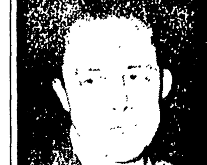
Lo scrittore Camus