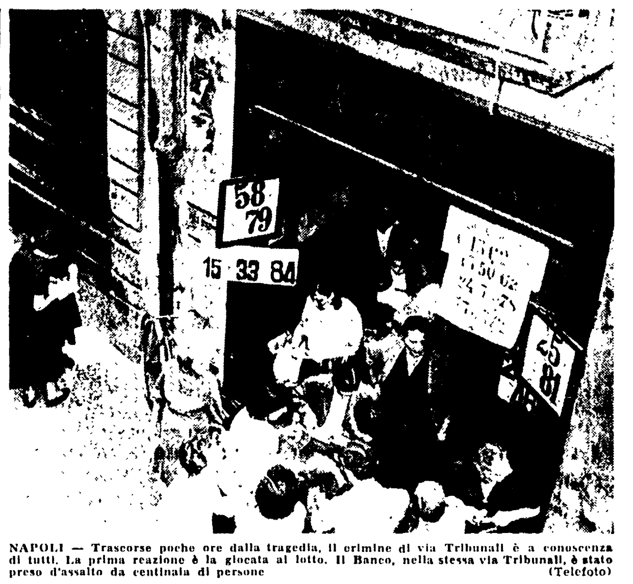
NAPOLI - Trascese poche ore dalla tragedia, il crimine di via Tribunali è a conoscenza di tutti. La prima reazione è la rivolta al tutto. Il Banco, nella stessa via Tribunali, è stato preso d'assalto da centinaia di persone