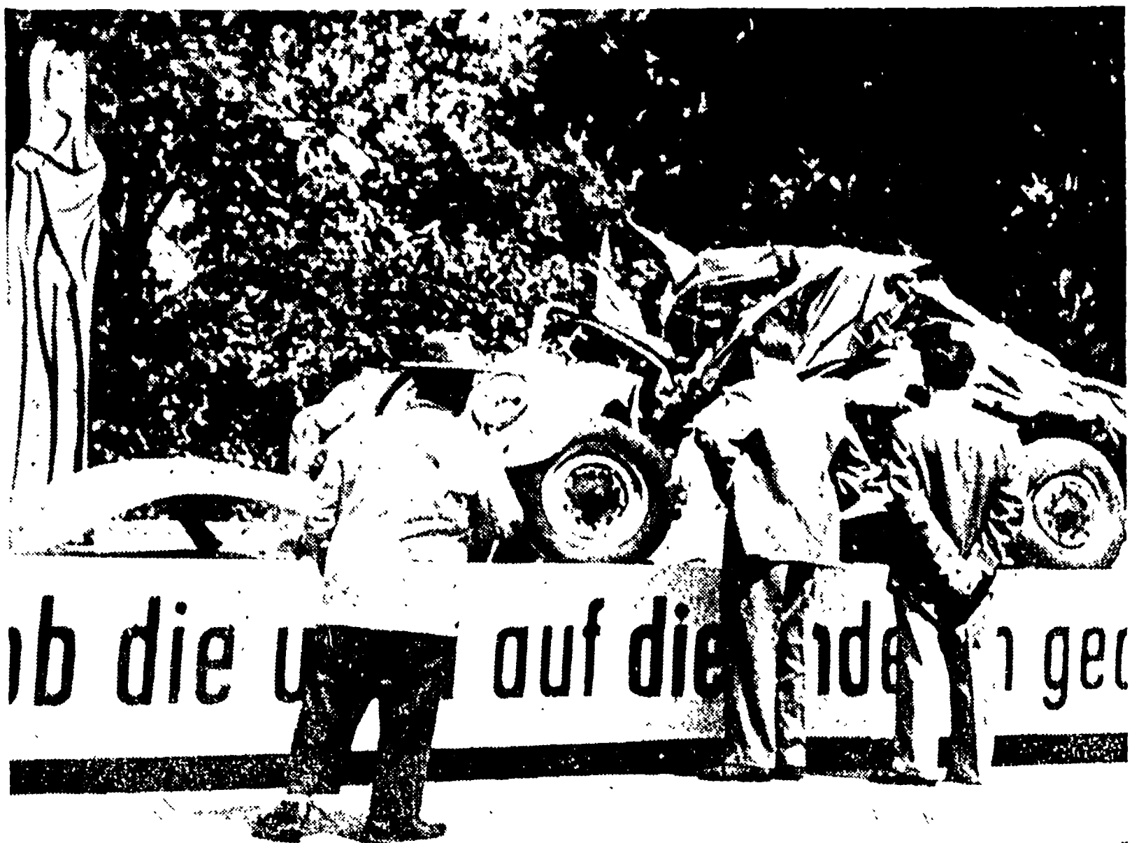
Nella Germania occidentale è attualmente in sviluppo una campagna propagandistica contro il dilagare degli incidenti stradali...