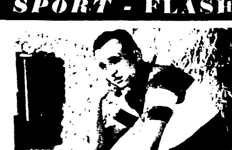
BALDINI per l'Equipe è secondo solo ad Anquetil

Calcio: tolti la squalifica a Pivatelli Nella sua riunione odierna, la C.A.F. della FIGC, tra le altre deliberazioni, ha accettato il reclamo del Bologna contro la squalifica inflitta al giocatore Pivatelli per la gara Lazio-Bologna del 15 settembre. E' stato reso noto l'ordine del giorno del consiglio della FIGC fissato per il 14 novembre. Eccolo: nomina del presidente della FIGC, approvazione del verbale della precedente riunione, nomina del presidente della FIGC, nomina del presidente della FIGC, nomina del presidente della FIGC, nomina del presidente della FIGC, nomina del presidente della FIGC.