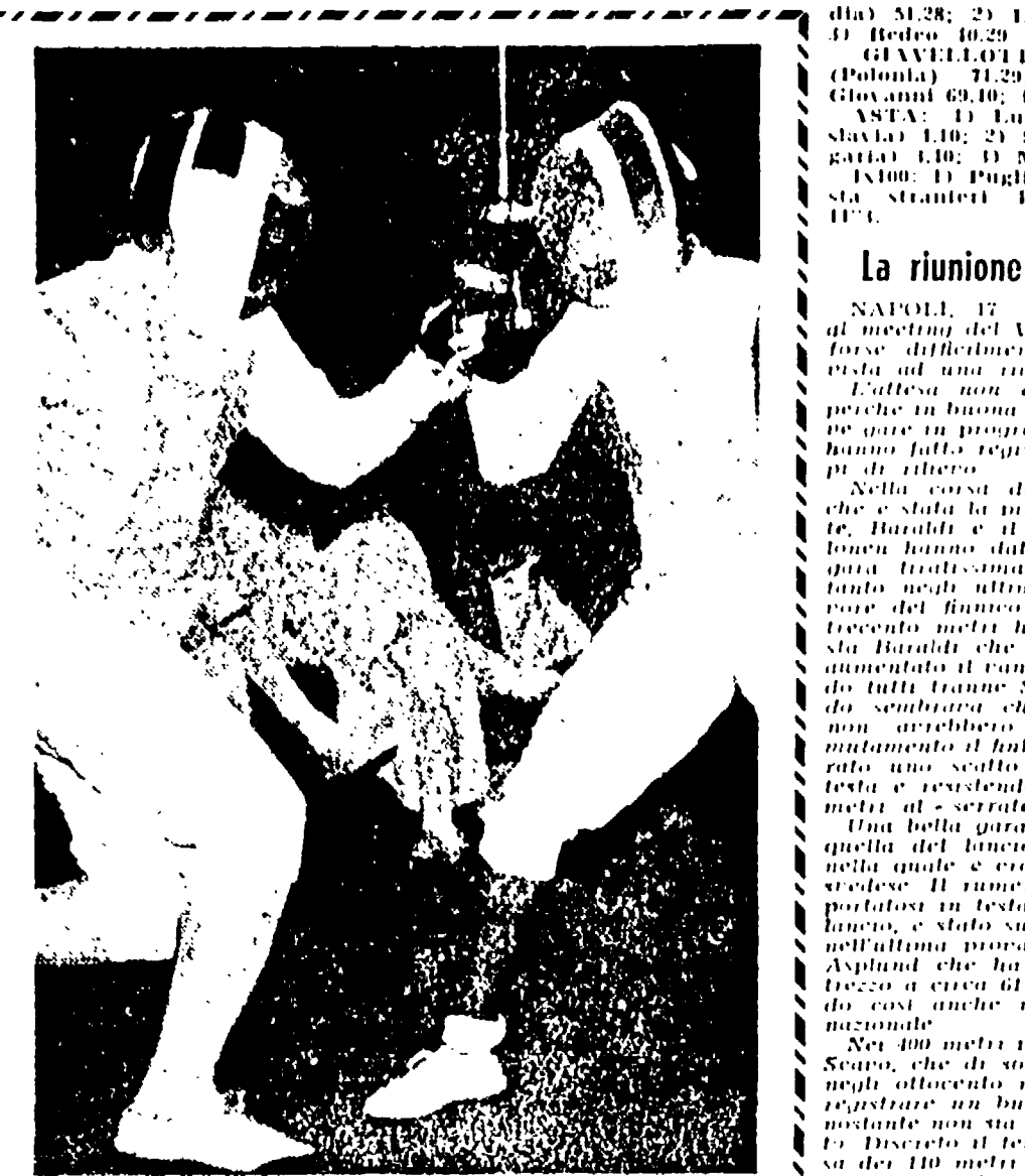
La riunione di Napoli

NAPOLI, 17. - Molti atleti del meeting del Conip, quando si riunirono alla Palazzina di Stato ad una riunione atletica. L'atletica non è stata trattata perché in buona parte della serata era in programma gli atleti hanno fatto registrare dei tempi inferiori ai previsti.