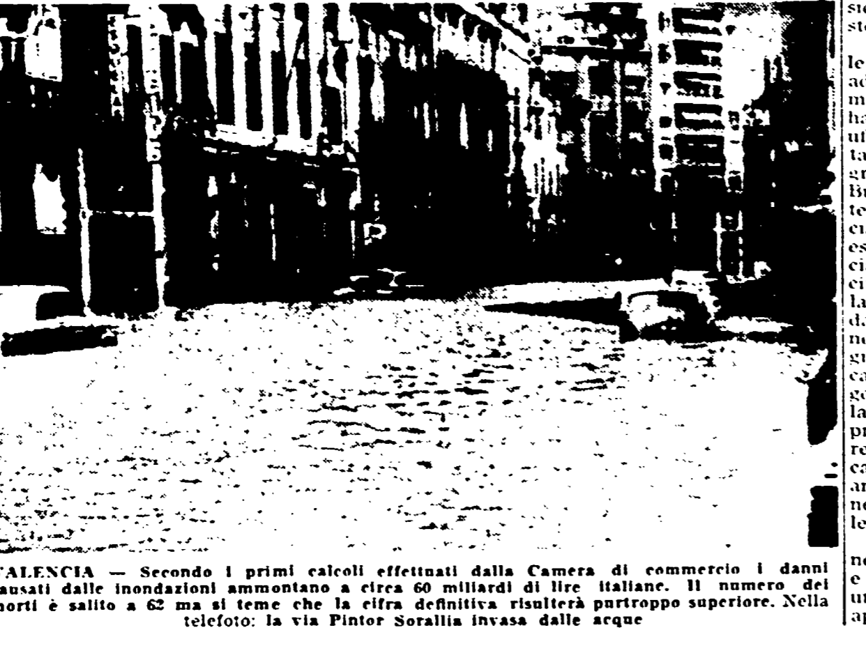
VALENCIA - Secondo i primi calcoli effettuati dalla Camera di commercio i danni causati dalle inondazioni ammontano a circa 60 miliardi di lire italiane. Il numero dei morti è salito a 62 ma si teme che la cifra definitiva risulterà purtroppo superiore. Nella foto: la via Pintor Sorallia invasa dalle acque

«L'idea di un satellite artificiale che orbita attorno alla Luna, è stata fatta da un gruppo di scienziati sovietici che si occupano di problemi di volo spaziale».