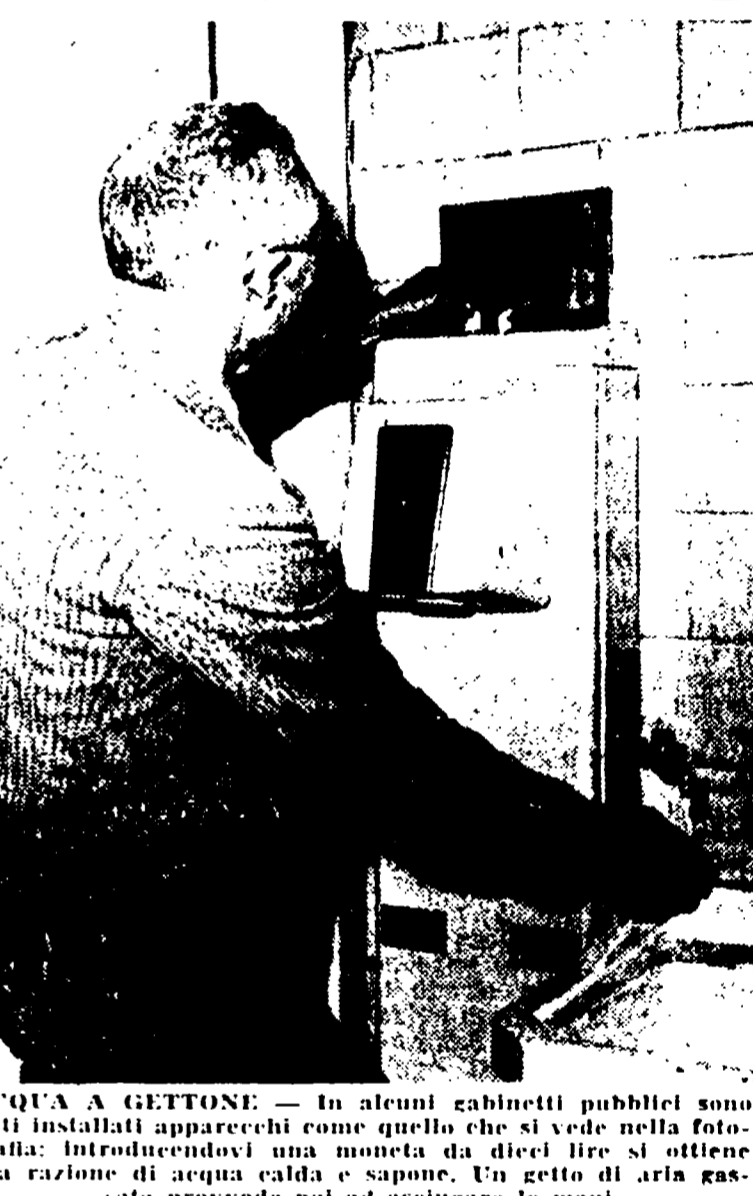
ACQUA A GETTONE - In alcuni gabinetti pubblici sono stati installati apparecchi come quello che si vede nell'ottorina. Introducendo una moneta da dieci lire si ottiene una razione di acqua calda e sapone. Un getto di aria compressa provvede poi ad asciugare le mani