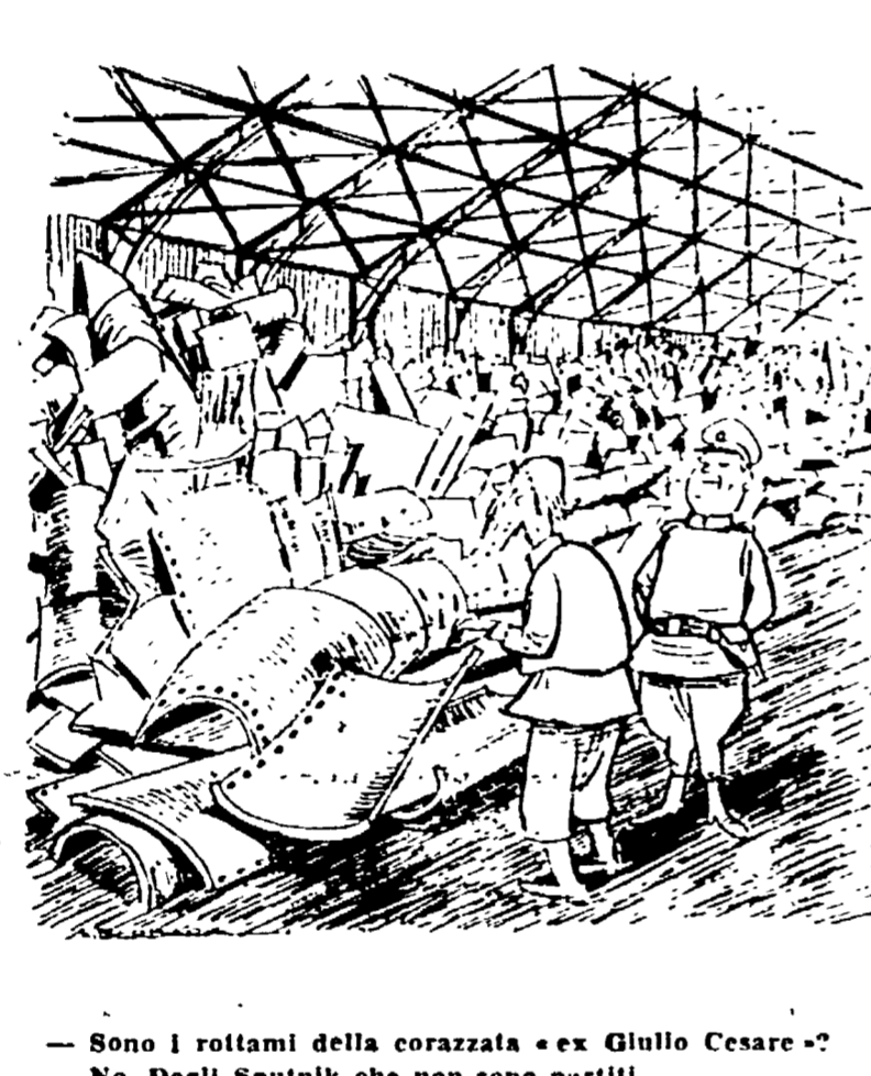
Sono i rotolanti della corazzata «ex Giulio Cesare» - No, Degli Sputnik che non sono partiti.

LA', DOVE LE COSE ACCADONO, MA NON SI DICONO