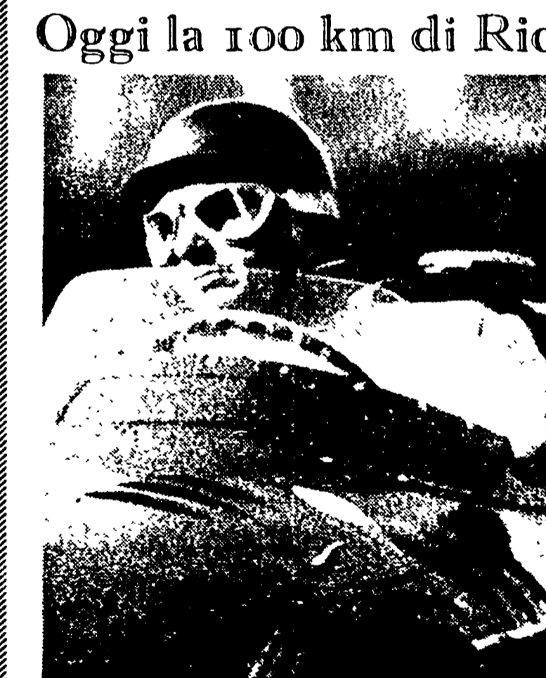
Nella foto: JUAN MANUEL FANGIO

RIO DE JANEIRO. 7. — Alla guida della sua Maserati tre cilindri, Juan Manuel Fangio parteciperà domani alla «Cento chilometri» automobilistica di Rio. Salvo imprevisti, non si vede chi possa insidiare la vittoria al campione del mondo, che cercherà (e con tutta probabilità vi riuscirà) di abbassare il record della corsa da lui stesso stabilito nel 1952 correndo alla media oraria di chilometri 81.981.