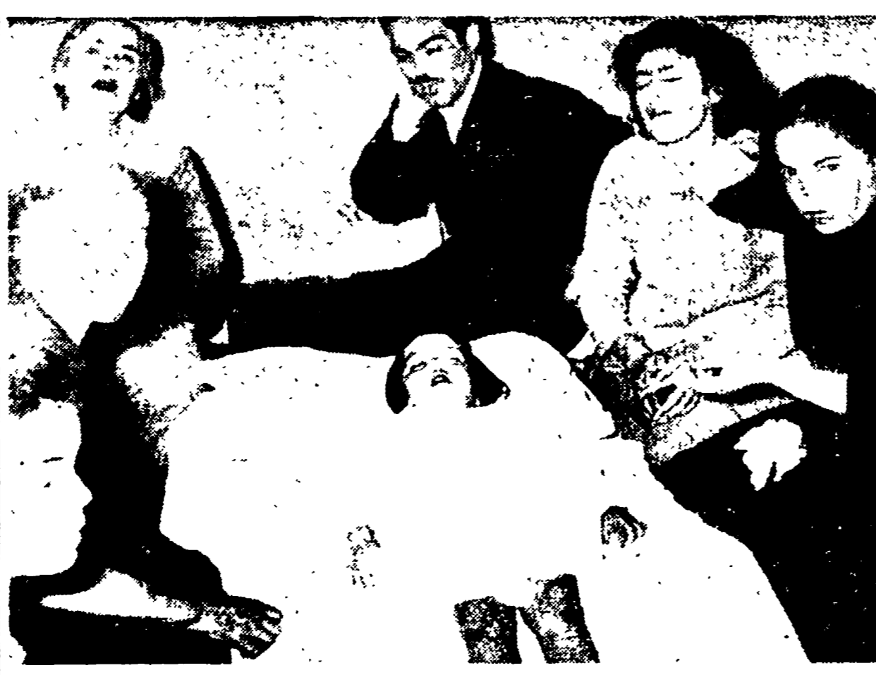
PALERMO - Un gruppo di familiari seduti attorno a un letto ove giace il corpo inanimato di una delle otto bambine rimaste uccise nel crollo della scuola