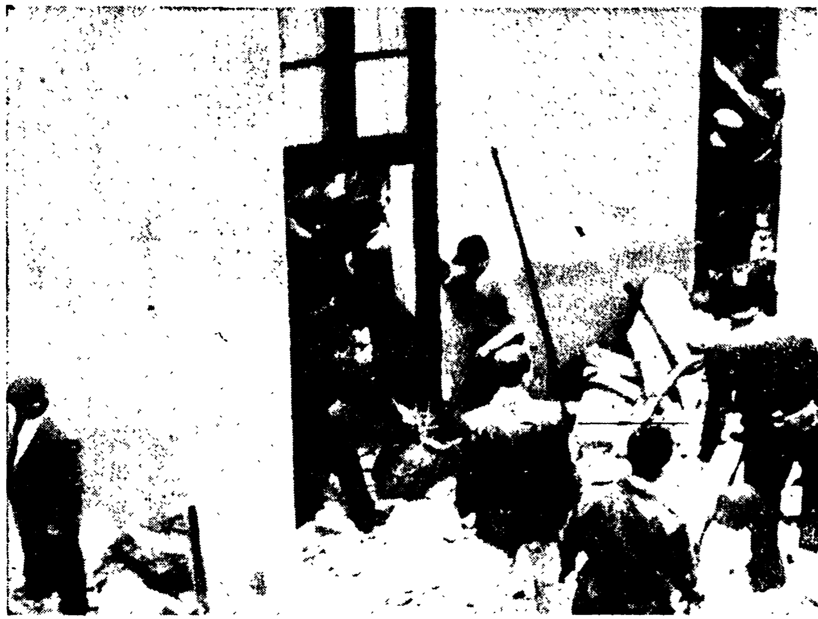
PALERMO - Alcuni volontari, accorsi sul luogo del disastro, si prodigano per rintracciare i corpi delle vittime sepolte sotto le rovine della scuola di Altofonte