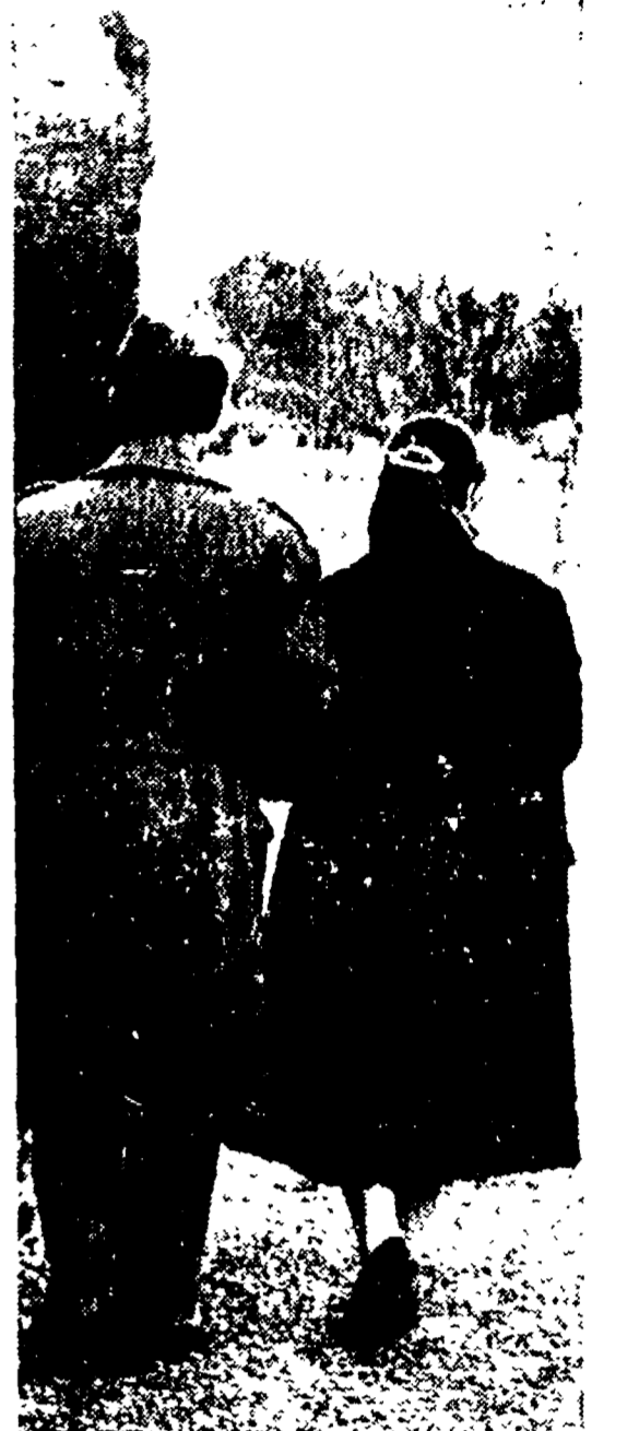
Nell'ordine: Inizio dell'avventura cittadina nell'agenzia di collocamento - 365 giorni ogni anno la visita al mercato - Infine qualche ora di riposo