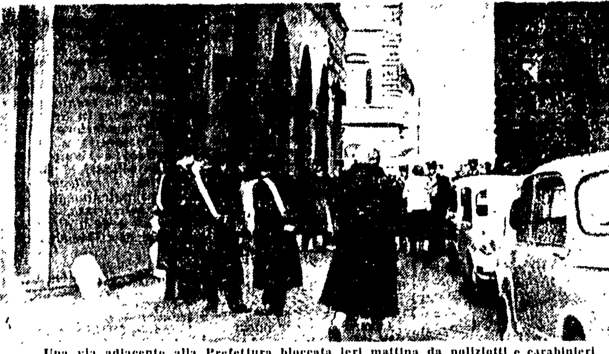
Una via adiacente alla Prefettura bloccata ieri mattina da poliziotti e carabinieri