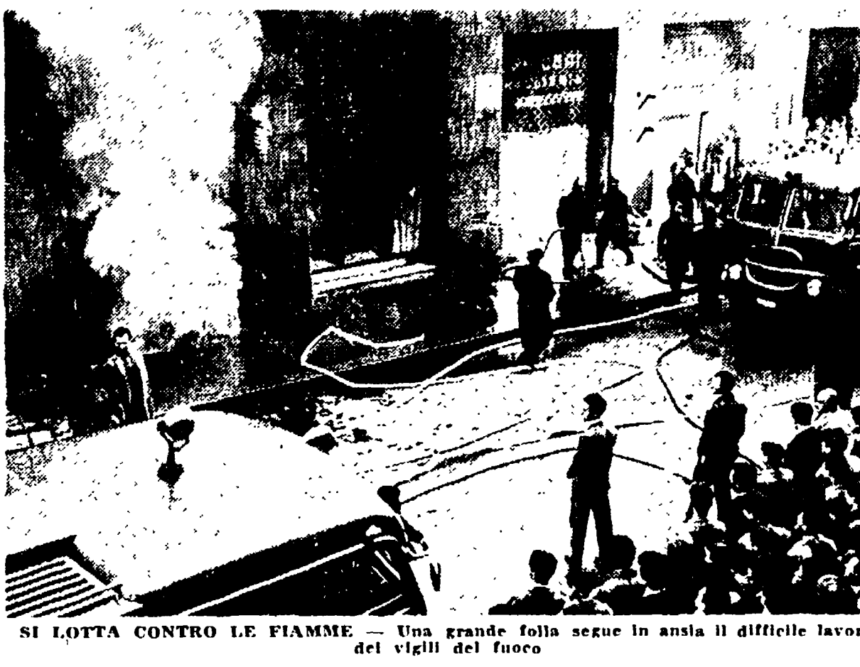
SI LOTTA CONTRO LE FIAMME - Una grande folla segue in ansia il difficile lavoro dei vigili del fuoco

Forse un corto circuito ha provocato il disastro - Altri due locali danneggiati