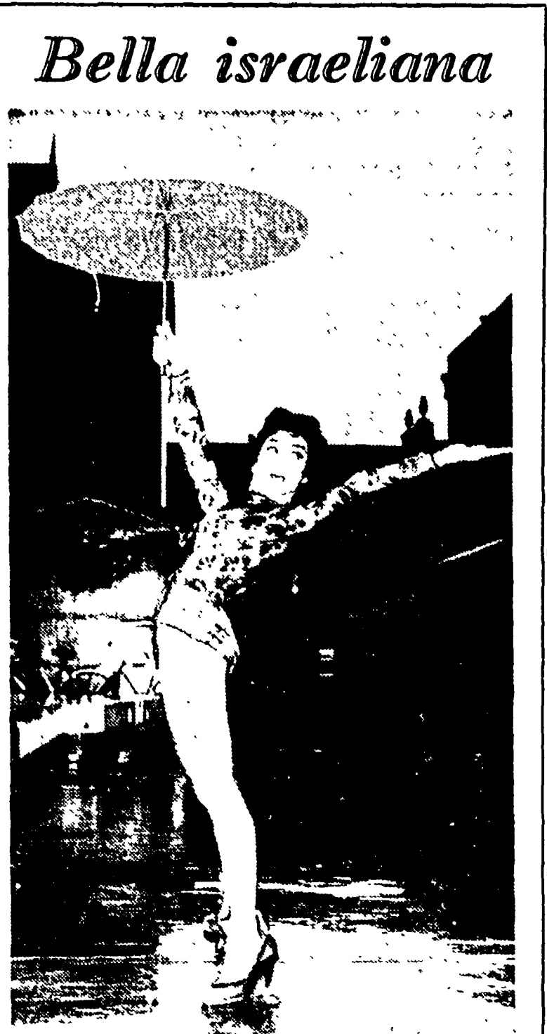
Ziva Rodann è una attrice israeliana. Oltre che farsi fotografare in costume da bagno, tacceti a spillo e ombrellino lavora nel cinema, a Hollywood. Fra non molto tempo apparirà insieme con Elvis Presley nel film "Il re creolo"

Si chiama "tetto", nella campagna intorno a Cuneo, un cascinale o un gruppo di cascinali comprendente fabbricati rustici abitati dai contadini e un "civile", abitazione, un tempo, dei proprietari. Esiste ancora, da qualche anno, un villaggio di contadini, un villaggio di una terra, la sua luce, o infine un senso di vita.