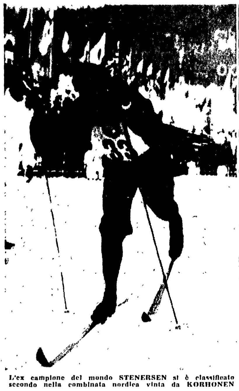
L'ex campione del mondo STENERSEN si è classificato secondo nella combinata nordica vinta da KORHONEN