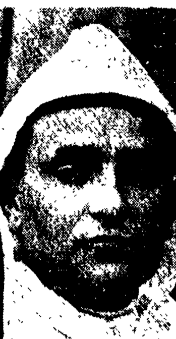
Ben Youssef, il sultano del Marocco

decisione dal preventivo ristabilimento del dialogo fra Parigi e Tunisi. « Che Burghiba faccia il primo passo » avrebbe ripetuto in sostanza Gaillard - e poi discuteremo dell'eventuale concentramento delle nostre guarnigioni su Biserta ». Di qui la frettolosa partenza di Murphy per Tunisi, mentre Gaillard ha rimandato un nuovo consiglio di gabinetto per risolvere il grave problema dei crediti militari supplementari chiesti dal ministro della Difesa per raddoppiare lo sforzo bellico in Algeria. Questa sera del resto si tende a vedere una stretta relazione fra le richieste della destra conservatrice e il rifiuto del governo al « signor Buoniuffici », e si ha l'impressione che le difficoltà interne che minacciano Gaillard superino, nell'immediato, quelle derivanti dalla crisi franco-tunisina. I ministri gollisti e conservatori, opponendosi alla politica di riconquista coloniale caldeggiata dalle autorità di Algeri, premono attualmente sul governo per strappargli lo scudo di altri 50 mila uomini in Algeria e la concessione di almeno 60 miliardi supplementari al vistoso bilancio della Difesa.