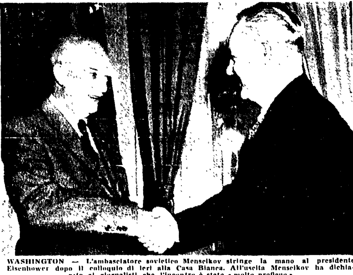
WASHINGTON - L'ambasciatore sovietico Mensikov stringe la mano al presidente Eisenhower dopo il colloquio di ieri alla Casa Bianca...