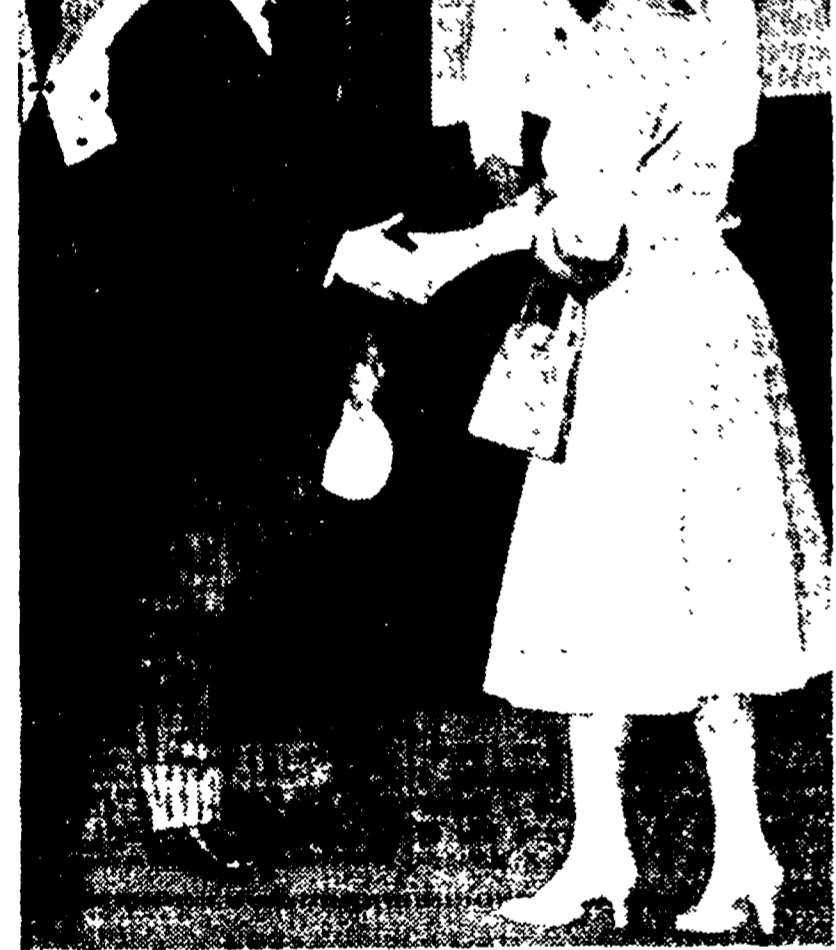
LONDRA — L'incontro fra Gronchi e la regina Elisabetta alla stazione Vittoria. (Telefoto)