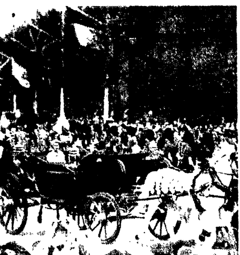
LONDRA — Elisabetta II e Gronchi in carrozza per le vie della capitale.