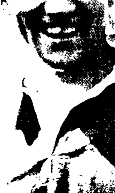
L'Alta CUSH, che segnò tre goals «azzurri», è stato ancora una volta il migliore in campo