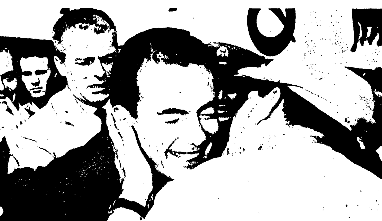
Nella foto: JEAN BEHRA. Il francese Jean Behra si è aggiudicato, in modo trionfale, il Gran Premio automobilistico di Rouen...