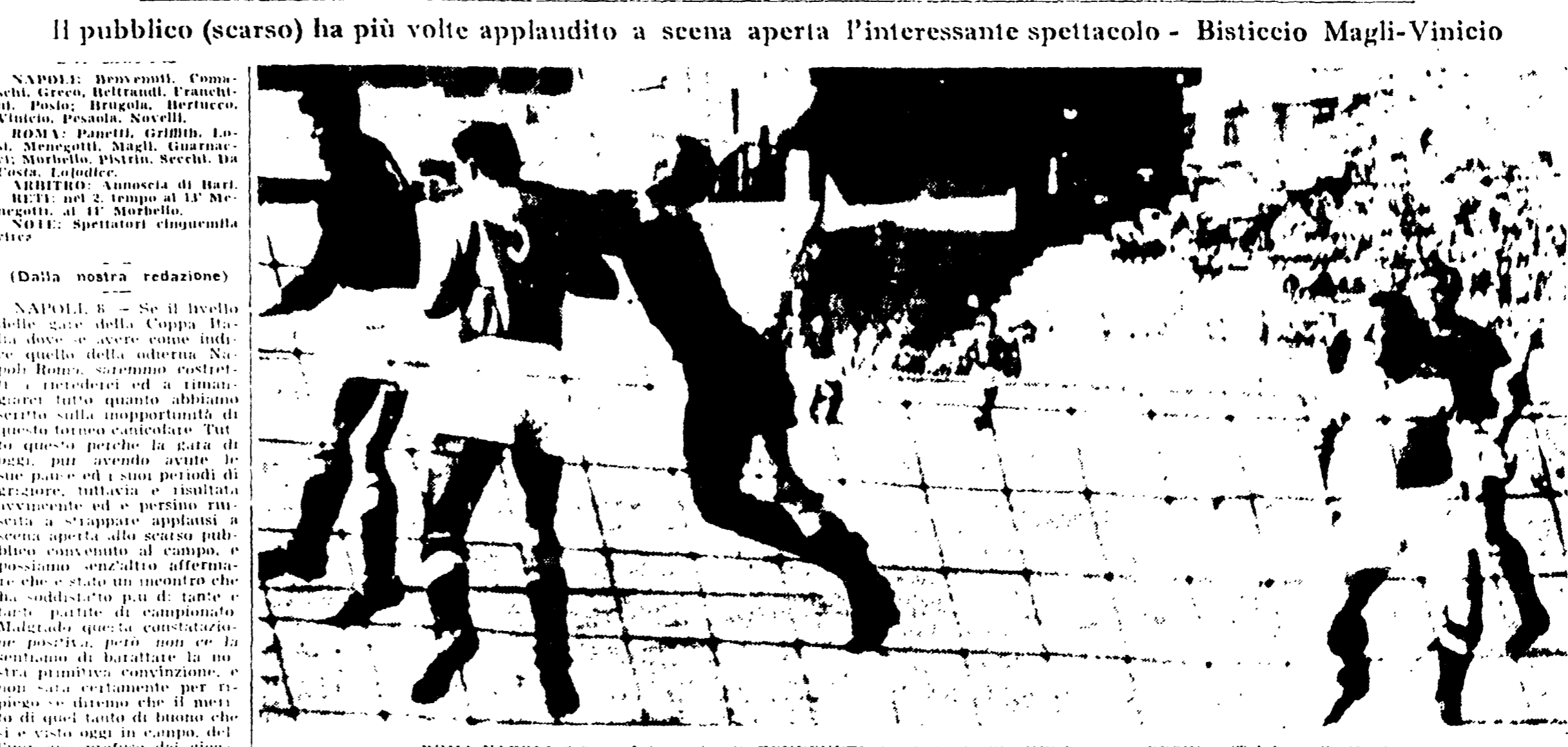
Il pubblico (scarso) ha più volte applaudito a scena aperta l'interessante spettacolo - Bisticcio Magli-Vinicio