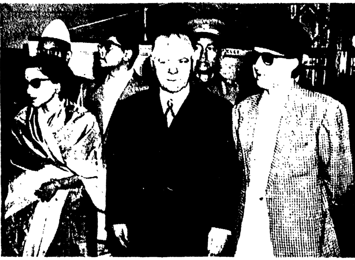
MOSCA. - Il re del Nepal, Mahendra Bir Bikram Shah e la regina Ratna Rajshree Lakshmi, che si trovano attualmente in URSS per una visita di tre settimane, fotografati al Cremlino con il Presidente Voroslov. E' questa la prima volta che un monarca del Nepal si reca nell'Unione Sovietica.