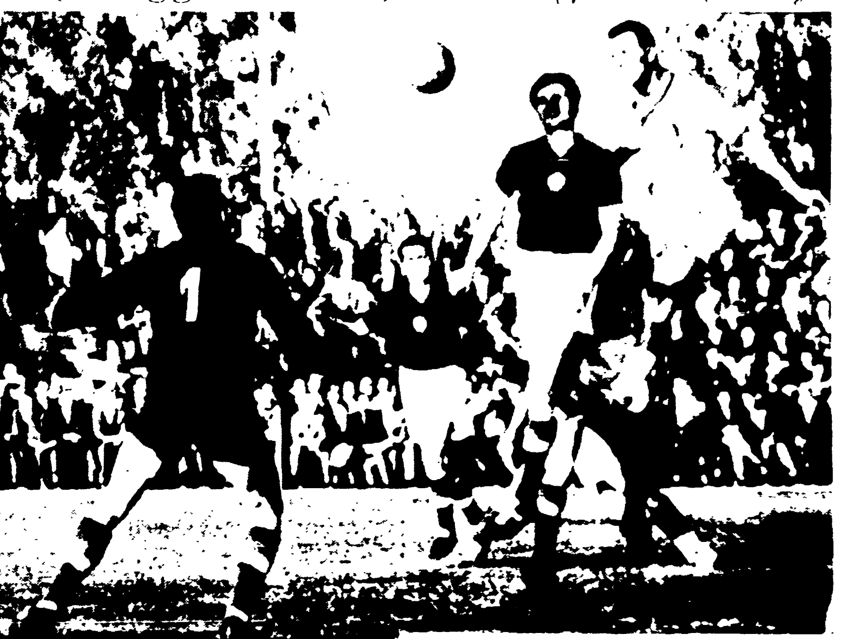
UNGHIERA-GALLES 1-1 — CHARLES scena di testa il goal del pareggio per il Galles

UNGHIERA: Grosics, Marai, Sarosi, Borak, Sipos, Berandi, Sandor, Hudekuti, Tichy, Bandrak, Fensyevy, GALLIS, Kelsey, Williams, Hopkins, Sallitan, Mel Charles, Bowen, Webster, Medwin, John Charles, Ivor Allchurch, Jones.