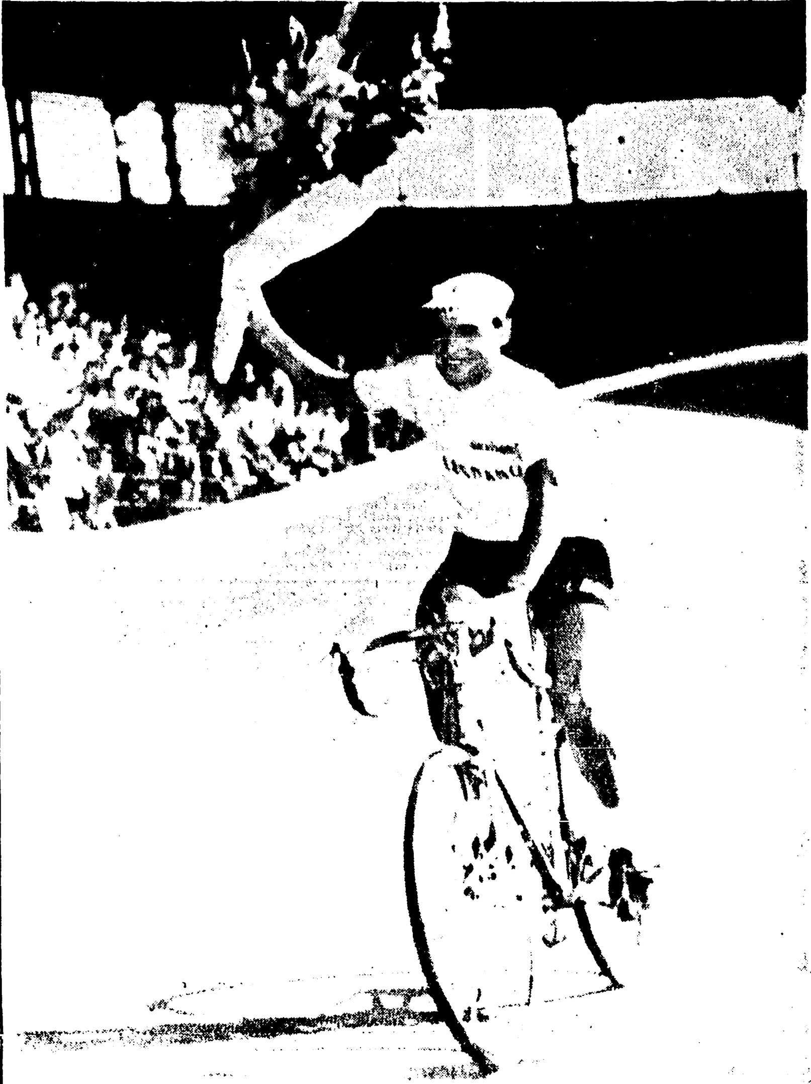
MILANO - Ercole Baldini compie il giro d'onore

Lo spagnolo Poblet vince l'ultima tappa - La classifica generale: 1) Baldini; 2) Brankart a 1'17"; 3) Gaul a 6'7"; 4) Bobet L. a 9'27"; 5) Nencini a 10'36"; 6) Poblet a 11'07"; 7) Lorono a 12'12"; 8) Geminiani a 13'12"; 9) Fornara a 14'13"; 10) Moser a 15'