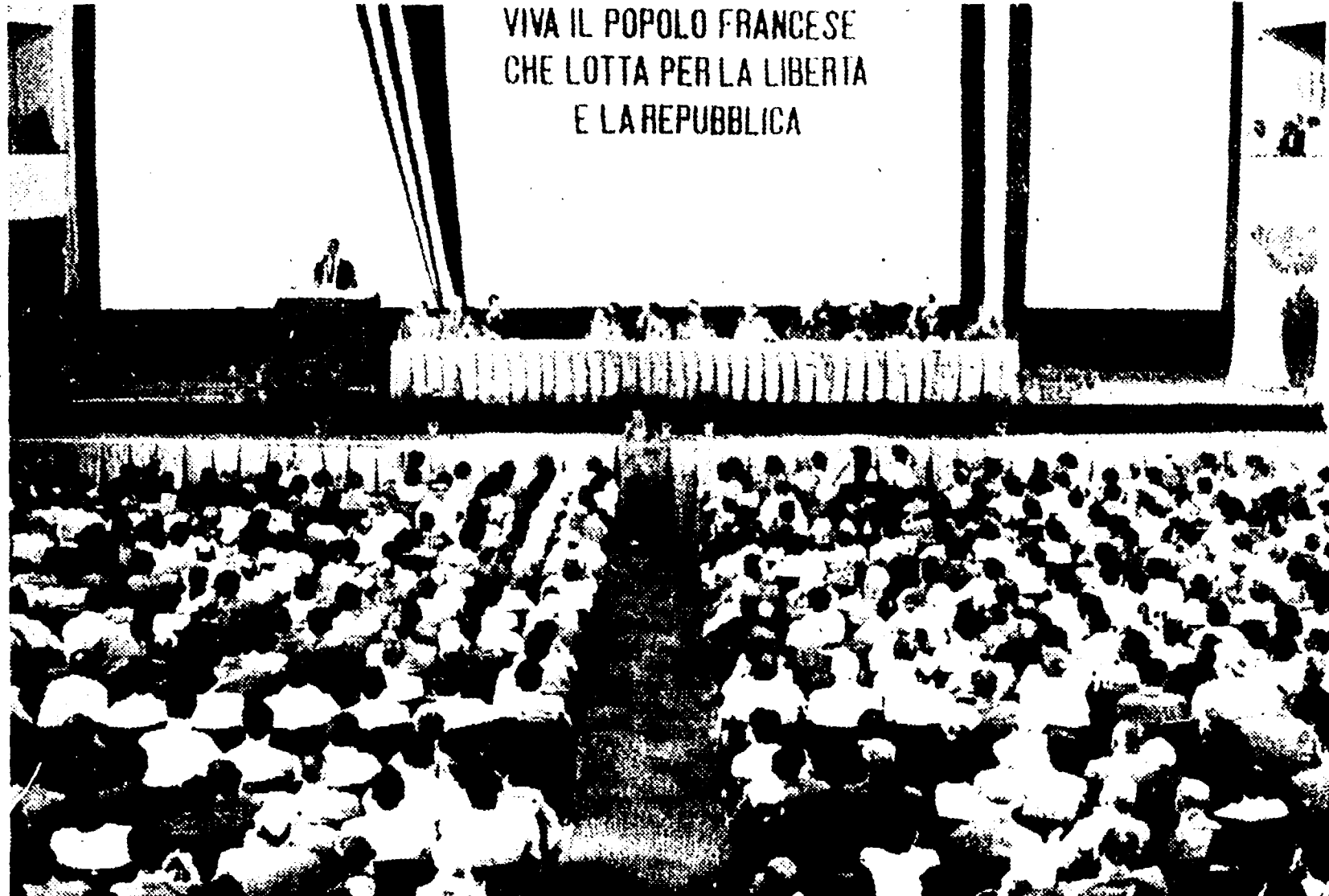
VIVA IL POPOLO FRANCESE CHE LOTTA PER LA LIBERTÀ E LA REPUBBLICA

Ingrao: l'imperialismo è entrato in crisi nel suo punto più debole, il colonialismo. La Quarta Repubblica è colpita perché non si è voluto tagliare il bubbone dell'oppressione coloniale - L'intervento di Molé - Appello all'unità democratica in Italia